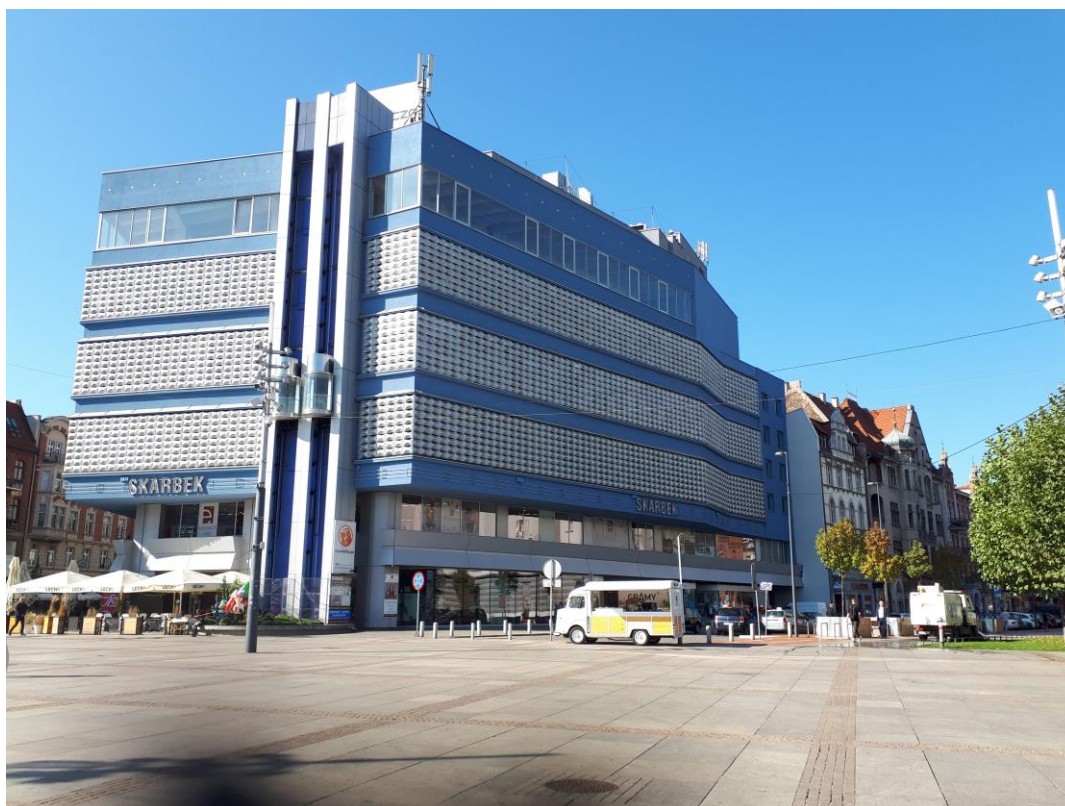
Fot. 1: Widoki anten stacji bazowych: ID: BT20356, ID: KAT0002, zlokalizowanych: ul. Mickiewicza 4, Katowice