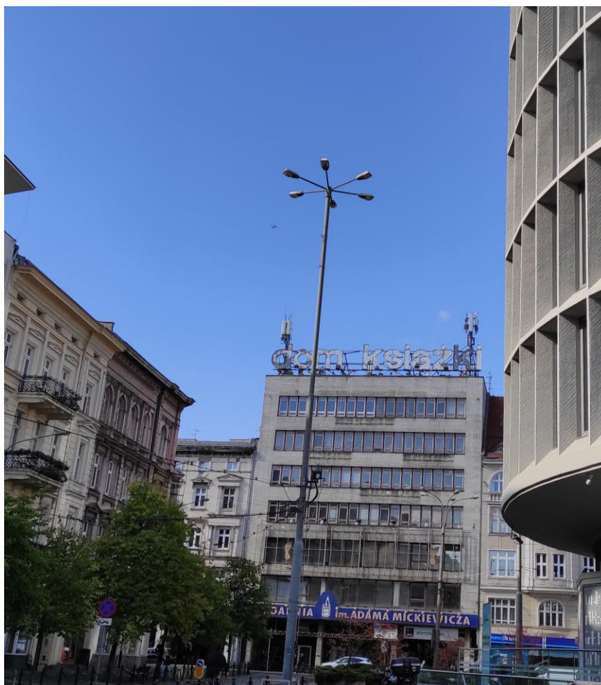
Fot. 1: Widoki anten stacji bazowych: ID: BT32298 oraz ID: 1114, zlokalizowanych: ul. Gwarna 13, Poznań