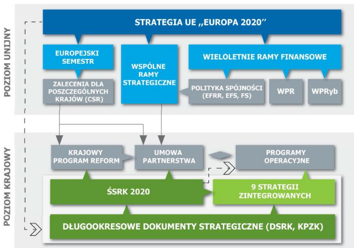
Rysunek 2. Powiązanie dokumentów strategicznych Polski i UE 20

Na niżej przedstawionym schemacie przedstawiono powiązanie tych dokumentów ze strategicznymi dokumentami UE.