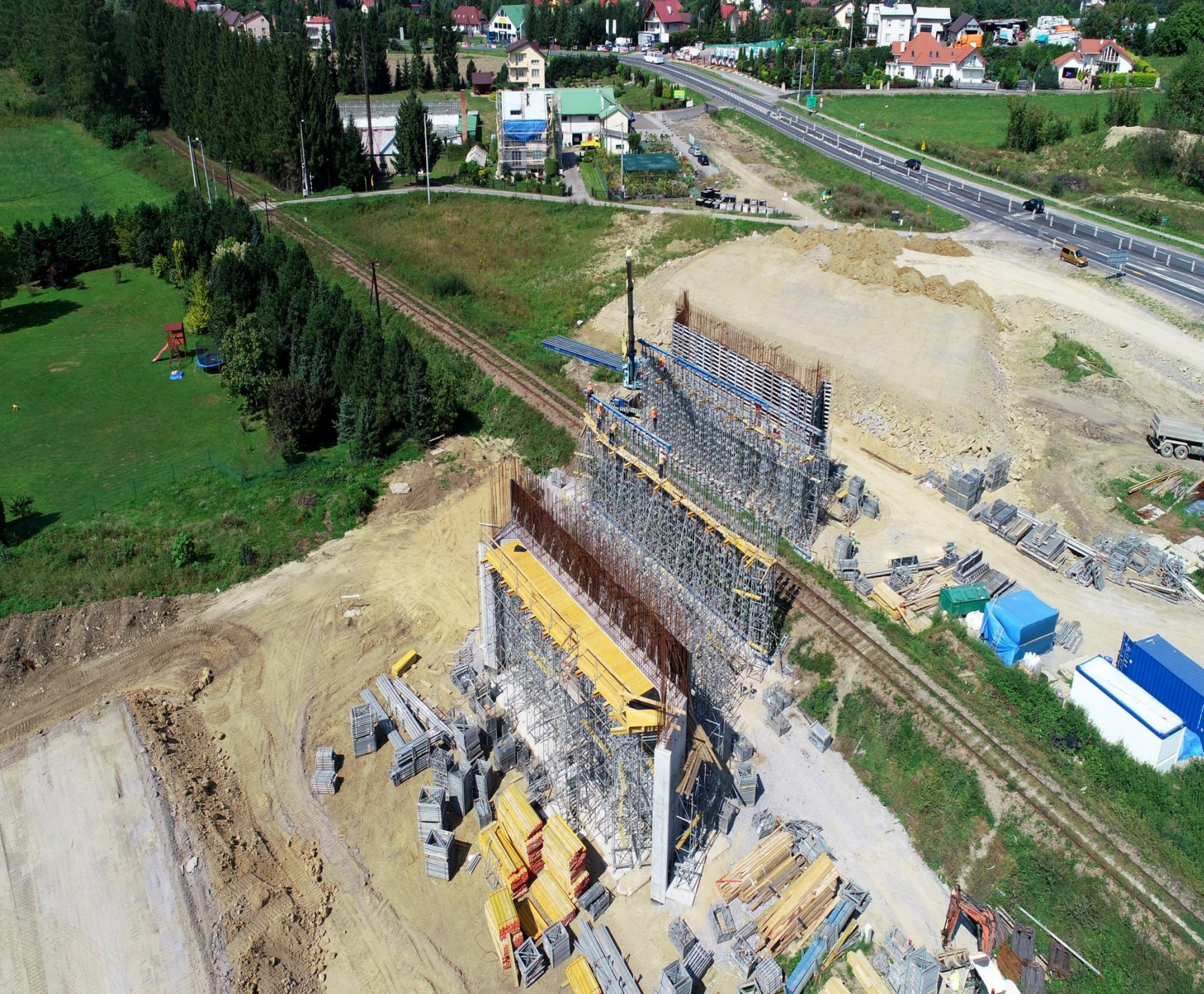
Budowa obwodnicy Sanoka w ciągu drogi krajowej 28