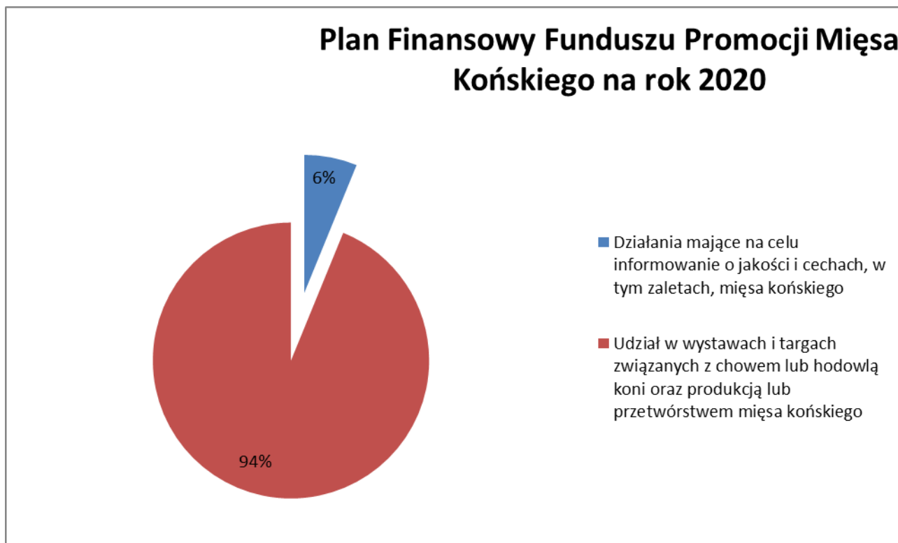
Wykres nr 3. Struktura Planu finansowego FPMK na 2020 rok

W Planie finansowym FPMK na rok 2020 na zadania zgodne z celami Funduszu Promocji Mięsa Końskiego przeznaczono kwotę 81 000,00 PLN . Komisja Zarządzająca Funduszu Promocji Mięsa Końskiego uchwaliła Plan finansowy Funduszu Promocji Mięsa Końskiego na rok 2020 uchwałą nr 5/2019 z dnia 25.11.2019 r., a następnie zmieniała Plan finansowy FPMK na rok 2020 uchwałą nr 2/2020 z dnia 27.08.2020 r.