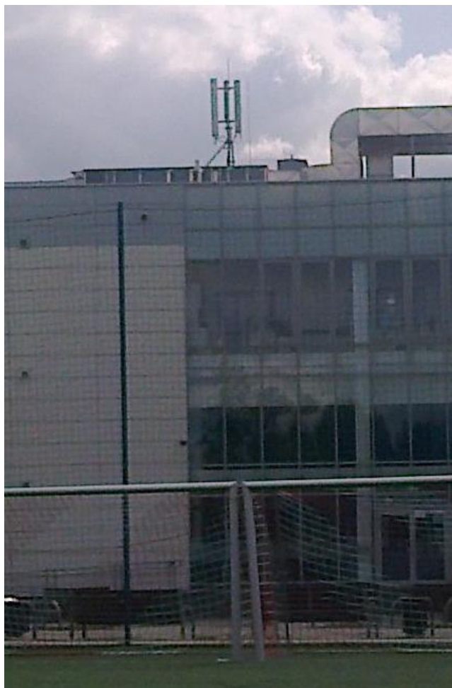
Fot. 1: Widok anten stacji bazowej; ID: BYD1038A zlokalizowanej pod adresem: ul. Sportowa 2, 85-091 Bydgoszcz