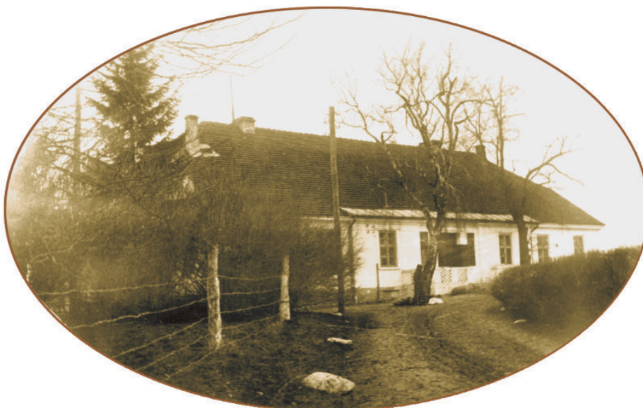
Pierwsza siedziba Ogniska Kultury Rolnej i Zakładu Doświadczalnego

Zajmowano się reprodukcją zbóż najodpowiedniejszych dla tego rejonu i przekazywano je do siewu rolnikom. Zadanie to realizowano na polach tzw. ogólnego gospodarstwa polo-