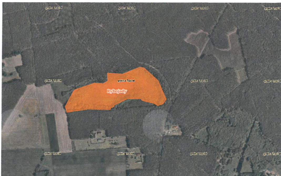
Ryc. 1. Mapa lokalizacji rezerwatu przyrody „Rybojady”