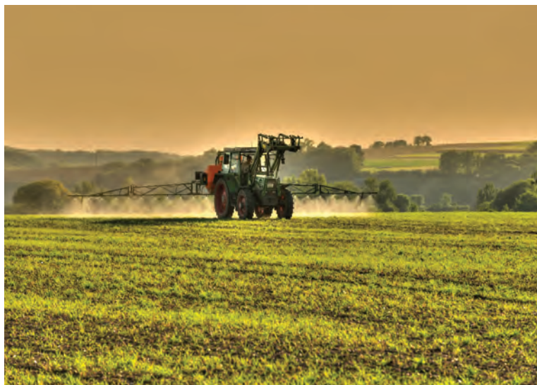
Zaproponowane w specustawie dot. COVID-19 rozwiązania wprowadzają na okres obowiązywania stanu epidemii odstępstwa od obowiązków poddawania okresowym badaniom sprawności technicznej sprzętu przeznaczonego do stosowania środków ochrony roślin

W celu ułatwienia działania producentom rolnym i przedsiębiorcom w okresie obowiązywania ograniczeń wprowadzonych w związku z wystąpieniem wirusa SARS-CoV-2, zaproponowano również przesunięcie ter-