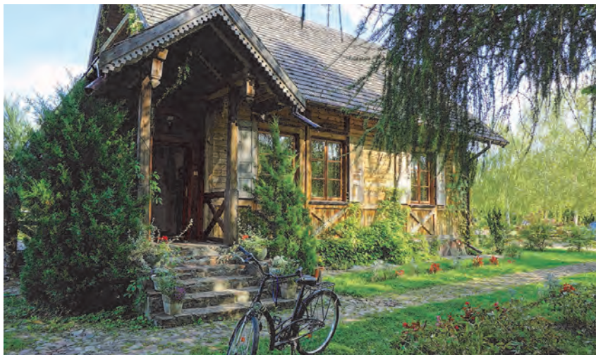
Warto pamiętać, że po ustaniu epidemii, gdy tylko podróżowanie stanie się możliwe, obiekty agroturystyczne z małą liczbą miejsc noclegowych, położone z dala od dużych skupisk ludzkich, mogą być odbierane, jako bezpieczniejsze, a tym samym bardziej atrakcyjne

Ale epidemia i jej skutki to nie tylko liczenie strat i ich minimalizowanie. To także nowe szanse na udział w unijnym i globalnym eksporcie artykułów rolno-spożywczych po zakończeniu okresu epidemii. To również szansa na skrócenie łańcucha dostaw na krajowym rynku konsumenckim poprzez upowszechnienie sprzedaży bezpośredniej, w tym rów-