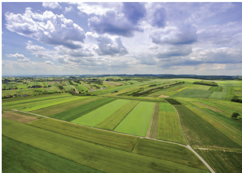
Ze względu na sytuację wynikającą z pandemii do 15 czerwca 2020 r. został przedłużony termin składania wniosków o przyznanie płatności bezpośrednich

Należy jednocześnie podkreślić, że w Polsce już od roku 2016 zaliczki na poczet płatności bezpośrednich realizowane są w wysokości 70% (na podstawie corocznych derogacji wydawanych przez Komii