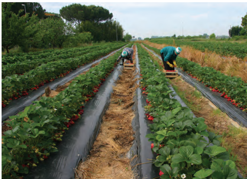
Wprowadzono dodatkowe rozwiązania dotyczące pobytu i zatrudnienia cudzoziemców umożliwiające przedłużenie pobytu cudzoziemców na terytorium Rzeczypospolitej Polskiej i co bardzo ważne, ich legalną pracę

Ważność kart pobytu, których okres ważności, o którym mowa w art. 244 ust. 1 pkt 16 ustawy z 12 grudnia 2013 r. o cudzoziemcach , upłynął w czasie stanu zagrożenia epidemicznego lub stanu epidemii, przedłuża się do 30 dnia od dnia odwołania tego ze stanów, który obowiązywał jako ostatni. W takim przypadku nie wydaje się i nie wymienia kart pobytu.