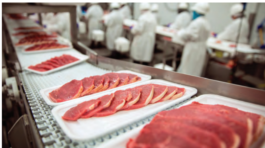
W sytuacji osłabienia wzrostu gospodarczego powodowanego stanem epidemii w szczególności trudnej sytuacji znajdują się małe i średnie zakłady przetwórcze, które dysponują najmniejszym kapitałem obrotowym oraz liczbą pracowników

W porównaniu z innymi branżami, sektor rolno-spożywczy może być w mniejszym stopniu dotknięty ograniczeniami, gdyż wytwarzane są w tym sektorze produkty pierwszej potrzeby, które cechują się niższą elastycznością dochodową popytu. Niemniej, branża ta już zaczyna odczuwać problemy, które w kolejnych tygodniach mogą się pogłębić. Trudności napotykają też eks-