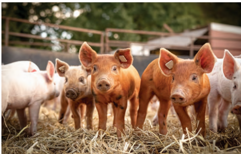
Rolnicy zajmujący się chowem lub hodowlą nie mniej niż 50 sztuk świń i chcący zrealizować inwestycje chroniące ich gospodarstwa przed rozprzestrzenieniem się wirusa ASF, mogą składać wnioski o wsparcie do 17 czerwca br.

o pomoc, która realizowana jest w ramach działania Modernizacja gospodarstw rolnych , może wystąpić rolnik posiadający gospodarstwo o powierzchni co najmniej 1 ha i nie większe niż 300 ha, prowadzący działalność zarobkową w ramach produkcji zwierzęcej lub roślinnej, o czym ma świadczyć wykazany przychód w wysokości co najmniej 5 tys. zł, odnotowany w okresie 12 miesięcy poprzedzających miesiąc złożenia wniosku. Konieczna jest także obecność w krajowym systemie ewidencji producentów, ewidencji gospodarstw rol-