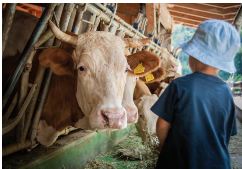
Jednym z rozwiązań zaproponowanych w przepisach Tarczy antykryzysowej, jest możliwość otrzymania zasiłku opiekuńczego z powodu konieczności osobistego sprawowania opieki nad dzieckiem w przypadku zamknięcia żłobka, klubu dziecięcego, przedszkola, szkoły