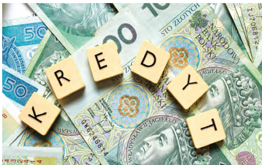
Niewypłacalni producenci rolni mogą ubiegać się m.in. o bankowe kredyty restrukturyzacyjne z dopłatami do oprocentowania ze środków ARiMR

Pożyczka na spłatę zadłużenia udzielana będzie przez Agencję Restrukturyzacji i Modernizacji