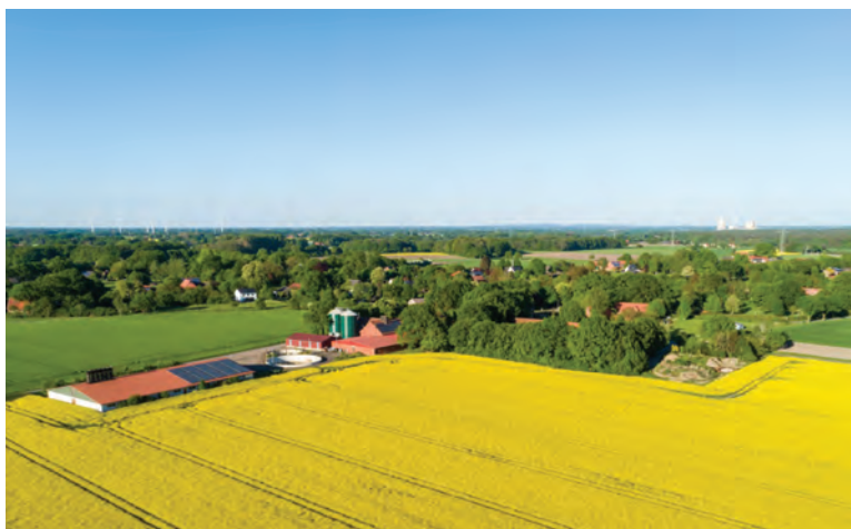
Rady gmin mogą wprowadzić za część roku 2020 zwolnienia z podatku od nieruchomości gruntów, budynków i budowli związanych z prowadzeniem działalności gospodarczej dla wskazanych grup przedsiębiorców

Rady gmin otrzymały możliwość wprowadzenia za część 2020 r. zwolnienia z podatku od nieruchomości gruntów, budynków i budowli związanych z prowadzeniem działalności gospodarczej, dla wskazanych grup przedsiębiorców, których płynność finansowa uległa pogorszeniu w związku z ponoszeniem negatywnych konsekwencji ekonomicznych z powodu COVID-19.