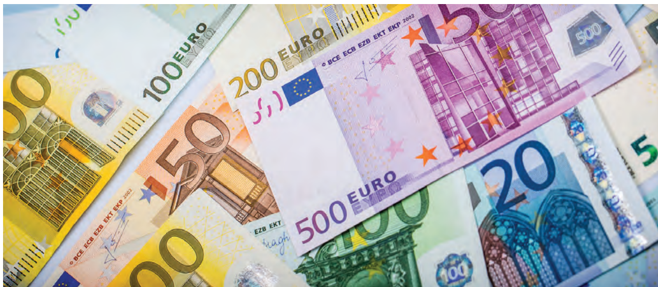
Wartość Funduszu Gwarancji Rolnych (FGR) wynosi 50 mln euro. Gwarancje z FGR obejmują rolników i przetwórców