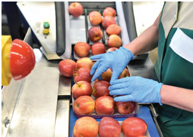
Rozwiązania dotyczące uelastyczenia czasu pracy obejmą również pracodawców będących przedsiębiorcami prowadzącymi działalność w sektorze rolno-spożywczym związaną z wytwarzaniem lub dostarczaniem żywności

korzystanie skrzynki podawczej podmiotów wdrażających (składanie wniosków do LGD za pośrednictwem podmiotu wdrażającego);