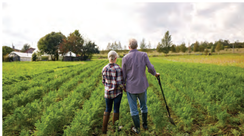
Osoby objęte ubezpieczeniem emerytalno-rentowym w KRUS zostały zwolnione z opłacania składek na to ubezpieczenie za drugi kwartał 2020 r.

Zwolnienie z opłacania składek na ubezpieczenie emerytalno-rentowe za drugi kwartał 2020 r. dotyczy rolników i domowników podlegających ubezpieczeniu emerytalno-rentowemu, w tym podlegających temu ubezpieczeniu na wniosek i tych za których składka ta jest należna w podwójnej wysokości w związku z prowadzeniem pozarolniczej działalności gospodar-