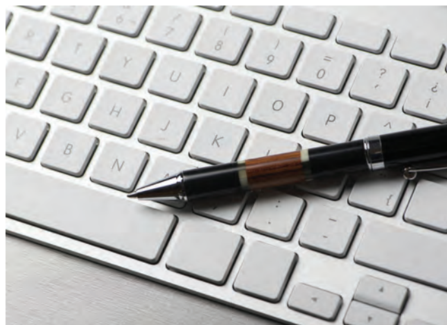
Do czasu odwołania stanu epidemii można ubiegać się o odroczenie terminu spłaty zadłużenia wobec ARiMR

Gdy rolnik nie ma możliwości przekazania wniosku drogą elektroniczną, może go również dostarczyć do wrzutni, które znajdują się w placówkach terenowych Agencji.