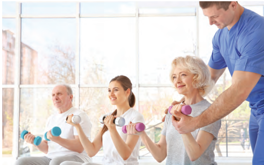
Od 15 marca 2020 r. do odwołania Kasa Rolniczego Ubezpieczenia Społecznego wstrzymała wyjazdy do Centrów Rehabilitacji Rolników KRUS. Skierowania będzie można zrealizować w późniejszym terminie

zmieniającej pod warunkiem, że: • wniosek o ustalenie prawa do świadczenia na dalszy okres został złożony przed upływem terminu ważności orzeczenia, • nowe orzeczenie w sprawie nie zostało wydane.