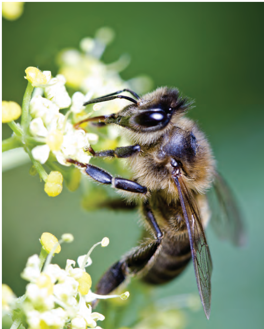
Dla ochrony zapylaczy istotne znaczenie ma przede wszystkim przestrzeganie przez stosujących środki ochrony roślin zasad dobrej praktyki ochrony roślin oraz integrowanej ochrony roślin

Jak wskazują materiały zamieszczone na Platformie Sygnalizacji Agrofagów, dla ochrony zapylaczy istotne znaczenie ma przede wszystkim przestrzeganie przez stosujących środki ochrony roślin zasad dobrej praktyki ochrony roślin oraz integrowanej ochrony roślin, określonych w rozporządzeniu Ministra Rolnictwa i Rozwoju Wsi z 18 kwietnia 2013 r. w sprawie wymagań integrowanej ochrony roślin (Dz. U. poz. 505). Jednym z tych wymagań jest ochrona organizmów pożytecznych oraz stwarzanie warunków sprzyjających ich występowaniu, co w szczególności dotyczy owadów zapylających i naturalnych wrogów organizmów szkodliwych. Decyzje o wykonaniu zabiegów ochrony roślin powinny być podejmowane w oparciu o monitoring występowania organizmów szkodliwych, z uwzględnieniem progów szkodliwości. Natomiast dokonując wyboru środków ochrony roślin należy brać pod uwagę ich selektywność. Ponadto, stosowanie środków ochrony roślin powinno być ograniczone do niezbędnego minimum, w szczególności poprzez odpowiedni dobór dawki lub ograniczenie liczby wykonywanych zabiegów.