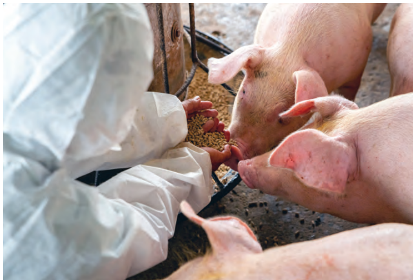
Zawarte w rozporządzeniu przepisy ułatwią funkcjonowanie rolnikom i przedsiębiorcom rolnym w sytuacji kryzysu wywołanego pandemią

Uruchomienie większej liczby rzeźni rolniczych o małej zdolności produkcyjnej zwiększy konkurencyjność tych rzeźni w wyniku obniżenia kosz-