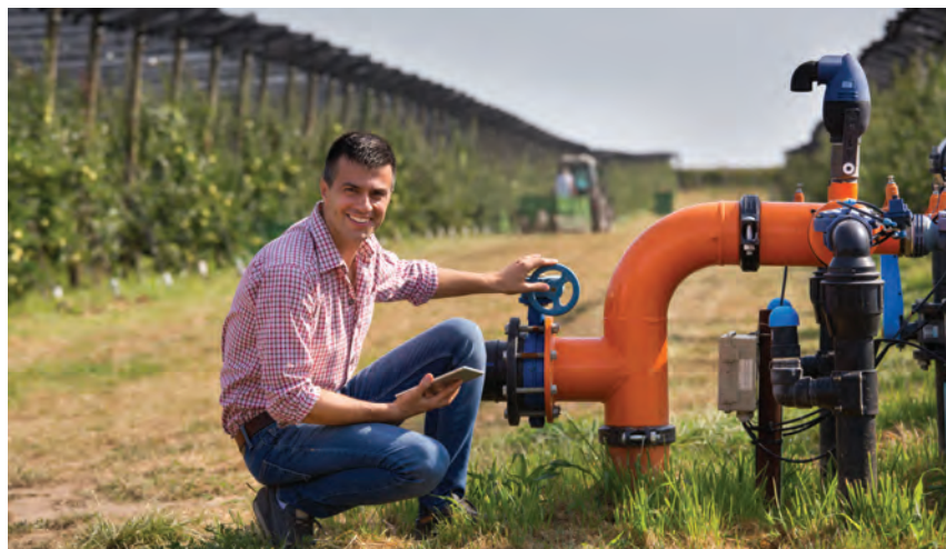
Dofinansowaniem mogą zostać również objęte inwestycje w nawadnianie gospodarstwa. Rolnicy, którzy chcą ubiegać się w ARiMR o dotację na ten cel mają czas na złożenie wniosku do 20 lipca br.

nocześnie powiększające obszar nawadniania oraz ulepszające już istniejące instalacje. Wsparcie finansowe na jednego beneficjenta