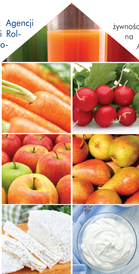
Dzięki ARiMR dostawy żywności realizowane w ramach „Programu dla szkół” trafiły do organizacji charytatywnych, szpitali, policji, wojska

W związku z panującą w Polsce epidemią szkoły i placówki oświatowe zostały zamknięte, a dostawy żywności realizowane w ramach „Programu dla szkół” wstrzymane. Dostawcy mieli w swoich magazynach nadwyżki