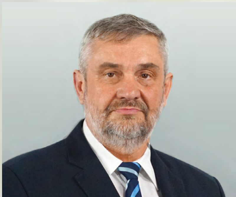
Jan Krzysztof Ardanowski, minister rolnictwa i rozwoju wsi