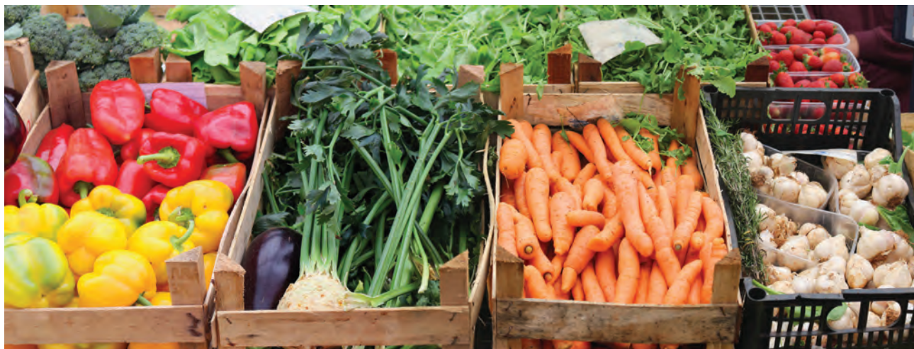
Targowiska i bazy są specyficznymi miejscami obrotu żywnością. W celu zapobiegania zagrożeniu, jakim jest ryzyko zakażenia COVID-19 w tych miejscach handlu, rekomenduje się ich zarządcom stosowanie w rygorystyczny sposób wymagań higienicznych

duktów o krótkim terminie przydatności do spożycia, które powinny być przechowywane w lodówce;