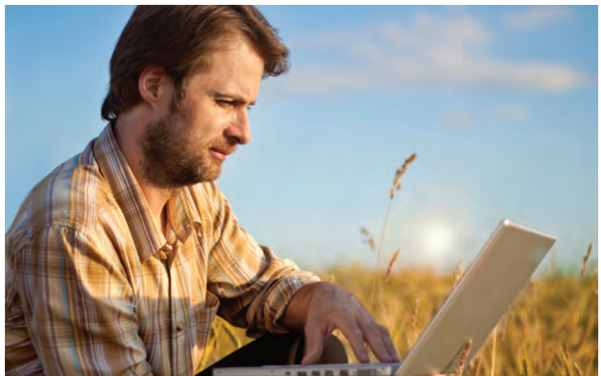
Rolnicy uprawnieni do złożenia oświadczenia mogą zalogować się do aplikacji eWnioskiPlus i złożyć wniosek przez internet