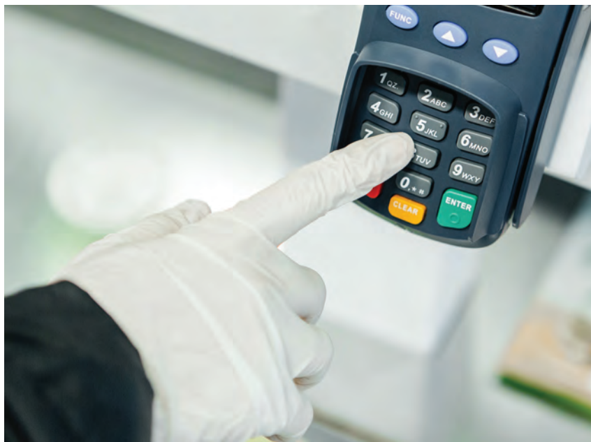
W placówkach handlowych należy korzystać głównie z płatności bezgotówkowych

W przypadku, gdy powyższe wymagania nie mogą być przestrzegane, zarządca targowiska powinien podjąć decyzję, w trosce o dobro i bezpieczeństwo konsumentów, o ograniczeniu działania części lub całości targowiska/bazaru.