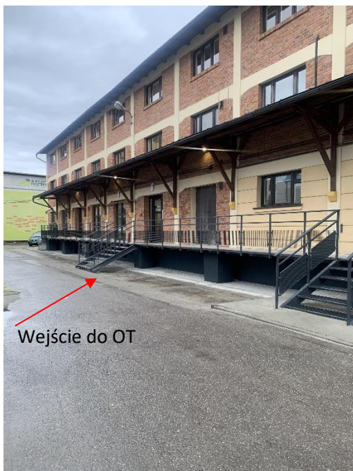
Wejście do OT

Siedziba OT znajduje się przy drugim wejściu do budynku zlokalizowanym przy ul. Zbożowej 4. Mieści się ona na parterze, I oraz II piętrze, przy czym Punkt Obsługi Klienta znajduje się na parterze, zaraz po lewej stronie do wejścia do budynku.