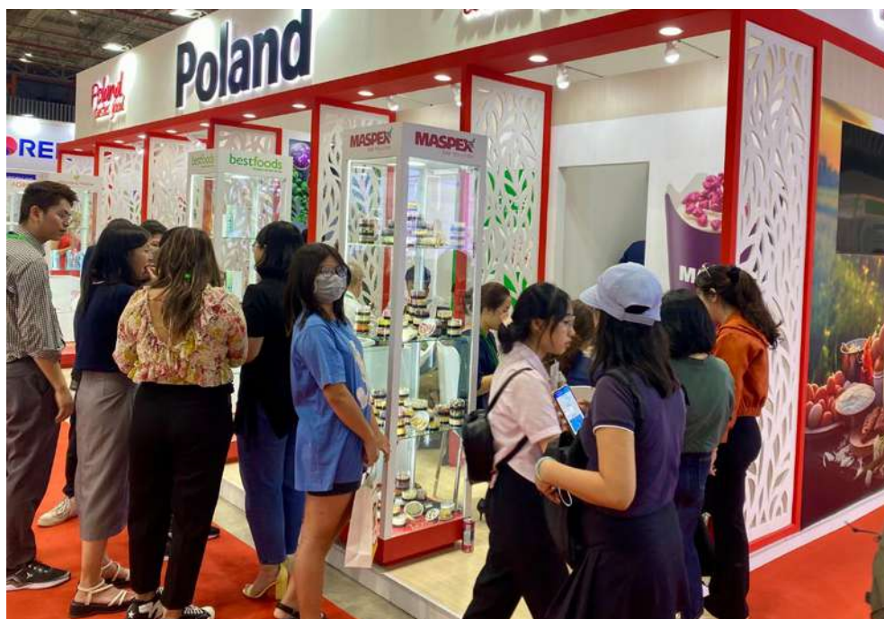
Polskie stoisko na Targach Vietfood & Beverage 2024 cieszyło się dużą popularnością wśród odwiedzających, a polscy przedsiębiorcy przeprowadzili wiele rozmów z potencjalnymi partnerami biznesowymi

USA to również największy rynek konsumencki na świecie, bogaty w kapitał, zróżnicowany pod względem etnicznym i otwarty na nowe produkty. Szansę dla polskich producentów stanowi m.in. rosnące zainteresowanie rybami i przetworami rybnymi, czekoladą i wyrobami czekoladowymi, ziarnem pszenicy, pieczywem i wyrobami piekarniczymi oraz sokami owocowymi i warzywnymi.