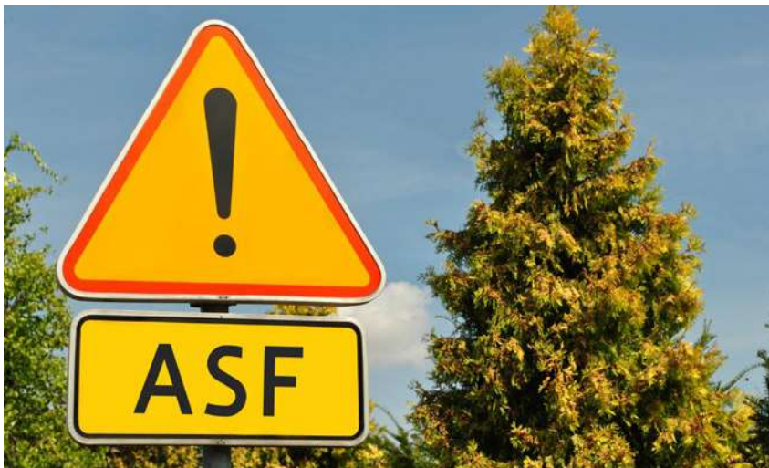
Na obszarach objętych ograniczeniami w gospodarstwach utrzymujących świnie konieczne jest stosowanie dodatkowych zabezpieczeń