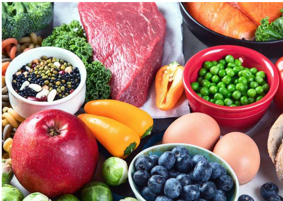
Polska jest 4. największym producentem żywności w Europie

Święto zostało ustanowione z inicjatywy Ogólnopolskiego Programu Promocyjnego „Docenić polskie” w 2013 r.