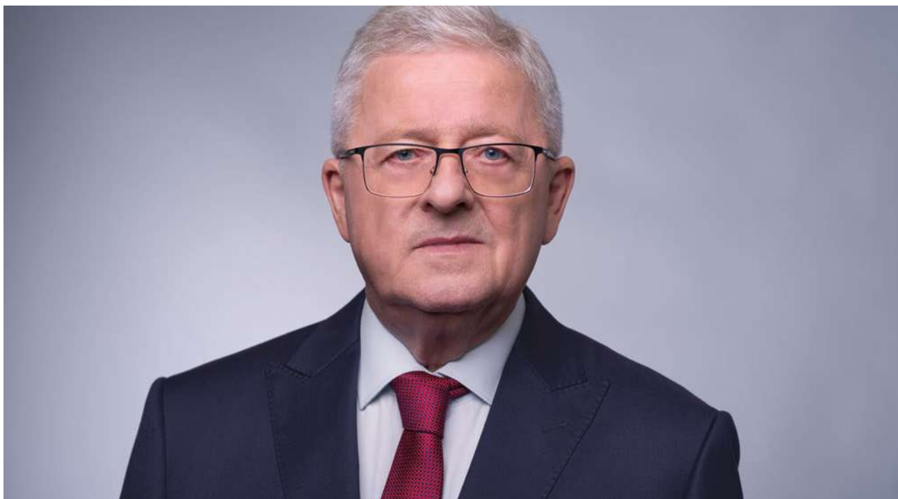
CZESŁAW SIEKIERSKI, minister rolnictwa i rozwoju wsi