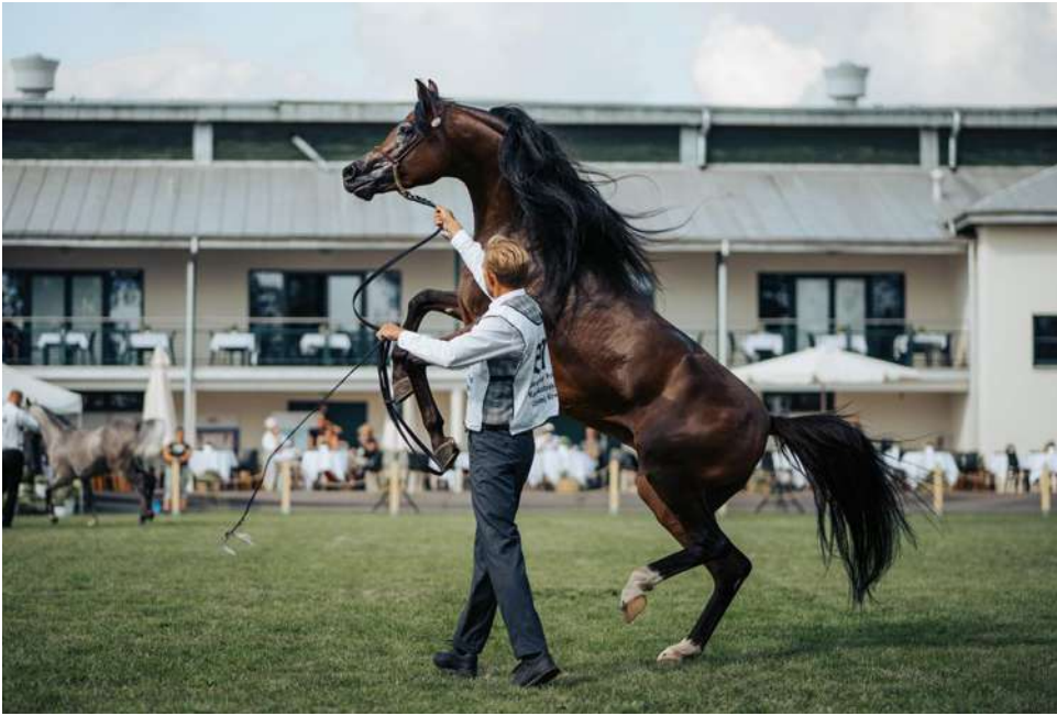
46. Narodowy Pokaz Koni Arabskich Czystej Krwi