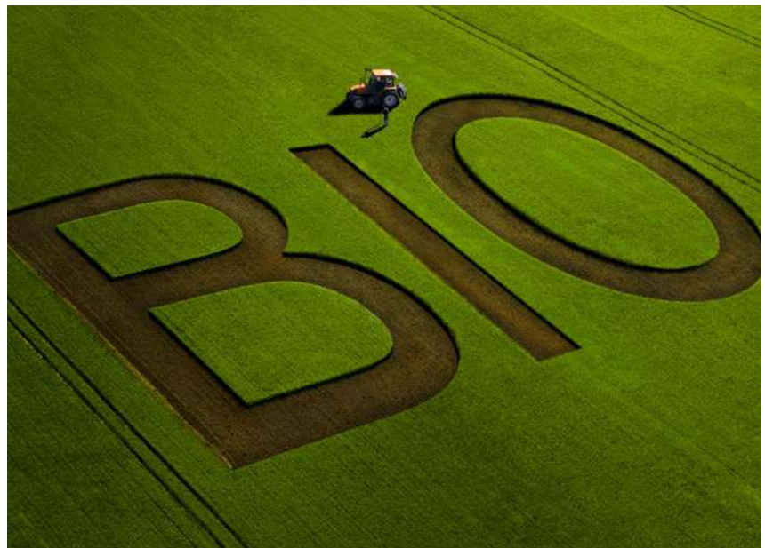
W strukturze ekologicznych użytków rolnych zboża stanowią większość upraw

rolnej, wspierając jednocześnie bioróżnorodność. Zapoznając się ze strategią „Od pola do stołu”, ma się wrażenie, że zdecydowana większość postawionych w niej celów i działań tak naprawdę może być realizowana właśnie poprzez rozwój produkcji ekologicznej. Dlatego też w nowym Planie Strategicznym dla Wspólnej Polityki Rolnej (PS WPR) producenci ekologiczni znajdują m.in. wsparcie zarówno dotyczące gruntów, na których prowadzą pro-