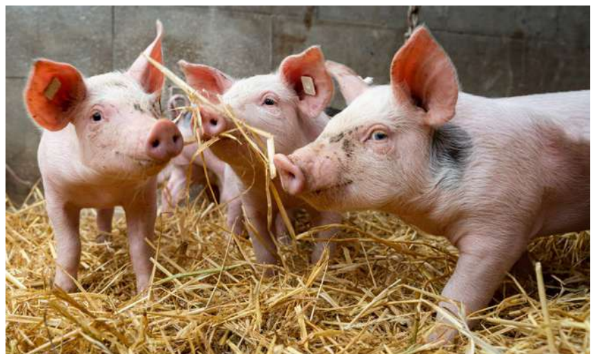
Prowadzenie działalności związanej z chowem i hodowlą świń wiąże się z koniecznością przestrzegania zasad bioasekuracji gospodarstw