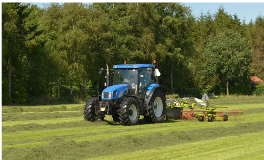
Wsparcie można przeznaczyć m.in. na zakup nowych maszyn i urządzeń do produkcji rolnej

Wsparcie finansowe przeznaczyć można na inwestycje budowlane, wyposażenie budynków lub budowli, zakup nowych maszyn, urządzeń i sprzętu, w tym sprzętu komputerowego oraz zakup wartości niematerialnych i prawnych służących do prowadzenia produkcji rolnej, w tym ekologicznej, i przygotowania do sprzedaży