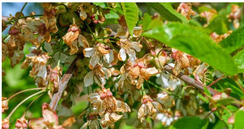
Wiosenne przymrozki i gradobicia spowodowały ogromne straty w uprawach sadowniczych i winorośli