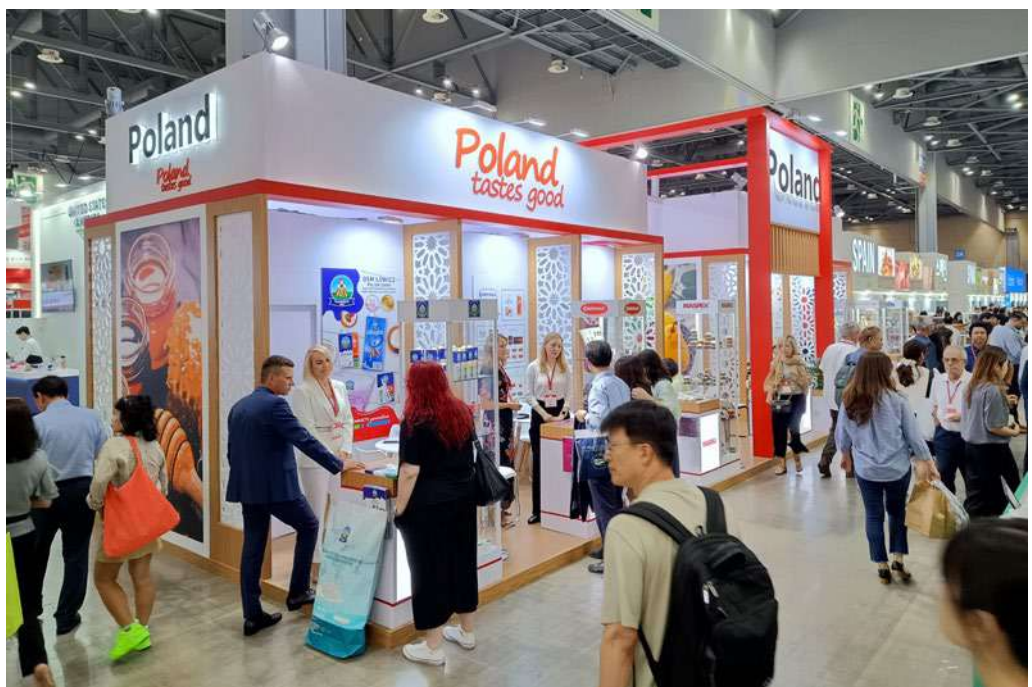
Polskie stoisko narodowe pod hasłem „Poland tastes good” na targach spożywczych Seoul Food & Hotel 2024

Od 23 do 25 kwietnia 2024 r. w Barcelonie odbywały się największe na świecie targi ryb i owoców morza – Seafood Expo Global. Jest to wyjątkowe wydarzenie wśród imprez branżowych. Cechuje je duże zróż-