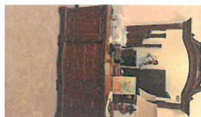
55 QR (809-1-1b)