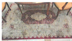
90 QR 2.3x1.6 m (008-391)