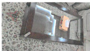
60 QR (008-378)