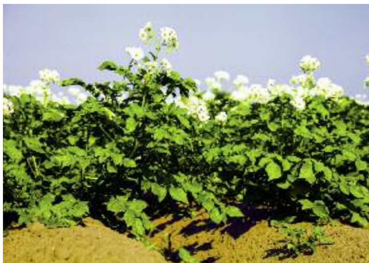
W br. realizowany jest mechanizm udzielania dopłat do powierzchni, obsianej lub obsadzonej materiałem siewnym kategorii elitarny lub kwalifikowany roślin zbożowych, roślin strączkowych oraz ziemniaka

W 2016 r. w zmienionej formie realizowany jest mechanizm udzielania dopłat do powierzchni, obsianej lub obsadzonej materiałem siewnym kategorii elitarny lub kwalifikowany roślin zbożowych, roślin strączko-