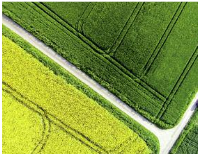
Pomoc udzielana w ramach programu scalania gruntów służy poprawie struktury przestrzennej gospodarstw rolnych