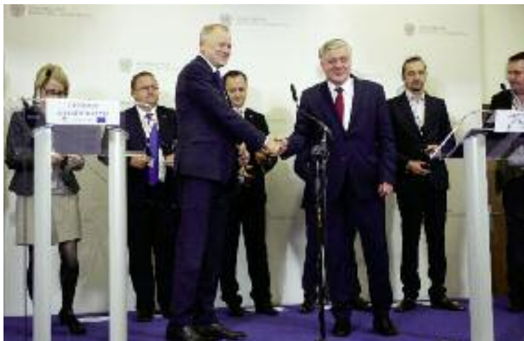
Spotkanie Ministrów Rolnictwa oraz Głównych Lekarzy Weterynarii 12 krajów z Komisarzem UE do spraw zdrowia i bezpieczeństwa żywności

Jest on związany ze skutkami rynkowymi stosowania restrykcji weterynaryjnych z uwagi na ASF. Polska podejmuje działania mające na celu zahamowanie rozprzestrzeniania się wirusa, co nie jest łatwe m.in. w związku z bliskością Białorusi i Ukrainy, gdzie jest on szeroko rozpowszechniony. Dlatego też wnioskowano o wykorzystanie wszystkich możliwych form wsparcia z budżetu UE rozwoju obszarów wiejskich i weterynaryjnych, celem ograniczenia skutków zaistniałej sytuacji. Wsparcie obejmowałoby m. in.: rekompensowanie