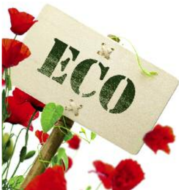
Resort rolnictwa bierze udział w licznych działaniach promujących system rolnictwa ekologicznego

ki rezerwy celowej w wysokości 260 mln na wsparcie budżetów wojewodów w realizacji najpilniejszych zadań z zakresu utrzymania urządzeń melioracji wodnych podstawowych i wód istotnych dla regulacji stosunków wodnych na potrzeby rolnictwa, a także na zwiększenie dotacji podmiotowej na dofinansowanie spółek wod-