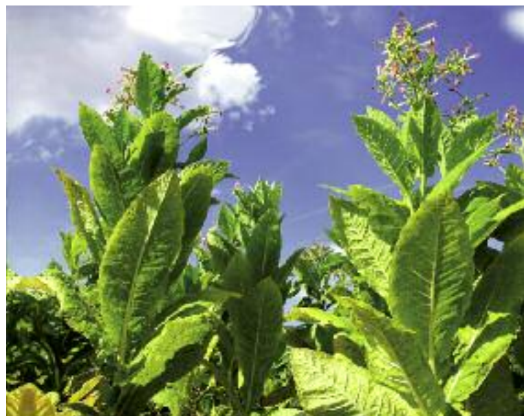
Obowiązki związane z monitorowaniem i nadzorem nad uprawą tytoniu oraz produkcją i zbytem surowca tytoniowego mają zostać powierzone ARR

W celu wdrożenia nowych rozwiązań opracowano projekt ustawy o zmianie ustawy o płatnościach w ramach systemu wsparcia bezpośredniego, który obecnie jest przedmiotem prac parlamentarnych.