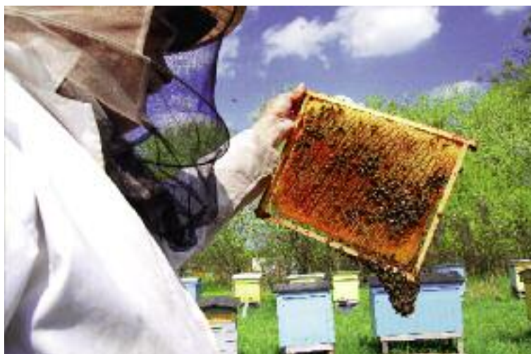
W ścisłej współpracy z pszczelarzami został opracowany „Krajowy Program Wsparcia Pszczelarstwa”. Jest on realizowany przez ARR

Zatwierdzony przez KE program jest aktualnie realizowany przez ARR. W ramach ww. programu pomoc jest kierowana do pszczelarzy, a jego budżet to blisko 17,8 mln euro. Pomoc polega na refundacji kosztów: przeprowadzania szkoleń i zakupu sprzętu pszczelarskiego, urządzeń do prowadzenia gospodarki wędrowniej, matek, odkadłód pszczelich oraz wykonywania analiz ja-