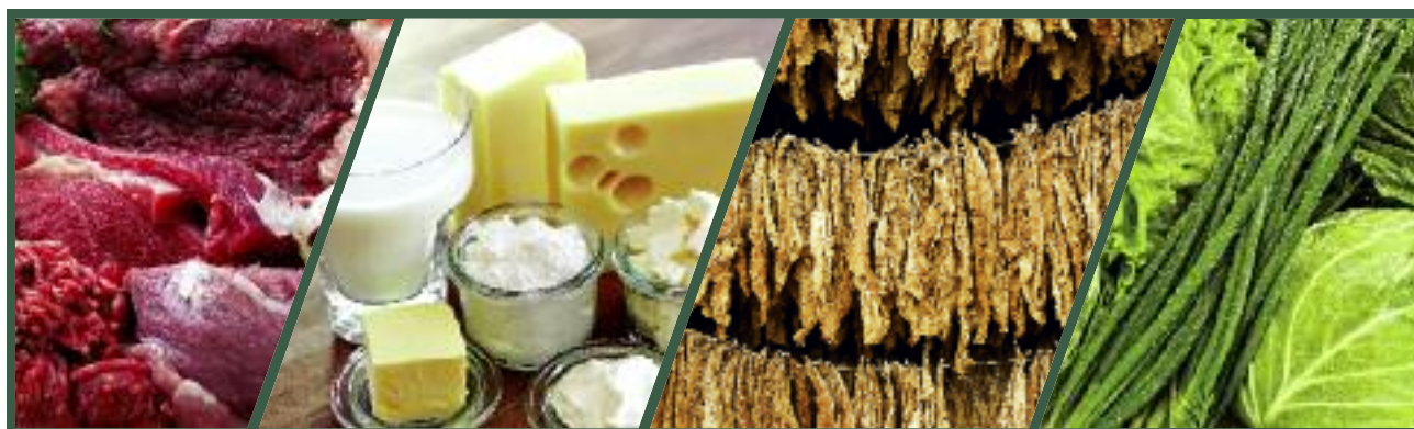
... wieprzowiny, wołowiny, drobiu, mleka i przetworów mlecznych oraz tytoniu

Formułując cele i wyzwania uwzględniono możliwości wykorzystania istniejących w kraju zasobów, ale tak-