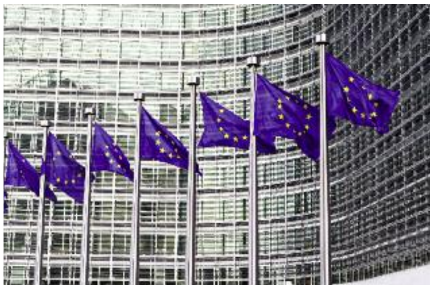
Minister Rolnictwa i Rozwoju Wsi wielokrotnie zwracał uwagę Komisji Europejskiej na konieczność uproszczenia WPR

Rozpoczęto przygotowanie dokumentacji niezbędnej do złożenia wniosku o dopuszczenie do obrotu innych owoców i warzyw na rynki: Tajwanu, Turcji, Meksyku, Argentyny, Wenezueli i Chin.