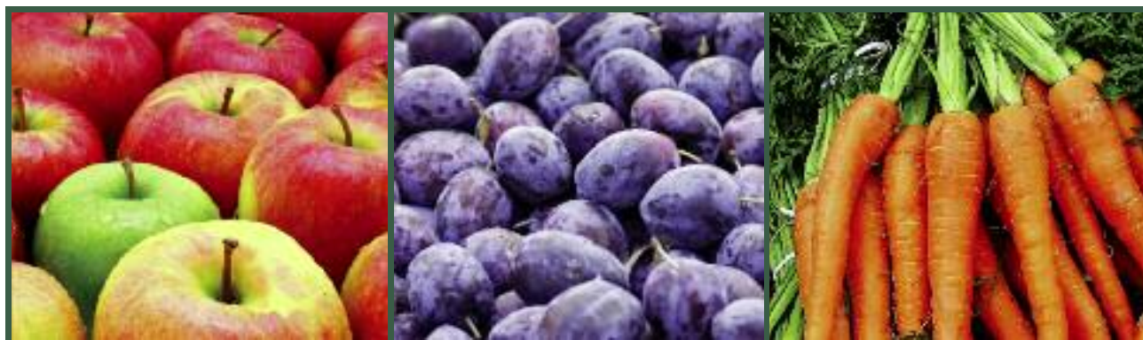
W 2016 r. ARR wypłaciła 573,6 mln zł do 313,1 tys. ton owoców i warzyw w ramach realizacji czwartej transzy tymczasowej pomocy na rynku owoców i warzyw

Ponadto, ARR w 2016 r. wypłaciła 573,6 mln zł do 313,1 tys. ton owoców i warzyw (głównie jabłek)