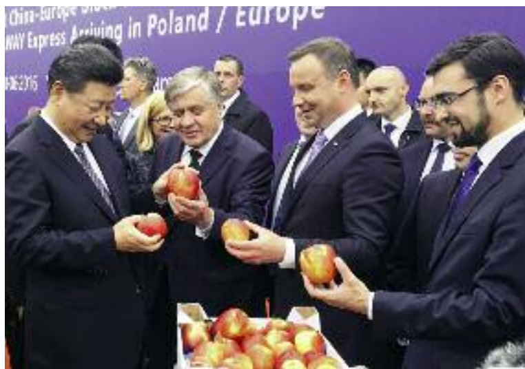
W połowie br. został podpisany protokół otwierający rynek chiński dla naszych jabłek. Na zdjęciu: prezydent Andrzej Duda, minister Krzysztof Jurgiel i prezes ARR Łukasz Hołubowski częstując przewodniczącego ChRL Xi Jinpinga polskimi jabłkami

Do właściwych służb Indonezji przekazano wniosek aplikacyjny w sprawie uznania systemu nadzoru nad bezpieczeństwem żywności w Polsce. Ma to umożliwić eksport jabłek i borówek do Indonezji. Złożony został także wniosek do USA o umożliwienie wysyłki polskich sadzonek truskawki.