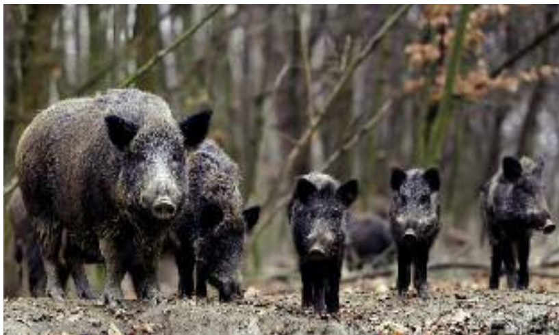
Na terenie całego kraju prowadzony jest stały monitoring w kierunku ASF. Do końca listopada br. odnotowano 145 przypadków tej choroby u dzików oraz 23 ogniska u świń

Grupa Zadaniowa ds. łagodzenia skutków związanych z wystąpieniem przypadków afrykańskiego pomoru świń (GZ ds. ASF) powstała zgodnie z decyzją Ministra Rolnictwa i Rozwoju Wsi z dnia 13 czerwca 2014 r. Zakres zadaniowy GZ obejmuje m.in.: