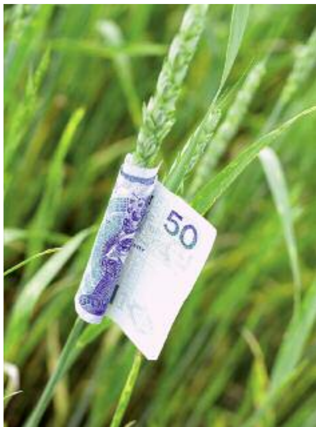
Zaliczki na poczet płatności bezpośrednich za 2016 r. wypłacane są w maksymalnej, dopuszczalnej przepisami unijnymi wysokości 70%

na poczet płatności bezpośrednich za 2016 r. w maksymalnej dopuszczalnej przepisami unijnymi wysokości, tj. 70%. Są one wypłacane od 17.10 br., dla wszystkich rodzajów płatności bezpośrednich realizowanych w Polsce. Wypłatą zaliczkowych płatności objęci zostali rolnicy na terenie całego kraju. Jeszcze przed 1 grudnia br. wszyscy rolnicy ubiegający się o płatności bezpośrednie za 2016 r. (ok. 1,35 mln) otrzymali ponad 10 mld zł w ramach tego wsparcia. W celu realizacji zaliczek zostały przygotowane i opublikowane odpowiednie akty prawne.