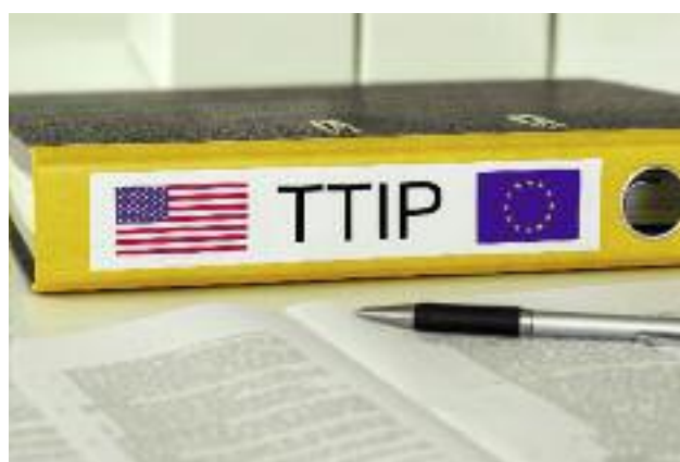
MRiRW brało udział w wypracowaniu stanowiska Polski na negocjacje w ramach WTO oraz kolejne rundy negocjacji Umowy TTIP z USA

stanowiska w negocjacjach TTIP resort dąży do wyłączenia z pełnej liberalizacji produktów wrażliwych, ochrony unijnych standardów jakości i bezpieczeństwa żywności, uwzględnienia różnic w wymogach, a tym samym kosztach produkcji, między rolnictwem UE i USA.