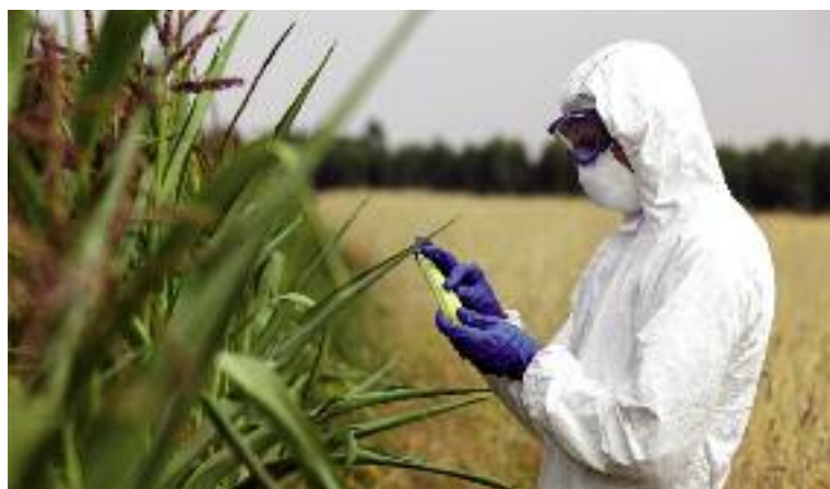
W marcu br. KE wyraziła zgodę na wyłączenie całego terytorium Polski spod upraw kukurydzy MON

jest zakazany do stosowania w Polsce. Dzięki nowelizacji doprowadzono do zgodności i uaktualnienia przed sezonem siewnym 2016 krajowego wykazu z wykazem odmian MON 810, jakie znajdują się w wspólnym katalogu.