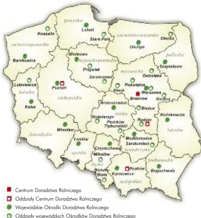
Jednostki Doradztwa Rolniczego