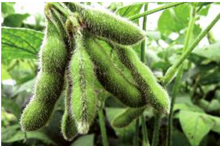
Od 2017 r. obowiązywały będą nowe zasady przyznawania pomocy do roślin wysokobiałkowych. Na wsparcie w tym sektorze roślin przeznaczono kwotę w wysokości ponad 68 mln euro

Zgodnie z trwającymi pracami nad nowelizacją ustawy o Agencji Rynku Rolnego i organizacji niektórych rynków rolnych, w celu uszczelnienia obrotu surowcem tytoniowym planowane jest powierzenie ARR obowiązków związanych z monitorowaniem i nadzorem nad uprawą tytoniu oraz produkcją i zbytem