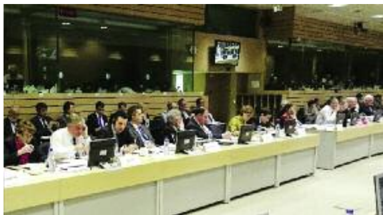
Posiedzenie unijnej Rady Ministrów ds. Rolnictwa i Rybołówstwa z udziałem ministra Krzysztofa Jurgiewicza

W trakcie roku prac w Radzie UE, Minister Rolnictwa i Rozwoju Wsi poruszał szereg istotnych dla polskiego i unijnego rolnictwa tematów, w tym zgłaszał stanowiska Polski w zakresie prezentowanych przez KE dokumentów, przekazywał własne propozycje do uwzględnienia w pracach Rady, aktualnej Prezydencji bądź KE. Należy mieć na uwadze, że część efektów prac Ministra