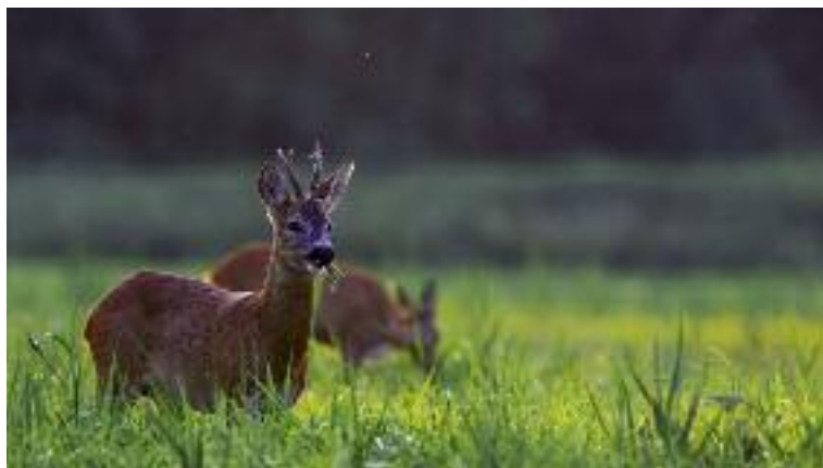
Minister Rolnictwa i Rozwoju Wsi jest zwolennikiem wprowadzenia zmian w „ Prawie łowieckim ” w zakresie szacowania szkód łowieckich i wypłaty odszkodowań za te szkody

Minister Rolnictwa i Rozwoju Wsi jest zwolennikiem wprowadzenia, postulowanych od wielu lat przez rolników, zmian w Prawie łowieckim w zakresie szacowania szkód łowieckich i wypłaty odszkodowań za te szkody. Wyrazem powyższego było poparcie Ministra oraz jego