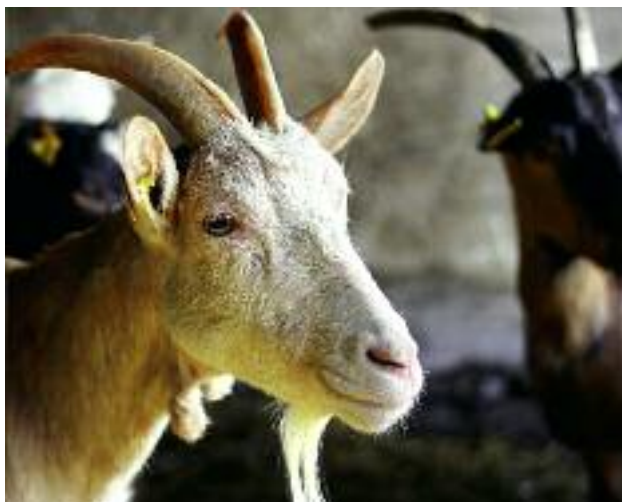
Dotacje przedmiotowe na postęp biologiczny w produkcji zwierzęcej umożliwiają zapewnienie warunków do poprawy jakości genetycznej zwierząt gospodarskich i ochrony ich bioróżnorodności genetycznej

Dotacje przedmiotowe ze środków budżetowych na postęp biologiczny w produkcji zwierzęcej są jedną z form pomocy stosowanej w rolnictwie, której celem jest systematyczne wspieranie hodowli zwierząt gospodarskich. Dotacje te umożliwiają zapewnienie warunków do poprawy jakości genetycznej zwierząt gospodarskich i ochrony ich bioróżnorodności genetycznej, poprawiania skuteczności i profesjonalizmu w rolnictwie.