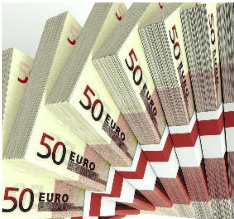
Budżet PROW 2014-2020 wynosi przeszło 13,5 mld euro

W ramach PROW 2014-2020 realizowanych jest 15 działań i 30 poddziałań, w tym 42 typy operacji, których celem jest wspieranie rozwoju sektora rolno-spożywczego i obszarów wiejskich. Łączne środki publiczne prze-