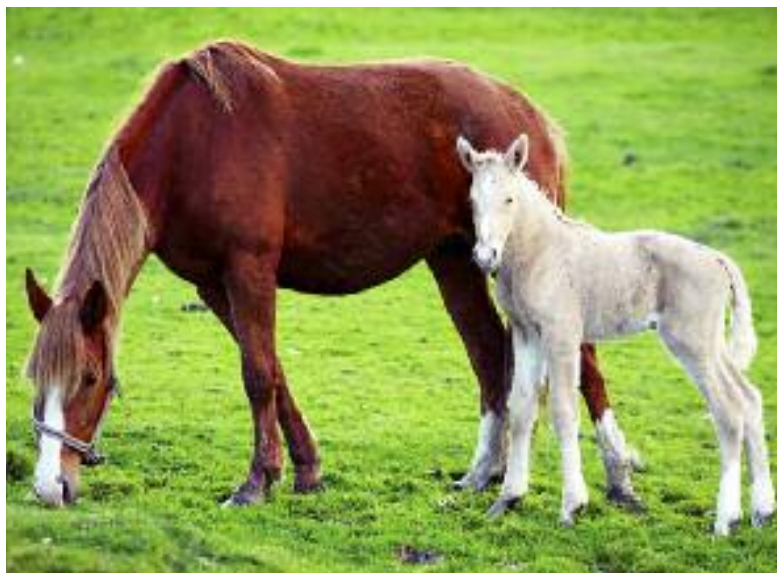
Głównym zadaniem powołanej w kwietniu br. Rady do spraw Hodowli Koni jest poprawa konkurencyjności w tym sektorze

rozwoju hodowli oraz przygotowanie strategii hodowli koni w Polsce, dostosowanej do potrzeb rolnictwa, rekreacji, jeździectwa oraz wyścigów konnych. Ponadto