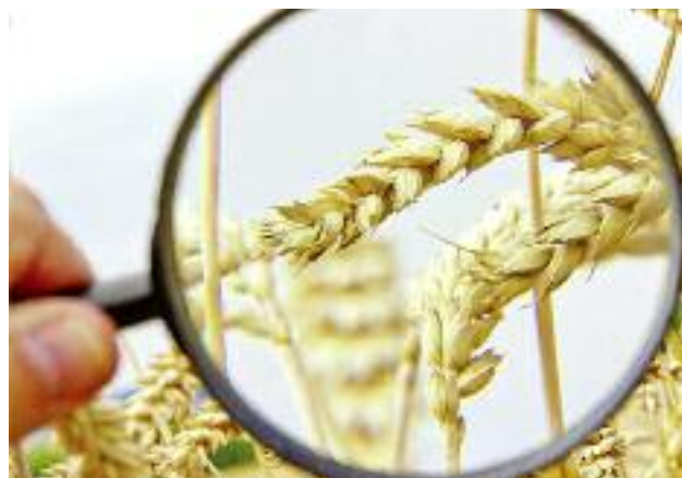
Wzmocniona została kontrola monitoringowa zbóż importowanych z Ukrainy, w związku z napływającymi do MRiRW informacjami na temat ich niewłaściwego stanu fitosanitarnego

W celu zbudowania trwałego zaufania konsumentów do systemu rolnictwa ekologicznego, a w konsekwencji zapewnienia stabilnego popytu na produkty certyfikowane w ramach tego systemu, niezbędne jest stałe podnoszenie jakości kontroli i nadzoru nad produkcją ekologiczną. Konsument uzyskuje dzięki temu pewność, iż trafiające na rynek produkty oznakowane logo rolnictwa ekologicznego spełniają wysokie wymagania dotyczące ich jakości i warunków produkcji. Równoległe eliminowane są przypadki nieprawidłowości, które wpływają negatywnie na decyzje konsumentów.