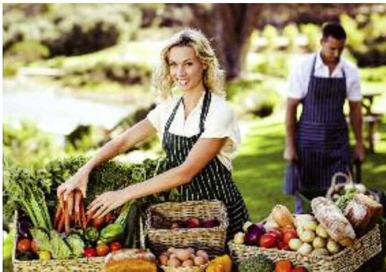
Podjęte zostały prace legislacyjne nad ustawą stwarzającą polskim rolnikom korzystne warunki do rozwoju produkcji i sprzedaży detalicznej, żywności wyprodukowanej w całości lub w części z ich własnej uprawy, chowu lub hodowli

i sprzedaży konsumentom finalnym żywności wyprodukowanej w całości lub w części z własnej uprawy, chowu lub hodowli poprzez uregulowanie kwestii prowadzenia rolniczego handlu detalicznego z punktu widzenia bezpieczeństwa żywności i kwestii podatkowych. W tym celu opracowano projekt ustawy o zmianie niektórych ustaw w celu ułatwienia sprzedaży żywności przez rolników.