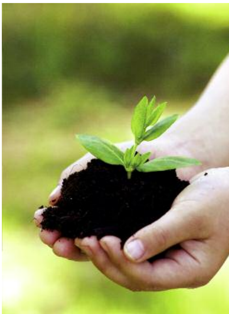
Przedstawianie propozycji rozwiązań systemowych w rolnictwie ekologicznym oraz wspieranie przedsięwzięć służących rozwojowi tego systemu gospodarowania należy do priorytetowych zadań Rady do Spraw Rolnictwa Ekologicznego

W rozdziale pierwszym zawarto analizę poszczególnych sektorów, w tym dane na temat ich struktury, poziomu produkcji, handlu zagranicznego, rysując tym samym obraz uwarunkowań rozwoju poszczególnych