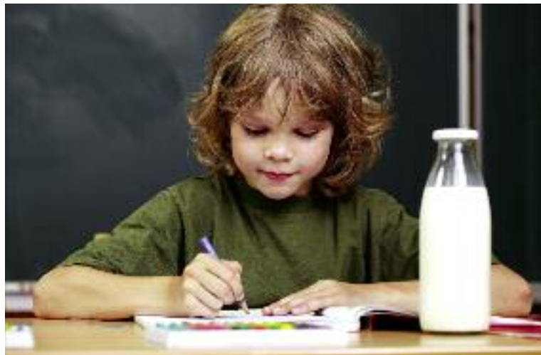
W roku szkolnym 2015/2016 z programu „Mleko w szkole” administrowanego przez ARR skorzystało 2,64 mln dzieci

jęła 4,3 tys. ton masła i 2,4 tys. ton OMP. W 2016 r. za zakup, transport i przechowywanie OMP ARR wypłaciła beneficjentom 233,1 mln zł, z tytułu rozliczania dopłat do prywatnego przechowywania masła i OMP – 0,7 mln zł).