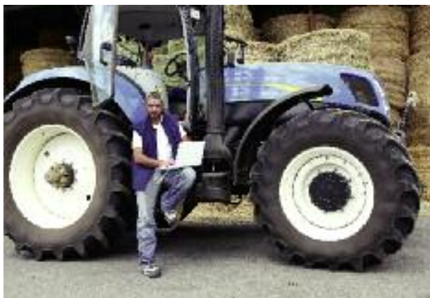
W pierwszej połowie roku ARIMR przyjmowała wnioski o przyznanie wsparcia na cztery rodzaje inwestycji w ramach działania „Modernizacja gospodarstw rolnych”

Realizacja działania związana była ze zmianami legi-