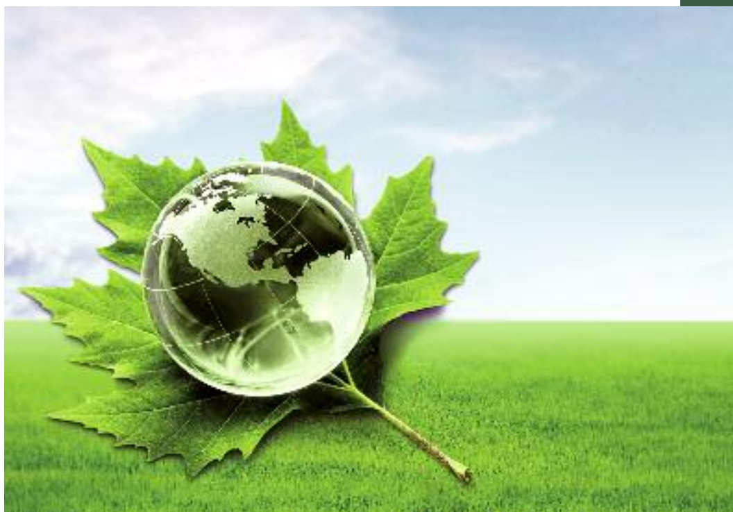
MRiRW brało aktywny udział w dyskusji nad sposobem implementacji Pakietu energetyczno-klimatycznego UE

Działania podejmowane w tym zakresie przez Ministra Rolnictwa zostały ujęte szczegółowo w innych częściach sprawozdania. Wśród najważniejszych i obejmujących najszerszą grupę spraw ważnych dla polskiego i unijnego rolnictwa, jest praca nad komunikatem Parlamentu Europejskiego i Rady „Śródroczowy