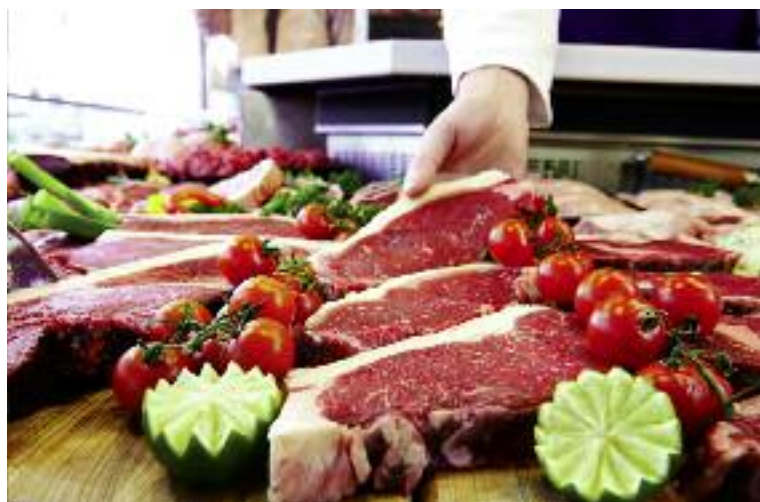
1 czerwca 2017 r. wejść w życie przepisy dot. obowiązku podawania kraju pochodzenia dla mięsa bez opakowań

Odpowiednie przepisy przyjęte przez MRiRW zapewnią jednolite postępowanie jednostek certyfikujących na terenie całego kraju oraz porównywalność wyników badań wykonywanych przez poszczególne laboratoria, tak pod względem zakresu analitycznego, jak i czułości zastosowanych metod. Podjęto prace nad zmianą porządku prawnego w zakresie ograniczenia obciążeń administracyjnych oraz usprawnienie przepływu danych pomiędzy jednostkami zaangażowanymi w kontrolę w rolnictwie ekologicznym.