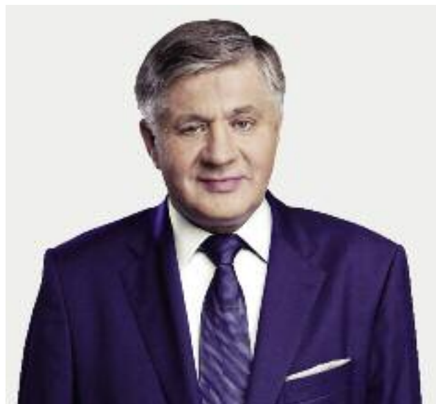
Krzysztof Jurgiel, minister rolnictwa i rozwoju wsi