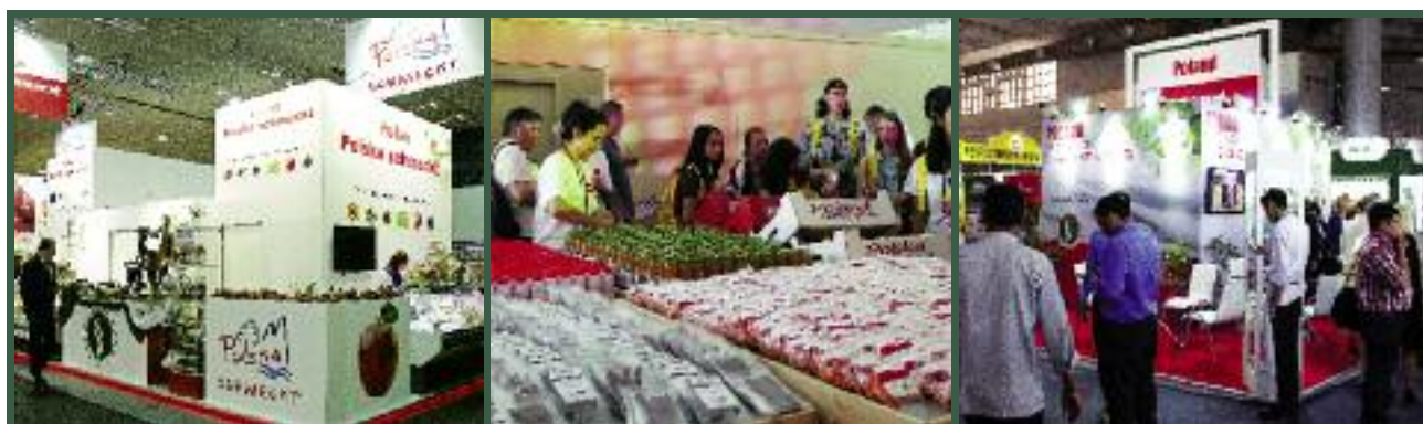
Resort rolnictwa promował produkty wysokiej jakości, w tym regionalne, tradycyjne, ekologiczne i wyróżnione znakiem PDŻ podczas zagranicznych imprez wystawienniczo-targowych oraz w czasie Światowych Dni Młodzieży

Resort rolnictwa promował krajowe produkty wysokiej jakości, w tym regionalne, tradycyjne i ekologiczne oraz wyróżnione znakiem Poznaj Dobrą Żywność podczas imprez wystawienniczo-targowych za granicą w formie organizacji stoisk informacyjno-promocyjnych na branżowych targach zagranicznych, tj.: Międzynarodowych Targach Grüne Woche w Berlinie w Niemczech, Międzynarodowych Targach Salima w Brnie w Republice Czeskiej, Międzynarodowych Targach