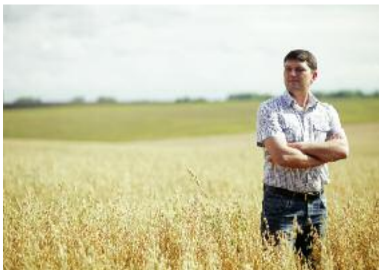
Znowelizowane w tym roku rozporządzenie ministra rolnictwa w sprawie premii dla młodych rolników złądziło wcześniej obowiązujące zasady udzielania tej pomocy

finansowe będzie realizowane w formie rocznych płatności w okresie pierwszych 5 lat od uznania grupy przez państwo członkowskie i będzie stanowiło procentowy ryczałt od wartości przychodów netto grupy producentów rolnych ze sprzedaży produktów lub grup produktów, wytworzonych przez jej członków w poszczególnych latach i sprzedanych odbiorcom niebędącym członkami grupy. Wsparcie będzie uzależnione od wartości przychodów netto grupy, odpowiednio w kolejnych latach wsparcia. Jego poziom nie może przekroczyć równowartości 100 000 EUR w każdym roku pomocy. Wypłata ostatniej raty wsparcia nastąpi po potwierdzeniu prawidłowej realizacji planu biznesowego. Udzielana pomoc finansowa ma zostać wydatkowana m.in. na dostosowanie do wymogów rynkowych procesu produkcyjnego i produktów producentów, którzy są członkami takich grup lub organizacji; wspólne wprowadzanie towarów do obrotu, centralizacji sprzedaży i dostawy do odbiorców hurtowych; ustanowienie wspólnych zasad dotyczących informacji o produkcji. Pierwszy nabór zakończył się 28.11.2016 r.