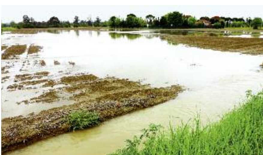
W listopadzie br. wprowadzono jednolity formularz protokołu szacowania szkód w gospodarstwach rolnych i działach specjalnych produkcji rolnej powstałych w wyniku klęsk: gradu, huraganu, deszczu nawalnego, suszy lub ujemnych skutków przezimowania

Od 02.11.2016 r. wprowadzony został jednolity formularz protokołu szacowania szkód w gospodarstwach rolnych i działach specjalnych produkcji rolnej oraz jednolite dla czterech makroregionów FADN dane stanowiące podstawę szacowania tych szkód. Przedmioto-