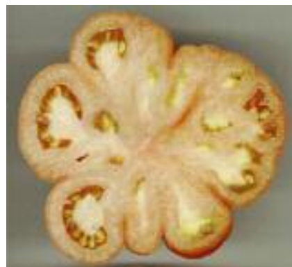
„Malinowe serce” wraca na nasze pola i stoły