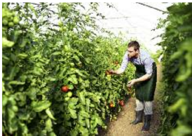
Przygotowywana w resorcie rolnictwa ustawa o spółdzielniach rolników ma na celu m.in. wzmocnienie pozycji rolnika wobec kolejnych uczestników łańcucha żywnościowego

W Polsce działania związane z funkcjonowaniem, uznawaniem i nadzorowaniem grup i organizacji producentów oraz ich zrzeszeń i związków prowadzi Agencja Rynku Rolnego. Realizuje działania związane z obsługą