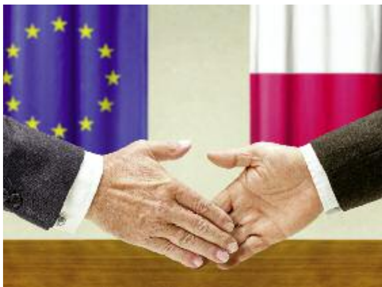
Resort rolnictwa aktywnie uczestniczy w kształtowaniu korzystnej dla Polski Wspólnej Polityki Rolnej UE

Polska postuluje wprowadzenie przepisu umożliwiającego państwom członkowskim rewizję decyzji dotyczącej mechanizmu redukcji płatności (redukcja jednolitej płatności obszarowej przekraczającej 150 tys. EUR o przynajmniej 5%). W naszej opinii umożliwienie państwom członkowskim dostosowania sposobu implementacji tego mechanizmu do zmieniających się uwa-