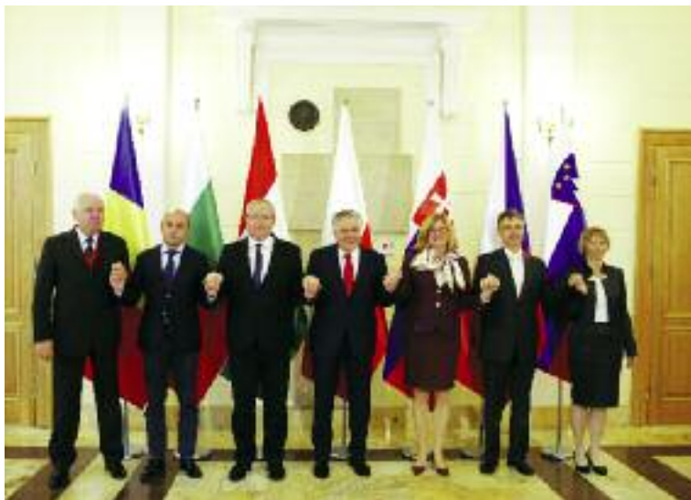
Spotkanie Ministrów Rolnictwa państw grupy Wyszehradzkiej oraz Bułgarii, Rumunii i Słowenii

dyskusję w zakresie wypracowania instrumentów w celu wzmocnienia pozycji producentów w łańcuchu żywnościowym;