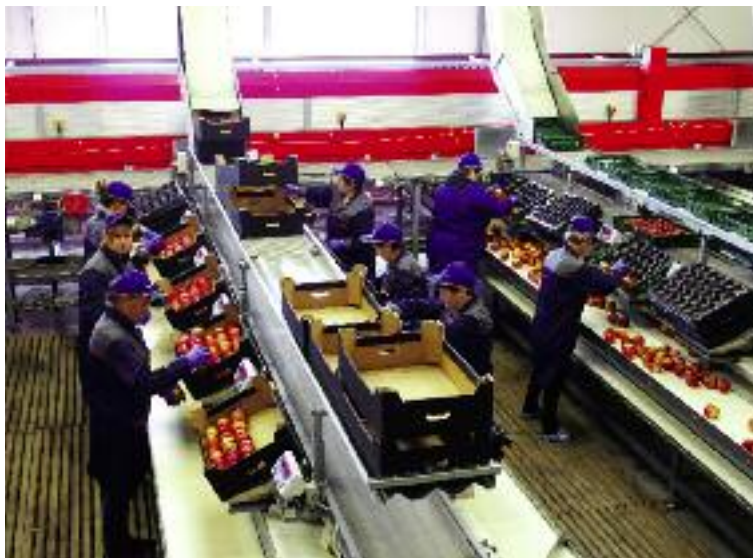
We wrześniu br. ARiMR uruchomiła nabór wniosków o przyznanie pomocy na działanie „Tworzenie grup producentów i organizacji producentów”

W 2015 r. wydano odpowiednie rozporządzenie, w którym m.in. uelastyczniono warunki przyznawania premii poprzez uwzględnienie różnej kolejności czyn-