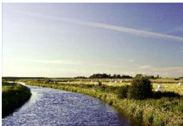
W rezerwie celowej budżetu państwa, środki na realizację zadań z zakresu utrzymania urządzeń melioracyjnych zostały zaplanowane w wysokości 260 mln zł

ki rezerwy celowej w wysokości 260 mln na wsparcie budżetów wojewodów w realizacji najpilniejszych zadań z zakresu utrzymania urządzeń melioracji wodnych podstawowych i wód istotnych dla regulacji stosunków wodnych na potrzeby rolnictwa, a także na zwiększenie dotacji podmiotowej na dofinansowanie spółek wod-