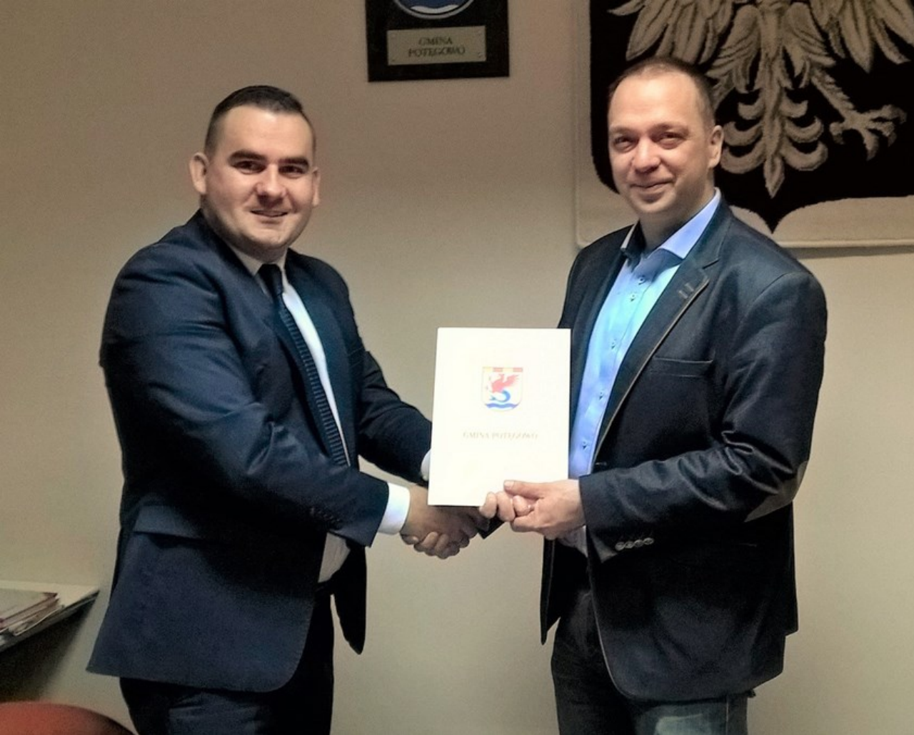
Podpisanie umowy pomiędzy Gminą Potęgowo, a spółką Nadmorskie Elektrownie Wiatrowe Darżyno.