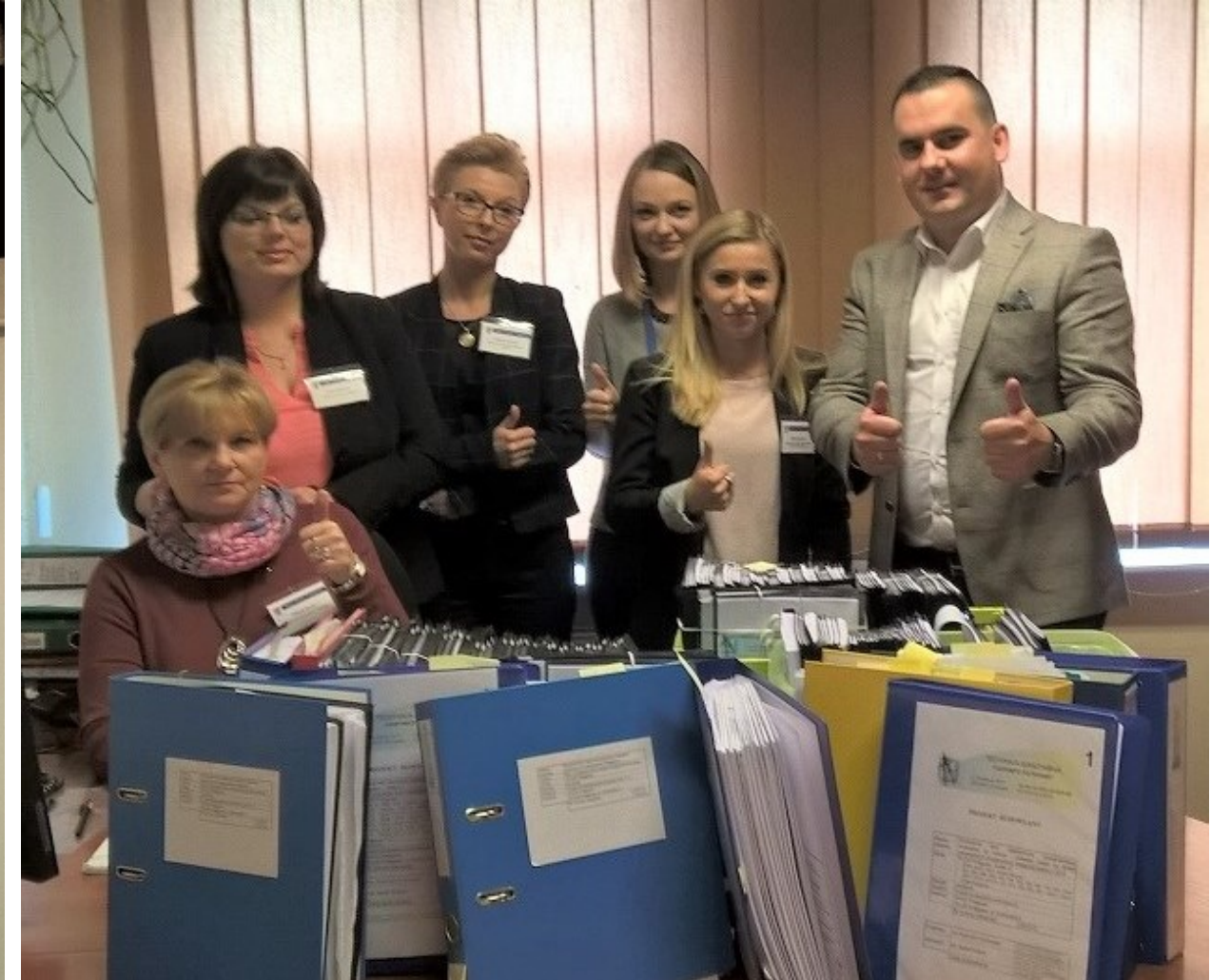
Zespół zadaniowy, składający się z pracowników Urzędu Gminy oraz Zakładu Usług Publicznych w Potęgowie.