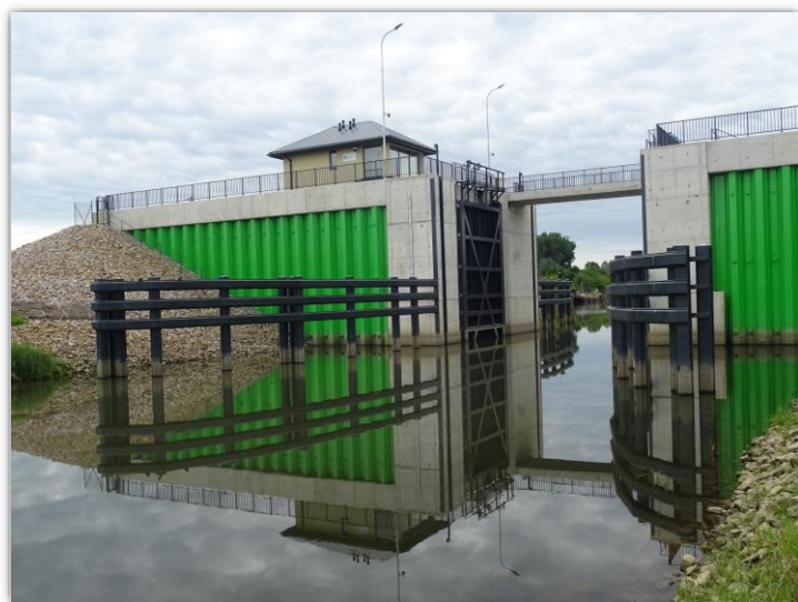
Brama Przeciwpowodziowa wraz z urządzeniami towarzyszącymi w osi kanału dopływowego do Portu Rzecznego w Sandomierzu.