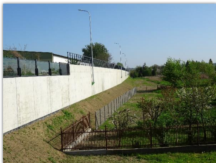
Mur oporowy wzdłuż ul. Mostowej