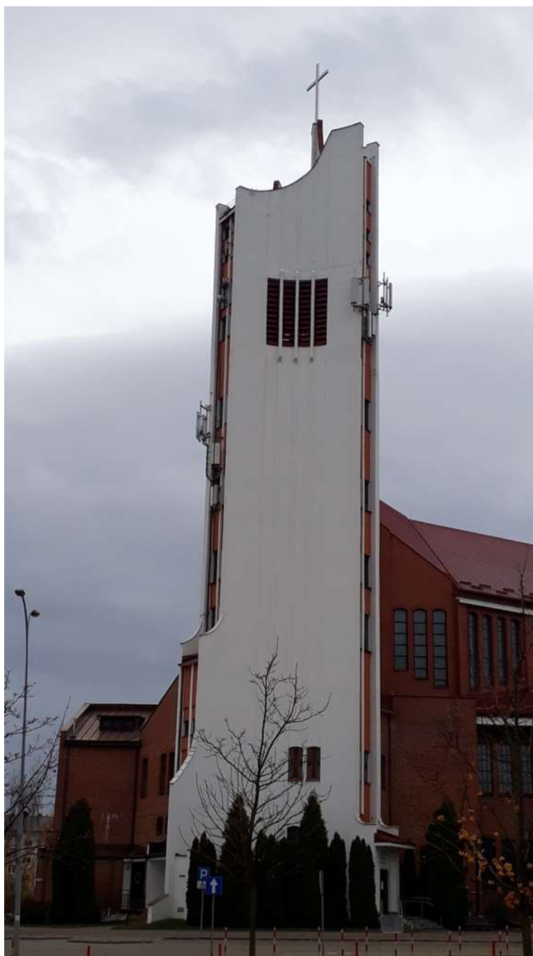
Fot. 1: Widoki anten stacji bazowych ID: 24020, ID: BIA1030 oraz ID: BT14153, zlokalizowanych: ul. Słonecznikowa 8, 15-660 Białystok