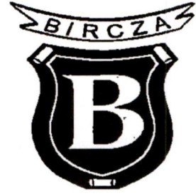
Rada Gminy Bircza