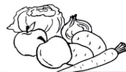
Ceny skupu netto w zakładach przetwórczych i chłodniach zbierane 14-15-II 2022 r. (zł/kg)

NOTOWANIA W DNIACH: 07.02.2022 – 17.02.2022 r.