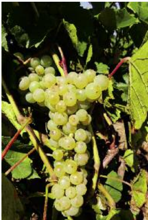
Aurora – odmiana wyhodowana we Francji, zaliczana do grupy mieszańców międzygatunkowych

kości w obrębie rodzaju. Najważniejsze cechy form należących do tego gatunku to: skórka jagód zrośnięta z miąższem, liście na planie pięciokąta, krzewy wrażliwe na choroby grzybowe, filokserę i mróz. Do lat 60-tych XIX stulecia w Europie (także w Polsce) uprawiano wyłącznie winorośl właściwą. Obecnie w naszym kraju są bardziej rozpowszechnione mieszańce międzygatunkowe o lepszej tolerancji na choroby grzybowe i mróz niż winorośl właściwa.