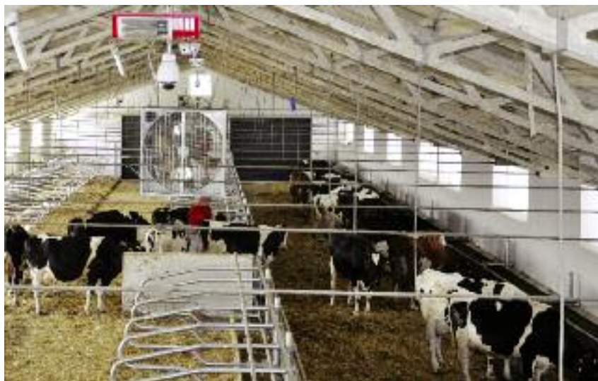
Nowoczesna obora wyposażona w system kamer, z których obraz transmitowany jest do szkolnej sali. Dzięki temu uczniowie ZSCKR w Zduńskiej Dąbrowie mogą na bieżąco obserwować naturalne zachowania krów

kwalfikacji zawodowych mieszkańców wsi. Pomocnym dla szkół w realizacji tych zamierzeń będzie wsparcie Krajowego Centrum Edukacji Rolniczej w Brwinowie. Placówka jest nadzorowana przez Ministra Rolnictwa i Rozwoju Wsi i posiada szereg doświadczeń zaczerpniętych z innych państw w zakresie wsparcia metodycznego dla kadry kierowniczej oraz nauczycieli uczą-