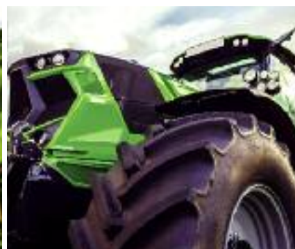
Premię można przeznaczyć m.in. na zakup stada podstawowego zwierząt hodowlanych, zainwestować w sady i plantacje wieloletnie lub zakup nowych maszyn i urządzeń