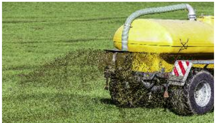
Produkty pofermentacyjne będą wprowadzane do obrotu bez pozwoleń Ministra Rolnictwa i Rozwoju Wsi