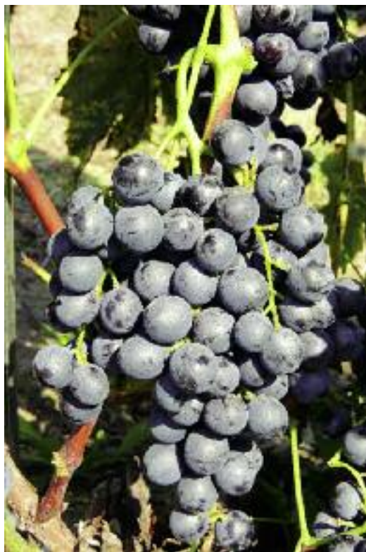
Muscat Bleu – mieszańiec o deserowych owocach, odznaczających się świeżym, muszkatołowym aromatem

labrusca i V. vinifera ) oraz Dela-ware (R) ( V. labrusca V. aestivalis , V. vinifera ). Ważną grupą mieszańców międzygatunkowych są odmiany wyhodowane we Francji, przez krzyżowanie V. vinifera , V. riparia , V. rupestris i V. lincecumii – Aurora (B) ( Aurora , Seibel 5279), Baco Noir (N), Leon Millot (N) (Kulmann 194-2), Marechal Foch (N) (Kulmann 188-2) i Seyval (B) ( Seyval Blanc , Seyve-Villard 52-76), których owoce są przeznaczone do wyrobu wina.