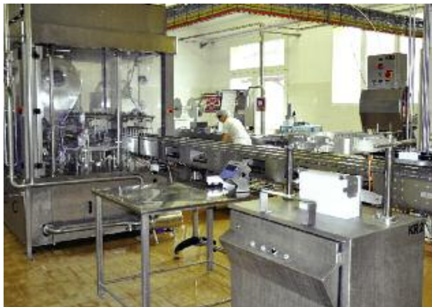
Unijne dotacje pozwoliły OSM w Nowym Dworze Gdańskim wyposażyć zakład w nowoczesne linie technologiczne

W ramach programów SAPARD, SPO oraz PROW spółdzielnia uzyskała do tej pory refundację kosztów zadań inwestycyjnych na łączną kwotę ok. 9,6 mln zł. Pieniądze te umożliwiły przeprowadzenie modernizacji linii technologicznych m.in. do produkcji serów, twarogów, budowę nowoczesnej kotłowni, zakup urządzeń chłodniczych, pakujących, zbiorników do magazynowania mleka i autocystern do transportu surowca. Ze środków PROW 2014-2020, a dokładnie z budżetu działania Przetwórstwo i marketing produktów rolnych , spółdzielnia kupiła m.in. urządzenia do produkcji i pakowania sera