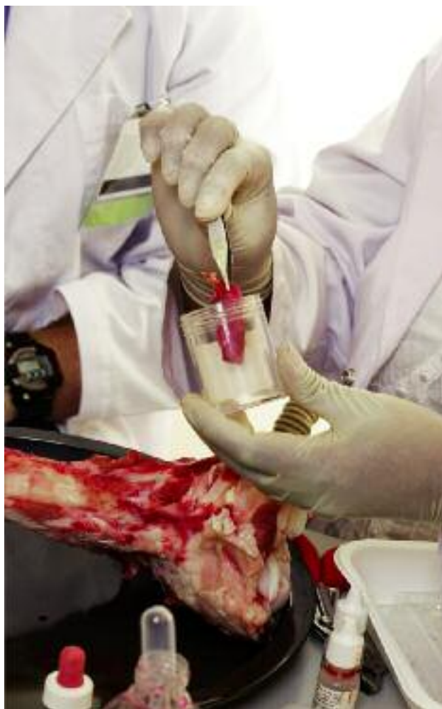
Rzeźnia, w której dokonywano nielegalnego uboju została zamknięta zaś mięso znajdujące się w ubojni zostało zabezpieczone i przebadane. Nie stwierdzono w nim zagrożeń biologicznych, jednak zostało wycofane z obrotu, gdyż pochodziło z uboju prowadzonego niezgodnie z obowiązującymi przepisami prawa

Minister Jan Krzysztof Ardanowski będzie wnioskował