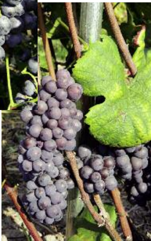
Pinot Gris – jedna z dawnych odmian winorośli właściwej