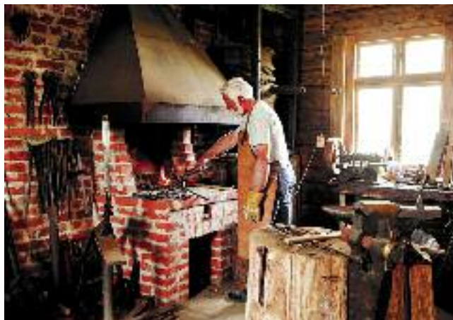
Gospodarstwo „Chlebowa chata” zrealizowało program edukacyjny „Życie wiejskie w pigułce”

padzie 2011 r. w wyniku ogólnopolskiego projektu realizowanego przez CDR Oddział w Krakowie na zlecenie MRiRW. Dla znaków słownych i słowno-graficznych „Zagroda edukacyjna” i „Ogólnopolska Sieć Zagród Edukacyjnych” Centrum Doradztwa Rolniczego Oddział w Krakowie posiada ochronę patentową.