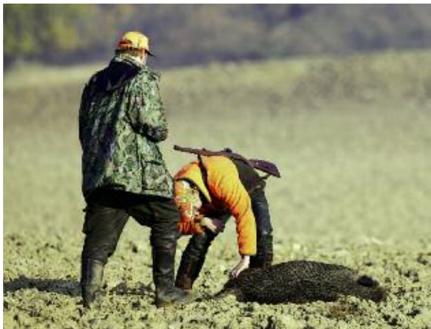
Intensyfikacja odstrzału dzików skierowana jest przede wszystkim na obszary objęte występowaniem wirusa ASF wraz ze 100 km. strefą buforową

Trzecim, obok wymienionych powyżej elementów zwalczania ASF w Polsce, tj. przestrzegania zasad bioasekuracji i odstrzału dzików, jest aktywne i ciągłe poszukiwanie szczątków padłych dzików i ich bez-