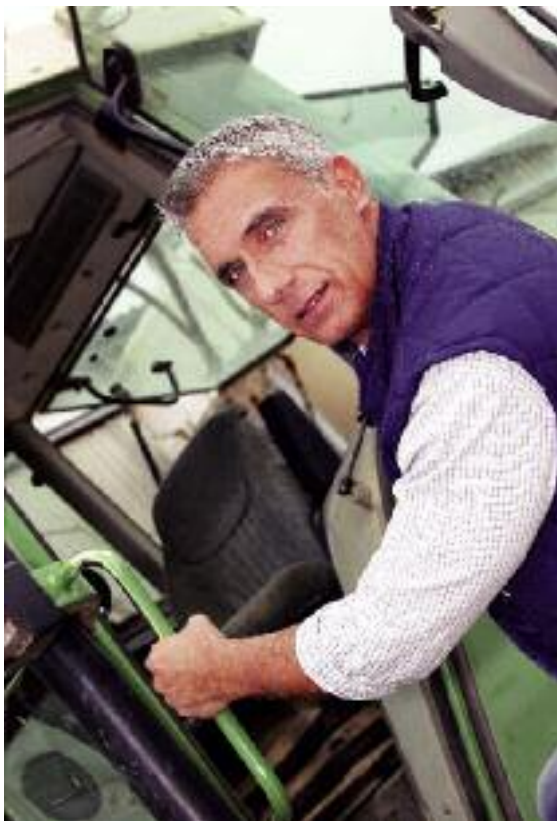
Strategia „Wizji Zero” ma uświadomić rolnikom ich wielką rolę w działaniach prewencyjnych w pracy rolniczej oraz wpłynąć na zmniejszenie liczby wypadków przy pracy i chorób zawodowych

Celem wdrożenia strategii jest podkreślenie wagi działań prewencyjnych Kasy mających na celu dalsze zmniejszanie liczby wypadków przy pracy i chorób zawodowych, a tym samym stworzenie lepszych warunków pracy i polepszenie zdrowia rolników. Plan obejmuje swoim działaniem rolników ubezpieczonych w KRUS i uwzględnia szereg narzędzi m.in. zintegrowanie metodologii działań prewencyjnych KRUS ze Strategią „Wizji Zero”, wykorzystanie kanałów ko-