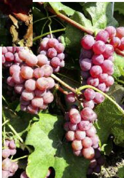
Lidia – odmiana najczęściej spotykana w polskich ogrodach

Znacznie bardziej wartościowymi odmianami pod względem smakowym są Ontario (B), Buffalo (N) (mieszańce V.