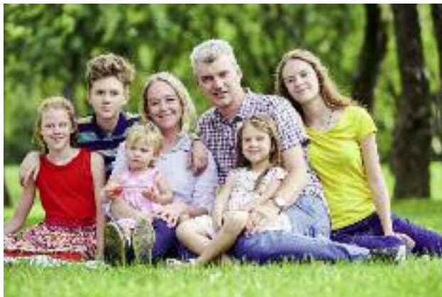
Na program „Mama 4+” w projekcie budżetu państwa na rok 2019 zarezerwowano ponad 801 mln zł. Świadczenie wypłacane będzie już od marca br.

Uzyskanie prawa do świadczenia nie będzie związane z wcześniejszym opłacaniem składek na ubezpieczenia społeczne. Po wejściu w życie nowych przepisów osoby spełniające kryteria, będą mogły złożyć wniosek do Prezesa Zakładu Ubezpieczeń Społecznych lub Prezesa Kasy Rolniczego Ubezpieczenia Społecznego w celu uzyskania prawa do świadczenia. W przypadku, gdy osoba zainteresowana pobiera już świadczenie niższe od najniższej emerytury, świadczenie rodzicielskie będzie uzupełniać pobierane świadczenie do kwoty najniższej emerytury (od 1 marca 2019 r. 1100 zł).