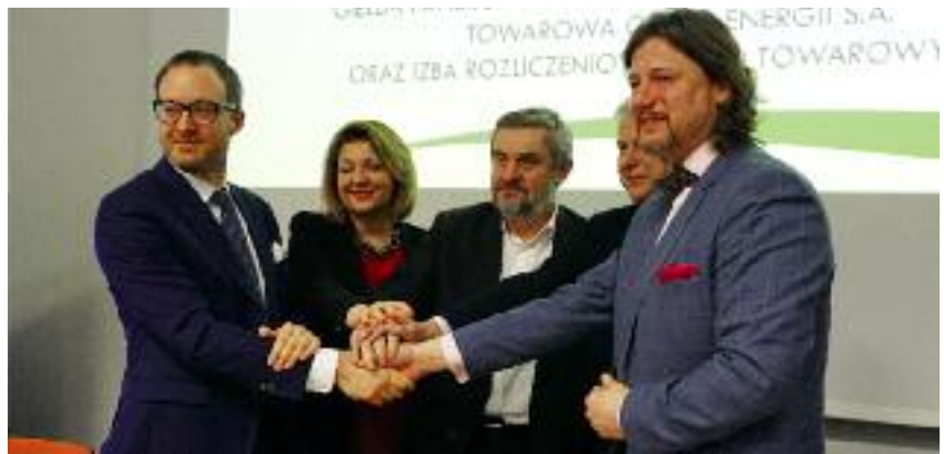
Pod koniec stycznia br. odbyło się uroczyste podpisanie umowy pomiędzy Krajowym Ośrodkiem Wsparcia Rolnictwa a konsorcjum w składzie: Giełda Papierów Wartościowych w Warszawie S.A., Towarowa Giełda Energii S.A. oraz Izba Rozliczeniowa Giełd Towarowych S.A. m.in. na opracowanie zasad, procedur i wzorów dokumentów związanych z pilotażowym wdrażaniem projektu