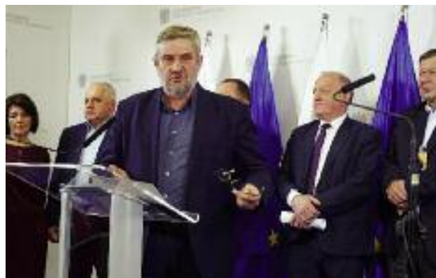
Konferencja prasowa ministra Jana Krzysztofa Ardanowskiego oraz przedstawicieli organizacji rolniczych nt. Porozumienia Rolniczego

Minister Ardanowski zaproponował, aby ta formuła dialogu nazwana była „Porozumieniem Rolniczym”, bo o dialog i porozumienie przede wszystkim chodzi. Szef resortu rolnictwa podczas spotkania z przedstawicielami związków i organizacji rolniczych zwrócił uwagę, że w ramach Porozumienia będą funkcjonowały grupy robocze i zespoły. W pracach będą także uczestniczyli