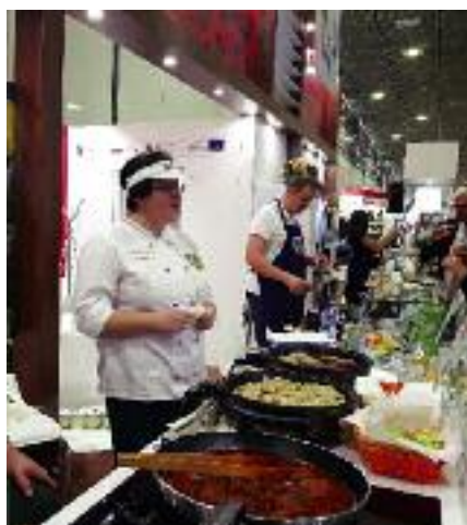
Polskie wystąpienie na targach odbywało się pod hasłem „Polska smakuje”