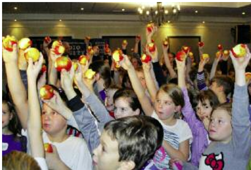
W każdym z 12 tygodni I semestru roku szkolnego 2018/2019 dzieciom udostępniano, co najmniej po trzy porcje owoców i warzyw

nym uczestniczyło prawie 12,4 tys. szkół podstawowych a w kompetencji mlecznym ponad 12,6 tys. Szkoły podstawowe mogą brać udział w jednym z komponentów lub obydwu z nich. W I semestrze roku szkolnego 2018/2019 w każdym z komponentów uczestniczyło ponad 1,8 mln dzieci.