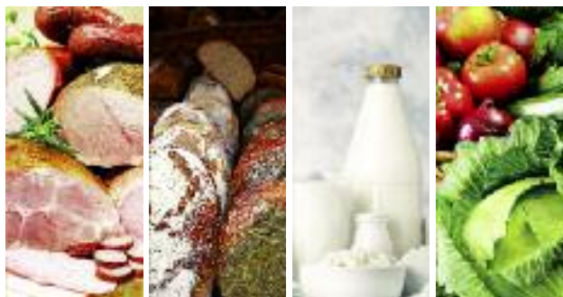
KE zaprasza do składania przez beneficjentów propozycji programów promocyjnych. Termin składania wniosków upływa 16 kwietnia br.

Ostateczny termin składania wniosków upływa 16 kwietnia 2019 r., o godzinie 17.00. Wnioski można składać jedynie za pośrednictwem specjalnego portalu.