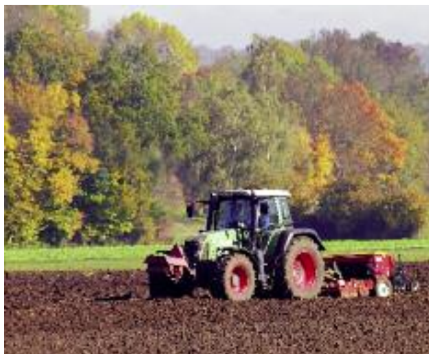
W tym roku rolnicy, podobnie jak to miało miejsce w roku 2018, będą mogli składać oświadczenia zamiast wniosków o przyznanie płatności bezpośrednich lub płatności obszarowych

w 2018 r. wnioskowali wyłącznie o jednolitą płatność obszarową, płatność za zazielenienie, płatność dodatkową, płatność związaną do powierzchni uprawy chmielu, płatność do owiec, płatność do kóz lub płat-