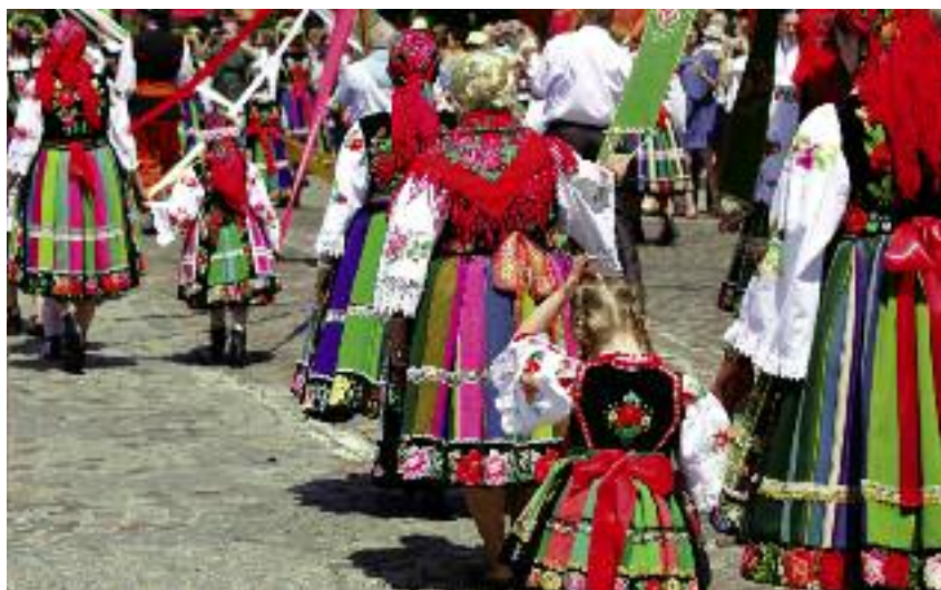
5043 koła zostały wpisane do 31 grudnia 2018 r. do Krajowego Rejestru Kół Gospodyń Wiejskich

29 listopada 2018 r. weszła w życie ustawa z 9 listopada 2018 r. o kołach gospodyń wiejskich, która wychodząc naprzeciw pilnej potrzebie nadania kołom osobowości prawnej, umożliwia tym organizacjom bezproblemowe jej uzyskanie poprzez wpis do Krajowego Rejestru Kół Gospodyń Wiejskich, pro-