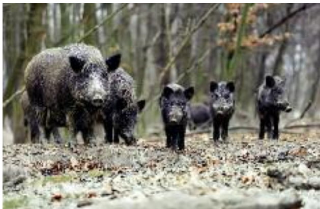
Odstrzał dzików w Polsce popiera Komisja Europejska

Zarówno Komisja Europejska, jak i EFSA uznają, że populacja dzików odgrywa istotną rolę w rozprzestrzenianiu się choroby i jej przetrwaniu w środowisku.