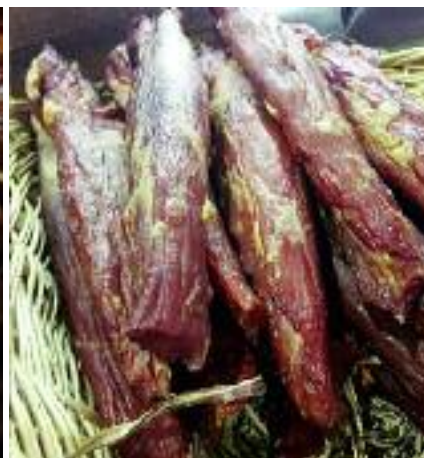
Nasze hity eksportowe na rynku niemieckim: jesiotr, gęszina i wyroby mięsne