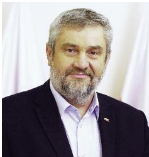
Jan Krzysztof Ardanowski, minister rolnictwa i rozwoju wsi