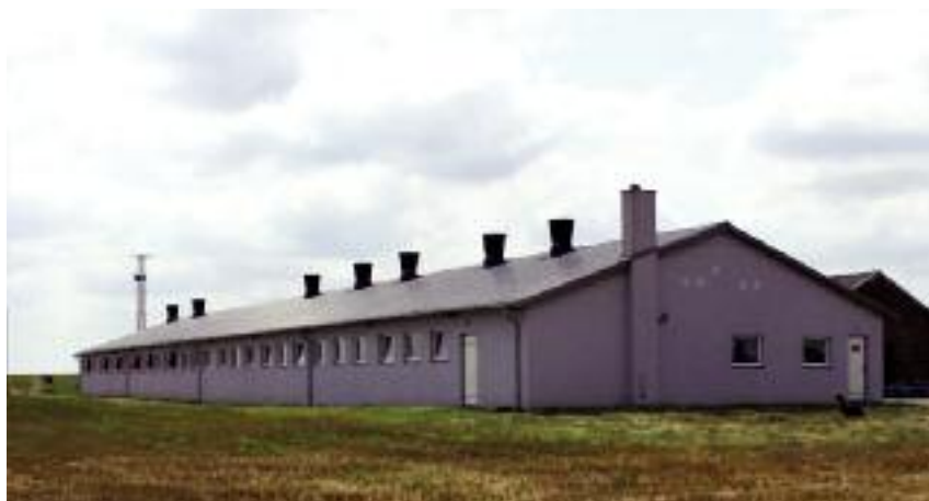
Dzięki unijnym dotacjom w gospodarstwie Łukasza Łuszczaka stanęła nowoczesna chlewnia o powierzchni 690,76 m 2

Pan Łukasz przejął gospodarstwo po swoim dziadku i ojcu. Zamiłowanie do rolnictwa, pasja, wiedza i chęć podejmowania wyzwań doprowadziły do stopniowej realizacji marzeń i wizji młodego gospodarza. W latach 2010-2017 dwukrotnie powiększył powierzchnię posiadanych gruntów rolnych – z 22 do 44 ha. Dodatkowo wydzierżawił 6 ha.