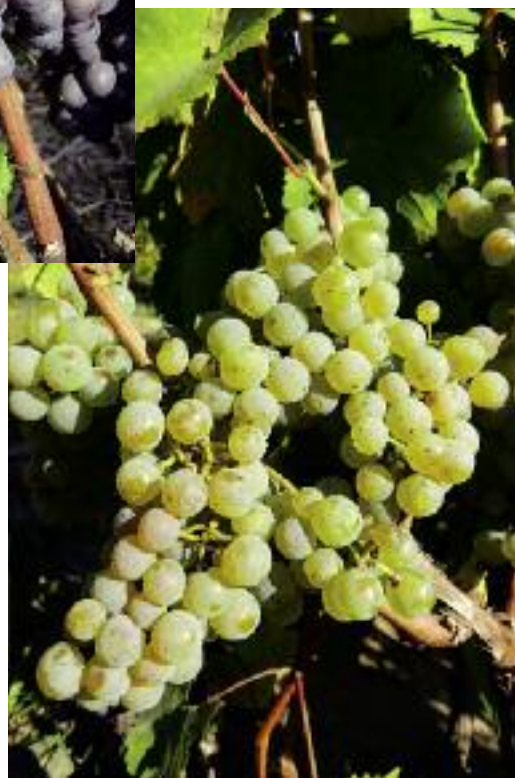
Riesling – kolejna odmiana zaliczana do dawnych odmian winorośli właściwej

gundzkie Czarne ), Pinot Gris (R) ( Burgundzkie Szare , Rulander ), Pinot Blanc (B) ( Burgundzkie Białe ), Pinot Noir Precoce (N) ( Burgundzkie Wczesne ) i Pinot Meunier (N) ( Młynarka , Pinot Wrotham ). Traminer Rot (R), Chardonnay (B), Veltliner Frührot (R) ( Wetlińskie Czerwone Wczesne ), Tauberschwarz (N) ( Karmazyn Lubuski ), Portugalskie Niebieskie (N)