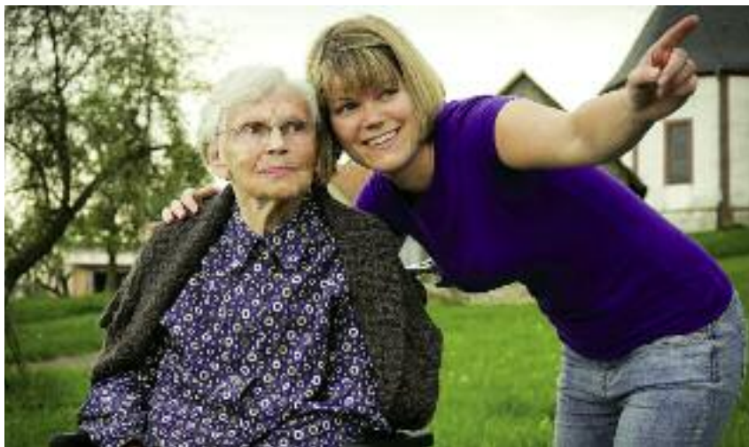
Celem projektu jest ułatwienie dostępu do przystępnych cenowo oraz wysokiej jakości usług społecznych poprzez zbudowanie i wdrożenie usługi opiekuńczej dla osób niesamodzielnych, realizowanej w wiejskim gospodarstwie domowym

Koncepcja rozwoju gospodarstw opiekuńczych w Polsce zakłada ścisłą współpracę pomiędzy rolnikami, systemem pomocy społecznej, doradcami rolniczymi, organizacja-