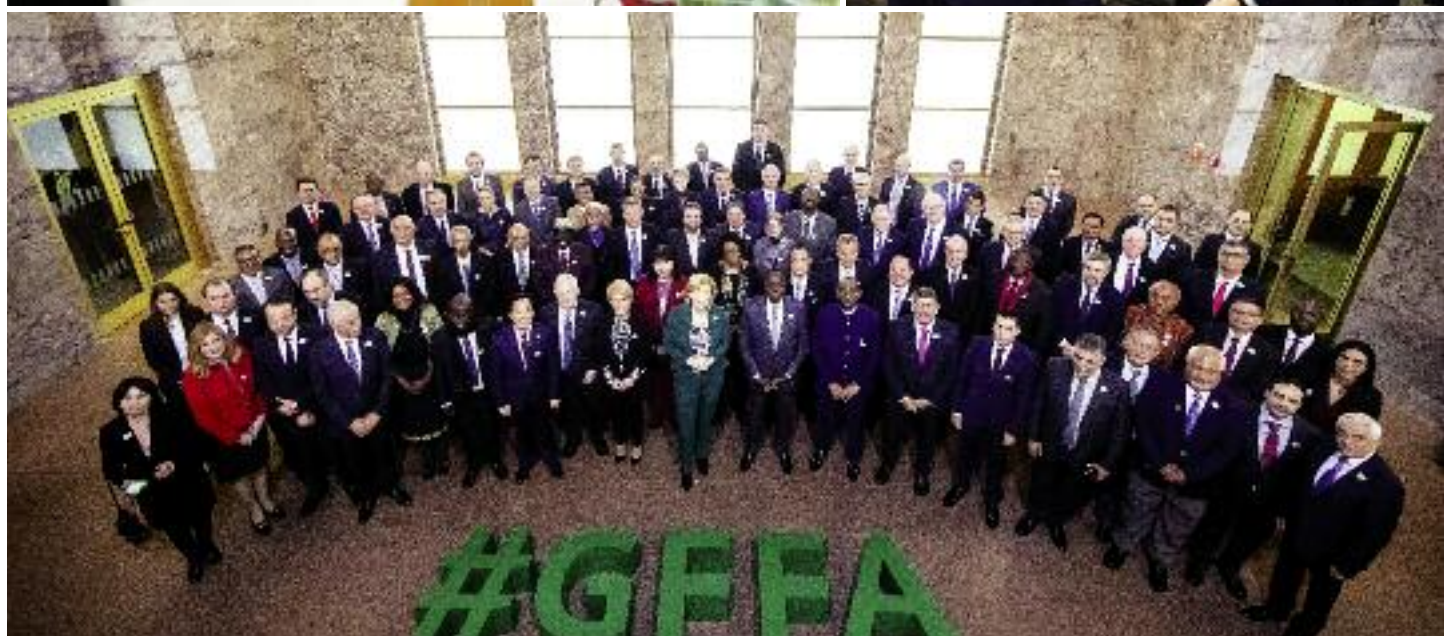
Międzynarodowe rozmowy ministra rolnictwa Jana Krzysztofa Ardanowskiego podczas światowych targów żywności, rolnictwa i ogrodnictwa „Zielony Tydzień” w Berlinie