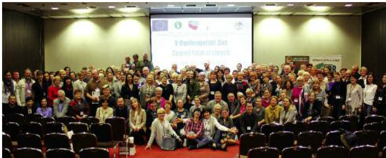
Uczestnicy V Ogólnopolskiego Złotu Zagród Edukacyjnych w Krakowie

Koncepcja Ogólnopolskiej Sieci Zagród Edukacyjnych została zainicjowana i jest wdrażana przez Centrum Doradztwa Rolniczego Oddział w Krakowie, jako działanie ustawowe określone art. 4. ustawy o jednostkach doradztwa rolniczego. Powiązanie działalności rolniczej z usługami społecznymi stanowi nowy nurt w rolnictwie wielofunkcyjnym, określany mianem rolnictwa społecznego. Dziedzina obejmuje działania wykorzystujące możliwości, jakie daje rolnictwo do wspierania terapii, rehabilitacji, integracji społecznej, edukacji oraz usług społecznych na terenach wiejskich. Jest to równocześnie szansa na poszerzenie działalności i dodatkowe dochody dla rodzin rolniczych oraz zachowanie żywotności i rolniczego charakteru obszarów wiejskich. Pojęcie gospodarstwa edukacyjnego wraz z jego identyfikacją rynkową w postaci nazwy „Zagroda edukacyjna” zostało zdefiniowane w listo-