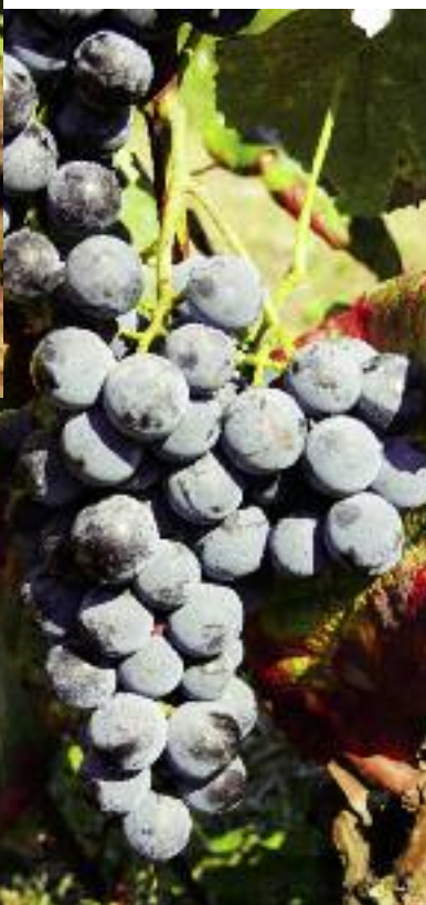
Buffalo – odmiana o granatowoczarnej skórcie jagód, mieszaniec V. labrusca i V. vinifera

go kraju. Liczy ona blisko 350 genotypów. Celem kolekcji jest zachowanie zasobów genowych winorośli (także odmian hodowanych w Polsce) oraz ich ocena pod kątem cech morfologicznych, agrobiologicznych i użytkowych. Wśród zgromadzonych genotypów znajdują się