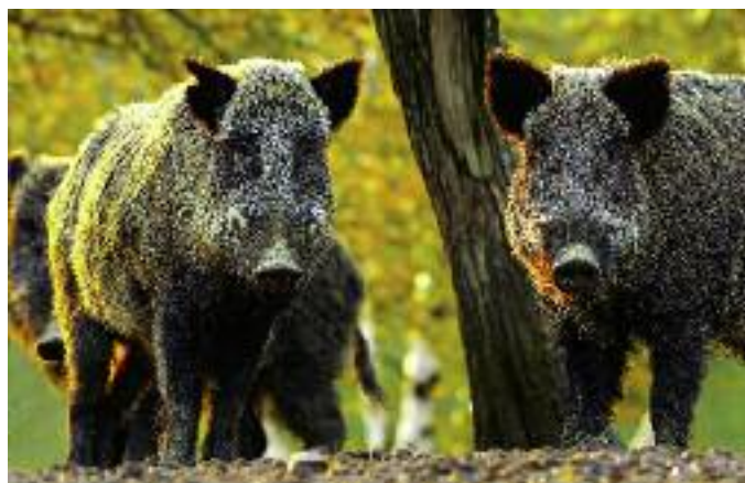
Uwzględniając realne zagrożenie wystąpienia kolejnych ognisk ASF w gospodarstwach, uznano za konieczne zintensyfikowanie odstrzału dzików

dzików w ramach polowań skoordynowanych, obejmuje niektóre obwody łowieckie zlokalizowane na zachód od strefy tzw. cichych polowań w województwach: pomorskim, warmińsko-mazurskim, podlaskim, mazowieckim, łódzkim, świętokrzyskim, lubelskim i podkarpackim.