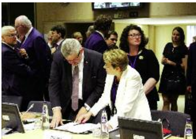
W czasie styczniowego posiedzenia Rady UE Polska zabiegała o utrzymanie obecnego poziomu finansowania rozwoju obszarów wiejskich po 2020 r.

isję Europejską prezentacji nt. warunków produkcji roślin białkowych w Unii oraz możliwych narzędzi wspierania tej produkcji dostępnych w nowej perspektywie finansowej, przeprowadzona została debata orientująca pośród przedstawicieli państw członkowskich. Zdaniem Ministra plan białkowy jest jednym z najważniejszych tematów poruszanych obecnie na forum UE. Polska popiera wszelkie działania Komisji Europejskiej na rzecz zwiększenia produkcji roślin białkowych, by unie-