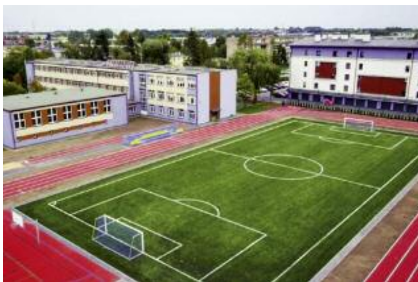
Boisko wraz z bieżnią w ZSCKR w Sokółowie Podlaskim

ustawicznego, które organizują głównie kwalifikacyjne kursy zawodowe, umożliwiające osobom dorosłym zdobywanie poszczególnych kwalifikacji zawodowych przewidzianych w danym zawodzie, a także inne formy kursów umożliwiających uzyskanie i uzupełnianie wiedzy niezbędnej do prowadzenia nowoczesnego gospodarstwa rolnego.