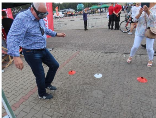
Zdj. 1. Próba przejścia slalomu w narkogoglach „Skutki zażywania narkotyków”