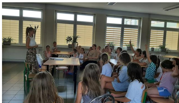
Zdj. 3 i 4: Uczestnicy letnich wypoczynków