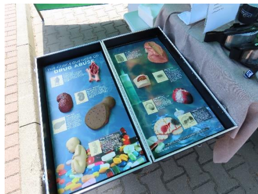
Zdj. 2 Walizka edukacyjna „Skutki zażywania narkotyków”