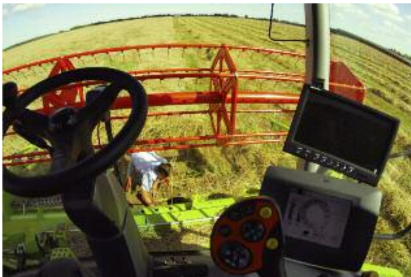
Pomoc można będzie otrzymać m.in. na zakup, także w formie leasingu zakończonym przeniesieniem prawa własności, nowych kombajnów zbożowych...