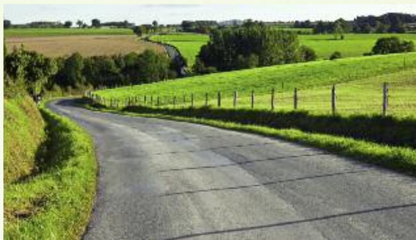
Na przełomie 2015/2016 r. przeprowadzono nabory na operacje typu „Budowa lub modernizacja dróg lokalnych”

We wrześniu ARiMR uruchomiła nabór wniosków o przyznanie pomocy na ww. działanie finansowane z PROW 2014-2020. Wnioski o przyznanie takiego wsparcia będzie można składać od 30 września do 28 listopada 2016 r. w Oddzia-