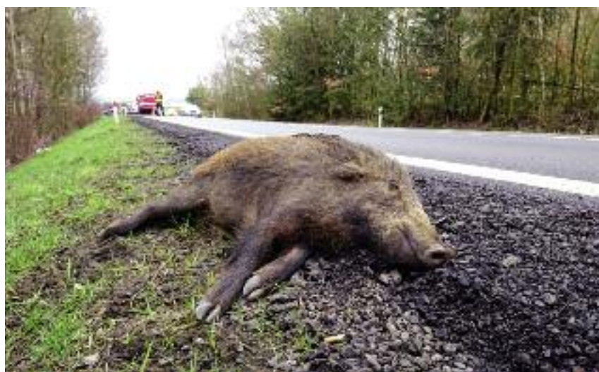
Próbki do badań pobierane są m.in. od dzików zabitych w wypadkach komunikacyjnych

● Wydane zostało Rozporządzenie Ministra Rolnictwa i Rozwoju Wsi z dnia 19 lutego 2016 r. w sprawie zarządzenia odstrzału sanitarnego dzików (Dz. U. poz. 229).