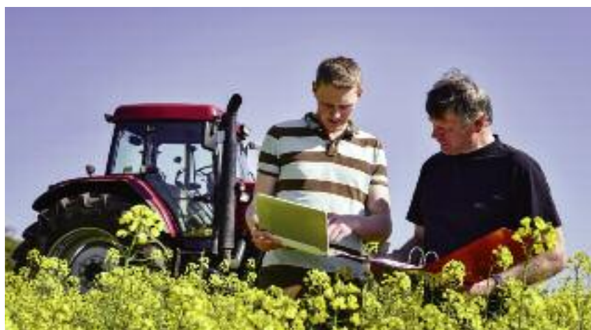
Ważnym obszarem w działalności ODR jest świadczenie usług doradczych i prowadzenie działalności szkoleniowej w celu podniesienia konkurencyjności gospodarstw rolnych

nych. Jednym z narzędzi do osiągnięcia tego celu są działania objęte Programem Rozwoju Obszarów Wiejskich na lata 2014-2020.