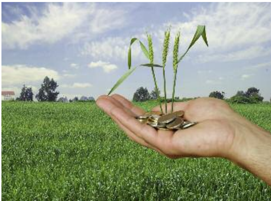
ARR wyda decyzje przyznające dopłaty w ciągu 60 dni od dnia wejścia w życie rozporządzenia

Agencja Rynku Rolnego wyda decyzje przyznające dopłaty w ciągu 60 dni od dnia wejścia w życie