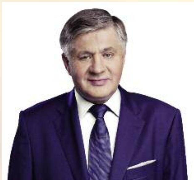
Krzysztof Jurgiel, minister rolnictwa i rozwoju wsi