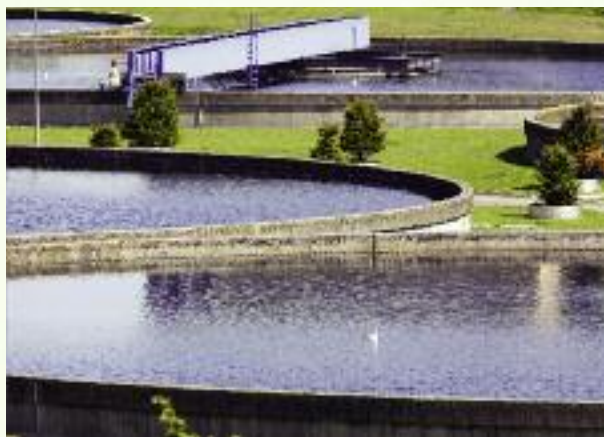
Samorządy województw rozpoczynają przyjmowanie wniosków na wsparcie inwestycji „Gospodarka wodno-ściekowa” w ramach PROW 2014-2020