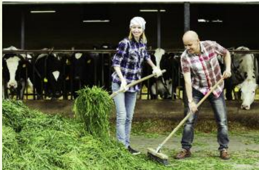
W ramach naborów na poddziałanie „Wsparcie inwestycji w gospodarstwach rolnych” przeprowadzonych w 2015 r. i 2016 r. złożono 32 993 wnioski

ta 2007-2013 zrealizowano płatności dla 5505 beneficjentów na kwotę prawie 6,7 mln zł.