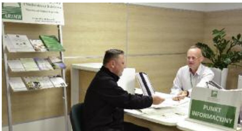
Od 1 września się w każdym Biurze Powiatowym i Oddziale Regionalnym ARiMR znajdują się Punkty Informacyjne. Są one jednolicie oznakowane i łatwo dostępne dla beneficjentów

– By móc skorzystać z pewnych programów wsparcia, rolnik musi mieć nawet kilka miesięcy na przygotowanie kompletnej dokumentacji. W punkcie dowie się, kiedy planowany jest nabór wniosków na interesujące go działanie, wymaganiach, jakie wnioskodawcy stawiają