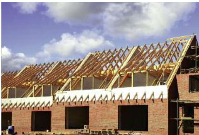
Dobrze w praktyce funkcjonują przepisy służące zagwarantowaniu terenów niezbędnych pod inwestycje np. budownictwo mieszkaniowe

lub kupnem gruntów rolnych. Dodatkowo Prezes Agencji powołał grupę roboczą składającą się z pracowników Agencji, którzy za pośrednictwem tej strony internetowej, na bieżąco odpowiadają na pytania zadawane przez rolników lub innych zainteresowanych. Podobny serwis funkcjonuje na stronach Ministerstwa (dostępny jest w zakładce pn. „Ustawa o ziemi – pytania i odpowiedzi”).