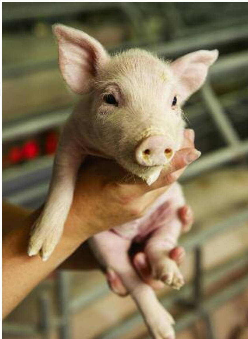
Nowe przepisy wprowadzają obowiązek oznakowania świń w ciągu 30 dni od dnia ich urodzenia oraz obowiązek zgłaszania tego faktu kierownikowi Biura Powiatowego ARiMR w terminie 7 dni

jącej obowiązkowi zwalczania, na wprowadzenie dodatkowych zabezpieczeń na terenie gospodarstwa takich jak np. nakaz budowy ogrodzenia.