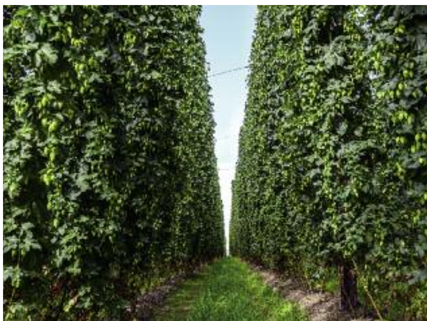
Od 2015 r. w Polsce stosowane są płatności związane m.in. z produkcją chmielu

w systemie płatności związanych z produkcją na lata 2017-2020. Dokonując modyfikacji, uwzględniono – zgodnie z wytycznymi UE – obserwowane trendy w produkcji w latach 2014-2015. Dlatego też, w celu uniknięcia negatyw-