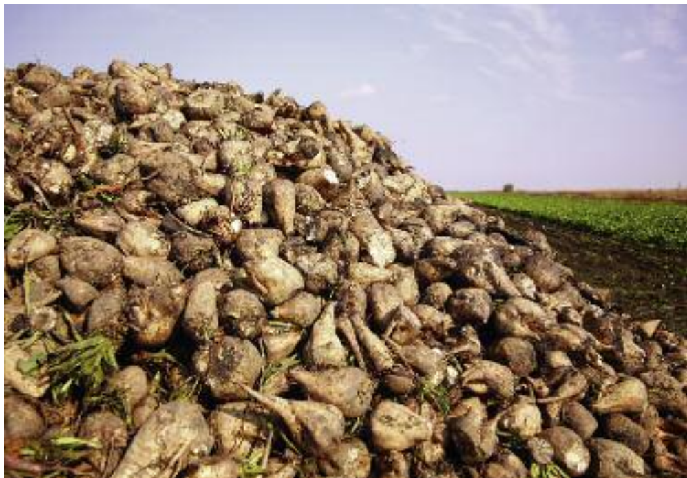
Wsparcie będzie przysługiwało do powierzchni upraw wszystkich buraków cukrowych