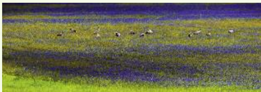
Pierwszy nabór wniosków o przyznanie płatności w ramach działania „Rolnictwo ekologiczne” został przeprowadzony w ubiegłym roku

Pierwszy nabór wniosków o przyznanie płatności w ramach działania Rolnictwo ekologiczne został