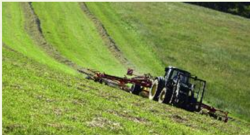
Ponad 752 tys. wniosków zostało złożonych w 2016 r. w ramach naboru o przyznanie płatności obejmującej wsparcie z tytułu gospodarowania na obszarach ONW