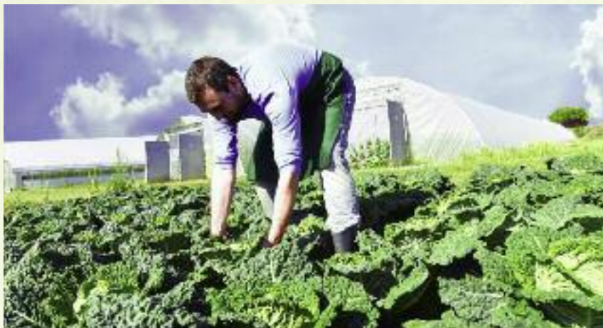
3590 wniosków o przyznanie pomocy na kwotę 359 mln złotych złożono w 2016 r. w ramach poddziałania „Pomoc na rozpoczęcie działalności gospodarczej na rzecz młodych rolników”

w ramach strategii rozwoju lokalnego kierowanego przez społeczność. Terminy ustalane są indywidualnie przez poszczególne LGD.