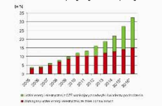
Zestawienie nadwyżki udziału energii elektrycznej z odnawialnych źródeł energii wynikającej z wydanych świadectw pochodzenia w stosunku do wymaganego udziału tej energii

Źródło: Obliczenia MRiRW na podstawie danych Urzędu Regulacji Energetyki, * dane za lata 2015-2016 szacunkowe