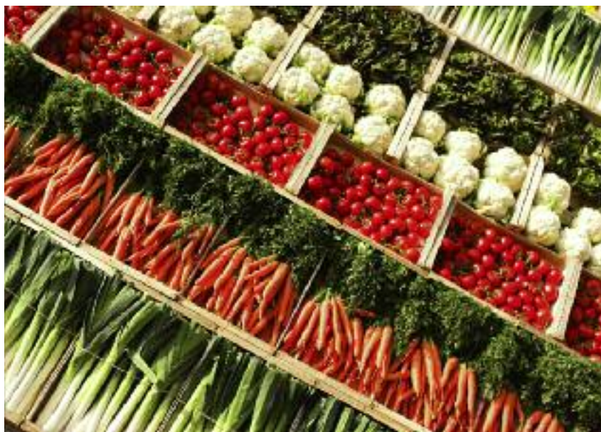
Do 15 października br. ARiMR przyjmowała od producentów mleka, świń lub owoców i warzyw wnioski o udzielenie pożyczki na sfinansowanie nieuregulowanych należności budżetowych o charakterze publicznoprawnym