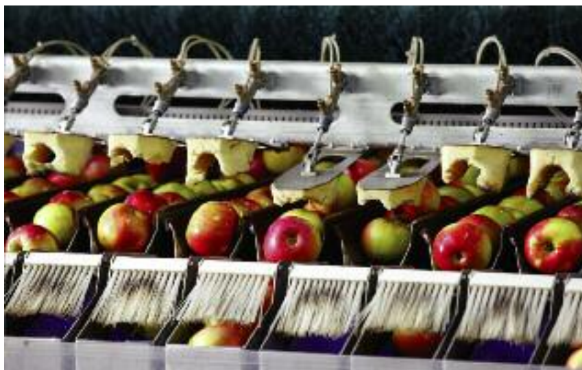
...oraz zakup narzędzi lub urządzeń przeznaczonych do mycia, suszenia, czyszczenia, sortowania, kalibrowania, ważenia i pakowania produktów rolnych w celu przygotowywania ich do sprzedaży

Prezes Agencji Restrukturyzacji i Modernizacji Rolnictwa nie później niż w terminie 90 dni liczonych od dnia upływu terminu składania wniosków o przyznanie pomocy, poda do publicznej wiadomości (na stronie internetowej ARiMR) informację o kolejności przysługiwania pomocy w województwie mazowieckim i łącznie w pozostałych województwach.