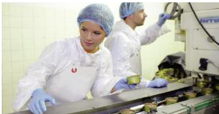
Głównym celem wprowadzonej ustawy jest potrzeba zapewnienia możliwości zagospodarowania produktów pochodzenia zwierzęcego przeznaczonych do spożycia przez ludzi wyprodukowanych z mięsa świń wolnych od ASF, utrzymywanych na obszarach, na których wprowadzono ograniczenia w związku z wystąpieniem tego wirusa

W ustawie przewidziano także wymagania dla potencjalnych wykonawców zamówień. Podmiot ubiegający się o udzielenie zamówienia będzie bowiem obowiązany do złożenia, wraz z ofertą, oświadczenia, że produkty przez niego oferowane spełniają wymagania ww. ustawy.