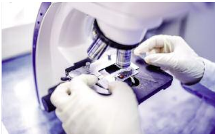
W Państwowym Instytucie Weterynaryjnym – PIB w Puławach w kierunku ASF zbadano blisko 67 tys. próbek

● Wzmocniono terenowe organy Inspekcji Weterynaryjnej poprzez oddelegowanie dodatkowych pracowników do pracy w Powiatowych In-