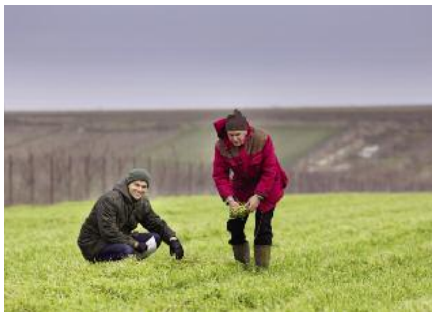
Po wejściu w życie ustawy „o wstrzymaniu sprzedaży nieruchomości Zasobu Własności Rolnej Skarbu Państwa oraz o zmianie niektórych ustaw” obrót nieruchomościami rolnymi odbywa się głównie między rolnikami

Dobrze w praktyce funkcjonują przepisy służące zagwarantowaniu terenów niezbędnych pod inwestycje np. budownictwo mieszkaniowe. Przepisy ustawy o kształtowaniu ustroju rolnego nie mają bowiem zastosowania do tych gruntów rolnych, które w dniu 30 kwietnia 2016 r. na mocy ostatecznych decyzji o warunkach zabudowy i zagospodarowania terenu przeznaczone są na cele inne niż rolne, jak również do nieruchomości, które w tej dacie nie przekraczają powierzchni 0,5 ha i są zajęte pod budynki mieszkalne oraz budynki, budowle i urządzenia niewykorzystywane do produkcji rolniczej, wraz z gruntami do nich przyległymi umożliwiającymi ich właściwe wykorzystanie oraz zajęte na urządzenie ogródka przydomowego (tzw. siedliska).