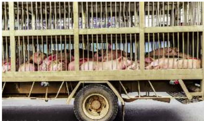
Wzmocniona została współpraca z Inspekcją Transportu Drogowego w zakresie intensyfikacji kontroli środków transportu, którymi może być dokonywany przewóz świń na drogach województw zagrożonych ASF

Ustawa zawiera również przepisy, które umożliwiają nakazanie posiadaczowi zwierząt podjęcia określonych działań, aby zabezpieczyć gospodarstwo przed przenikaniem czynnika zakaźnego, przy zwalczaniu choroby zakaźnej zwierząt. Przepis ten pozwoli powiatowemu lekarzowi weterynarii na podejmowanie decyzji, w zależności od aktualnej sytuacji epizootycznej w zakresie konkretnej choroby podlega-