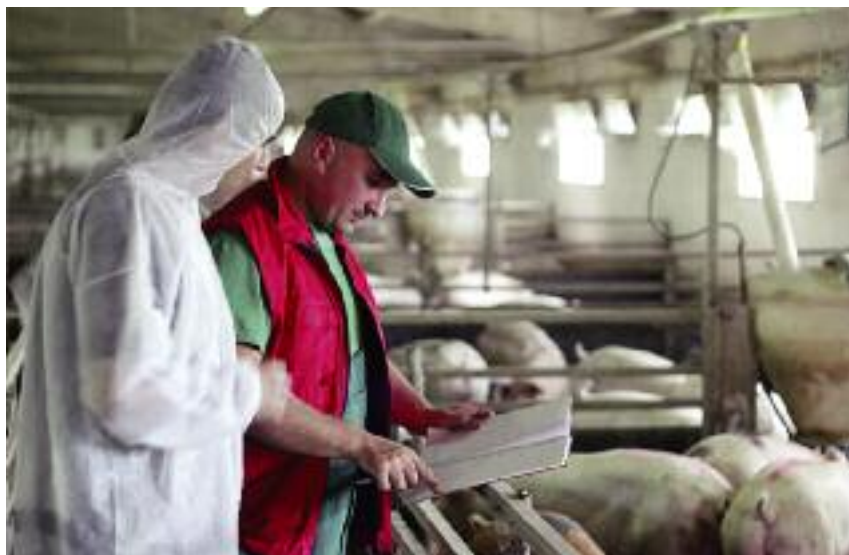
Na terytorium całego kraju prowadzony jest stały monitoring w kierunku ASF

Rozporządzenie wdraża decyzję wykonawczą Komisji 2016/1452/UE z dnia 2 września 2016 r. dotyczącą niektórych tymczasowych środków ochronnych w odniesieniu