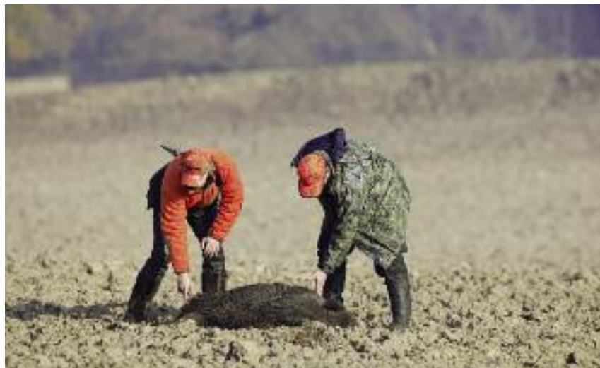
Wzdłuż wschodniej granicy Polski realizowany jest sanitarny odstrzał dzików

stu tysięcy sztuk trzody chlewnej z terenów zagrożonych wystąpieniem wirusa ASF i przerobienie ich na konserwy. Tak przerobione mięso ma docelowo trafiać do instytucji publicznych. Będzie ono zamawiane z pominięciem prawa zamówień publicznych.