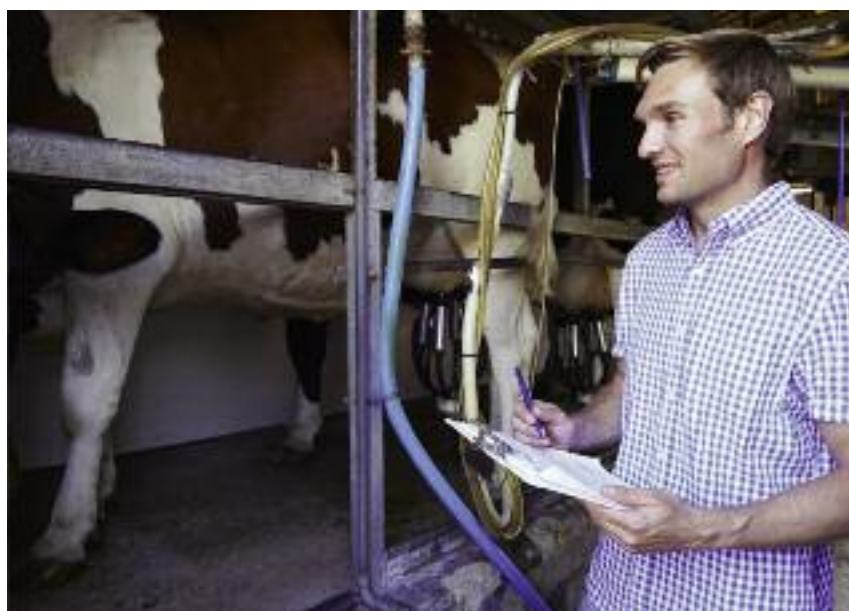
Wdrożony Pakiet wsparcia rolnictwa jest odpowiedzią Komisji Europejskiej na zakłócenia sytuacji na rynku mleka, w wyniku których producenci w tym sektorze ponieśli straty związane ze spadkiem cen skupu

Lipcowy pakiet wsparcia rolnictwa obejmuje również propozycje dotyczące systemu płatności bezpośrednich i płatności obszarowych w ramach PROW. Zgodnie z rozporządzeniem wykonawczym Komisji (UE) 2016/1616 z dnia 8 września 2016 r. wprowadzającym odstępstwo od rozporządzenia Parlamentu Europejskiego i Rady (UE) nr 1307/2013 w odniesieniu do ewentualnej rewizji środków dobrowolnego wsparcia związanego z produkcją w sektorze mleka i przetworów mlecznych w odniesieniu do roku składania wniosków 2017, państwa członkowskie mają możliwość dokonania rewizji instrumentów, stosowanych w ramach wsparcia związanego z produkcją w sektorze mleka i przetworów mlecznych, realizowanych na podstawie art. 52 rozporządzenia PE i Rady (UE) nr 1307/2013. Przegląd ten jest dobrowolny a jego celem jest zastąpienie w roku 2017 obecnych płatności związanych z produkcją w sektorze mleka, płatnością o charakterze historycznym, niezwiązaną z produkcją (decoupled). Płatność niezwiązana w sektorze mleka obowiązywałaby tylko w roku 2017 i przysługiwałaby tylko tym rolnikom, którzy w 2016 roku spełniali warunki kwalifikowalności do płatności związanej do krów (brak możliwości „nowych przystąpień” w roku 2017). Jednocześnie rolnicy ci nie musieliby już utrzymywać stada.