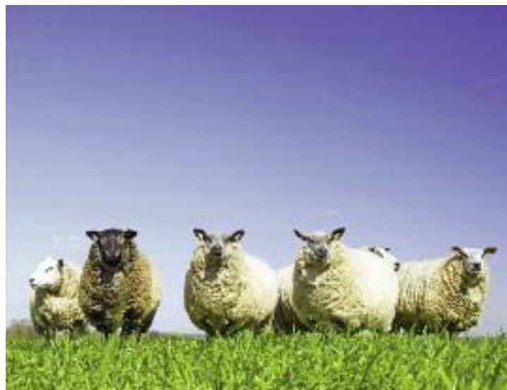
Dofinansowaniem nadal objęty będzie sektor produkcji bydła oraz owiec