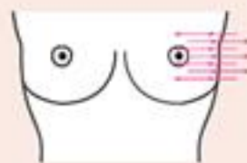
3. Od boku do centrum i odwrotnie