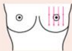
1. Od góry w dół