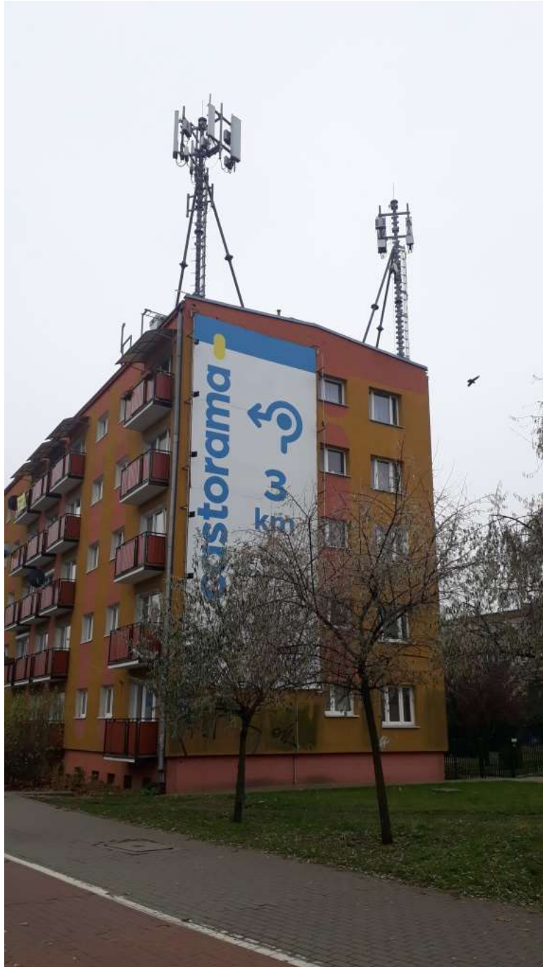
Fot. 1: Widoki anten stacji bazowej ID: BT42515, zlokalizowanej: ul. Skłodowskiej-Curie 40, 35-001 Bydgoszcz