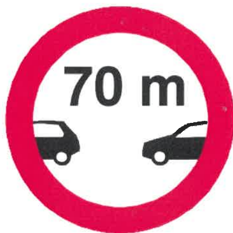
Znak C, 10 z konwencji wiedeńskiej

Konieczne trzeba zauważyć, że konwencja wiedeńska o znakach i sygnałach drogowych 6 przewiduje znak wskazujący odległość, jaką kierujący mają utrzymać między pojazdami – znak C, 10. Konwencja ta została ratyfikowana w 1988 r. przez Radę Państwa PRL. Zgodnie z polskim tłumaczeniem tej konwencji „w celu oznajmienia zakazu ruchu pojazdów w odstępach między nimi mniejszych niż wskazane na znaku, należy stosować znak C, 10 »Zakaz jazdy pojazdów w odstępach mniejszych niż ... metrów (... jardów)«”