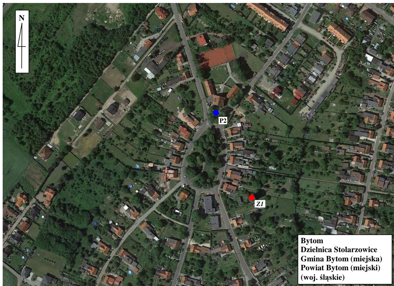
Ryc. 1 Szkic sytuacyjny rejonu badań poziomów pól elektromagnetycznych w środowisku; Państwowy Monitoring Środowiska, 2019 rok