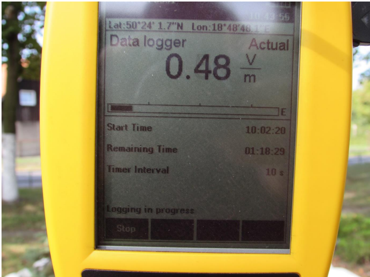
Fot. 3 Przyrząd pomiarowy w trakcie prowadzonego badania