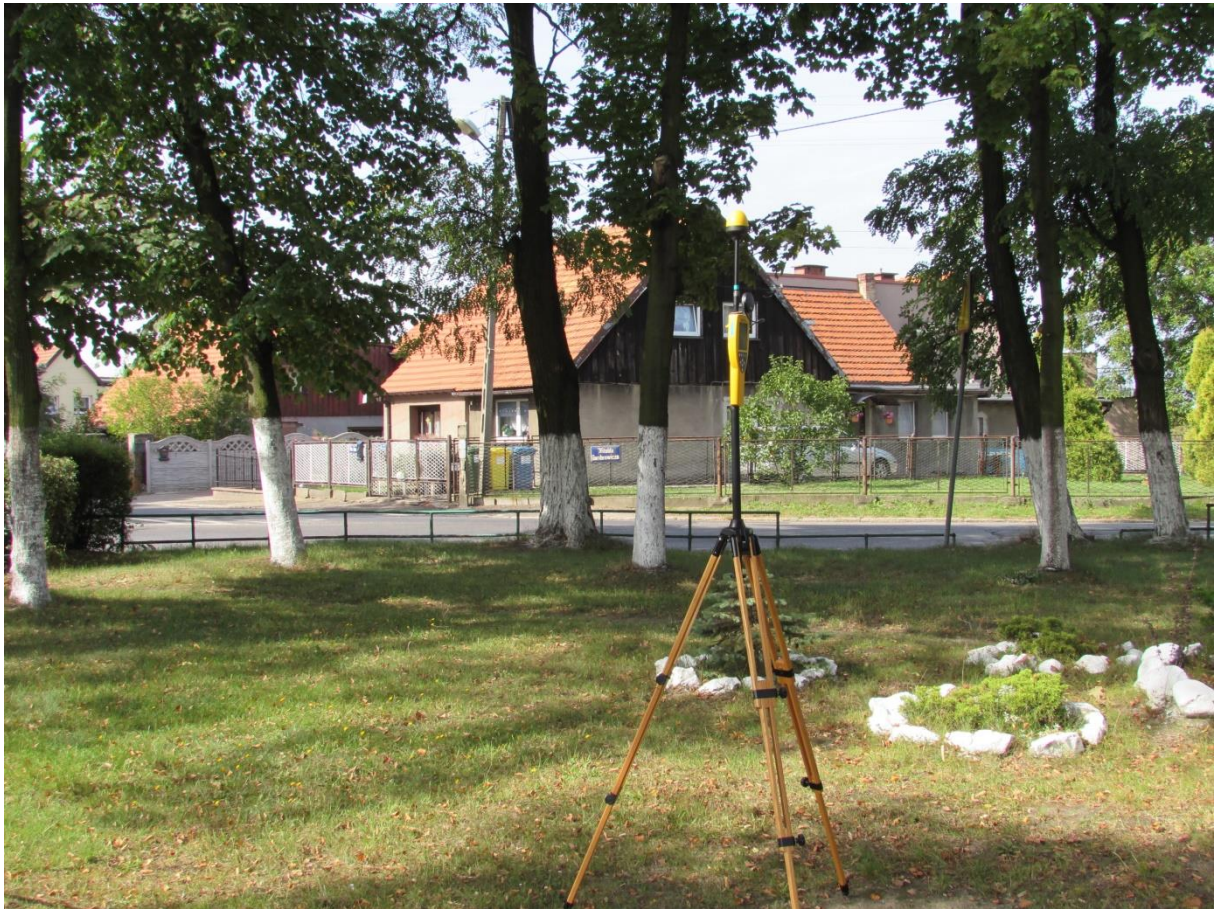
Fot. 2 Rejon badań, widok w kierunku południowo – zachodnim (SW)