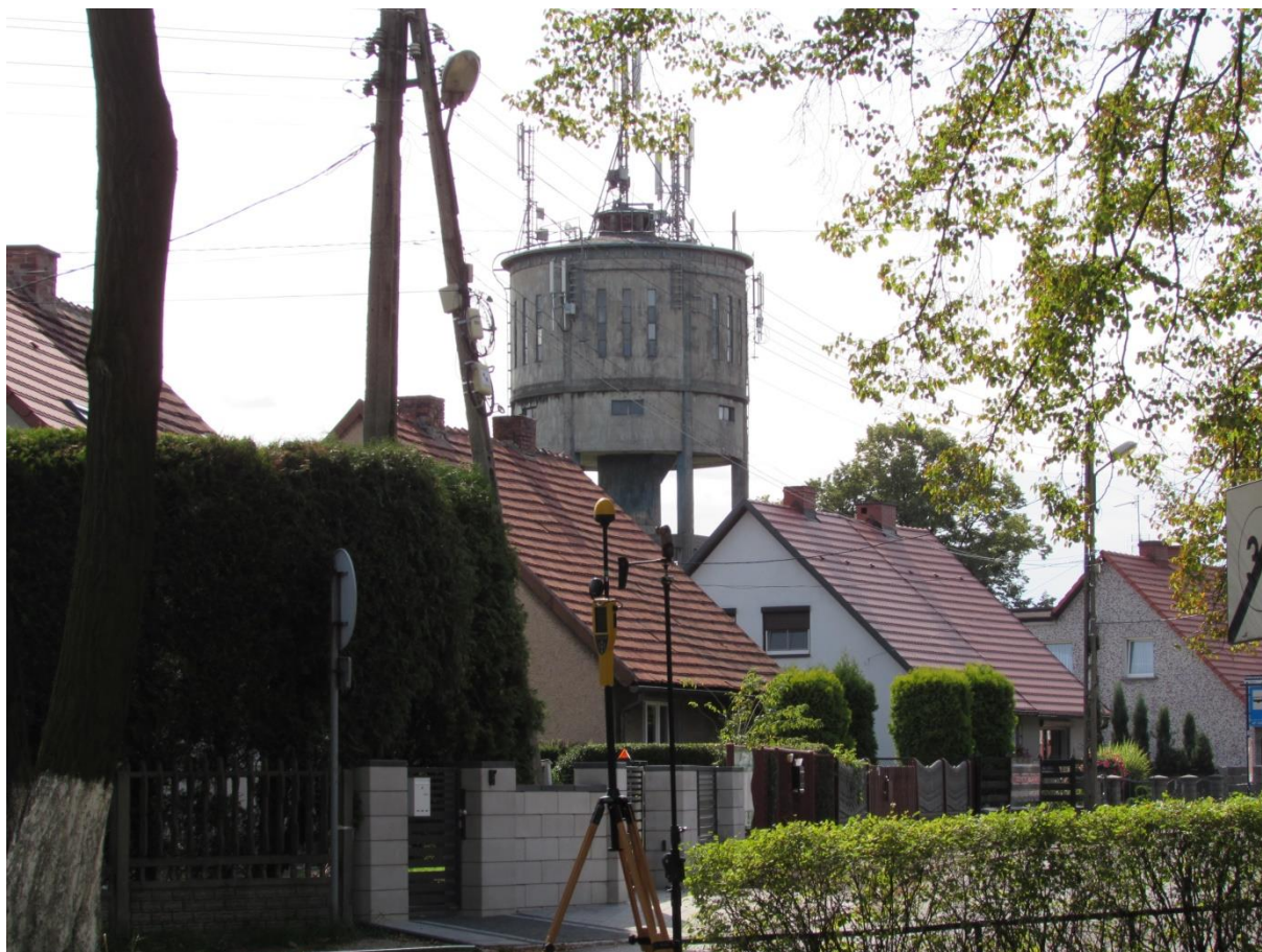
Fot. 1 Rejon badań, widok w kierunku południowo – wschodnim (NE)