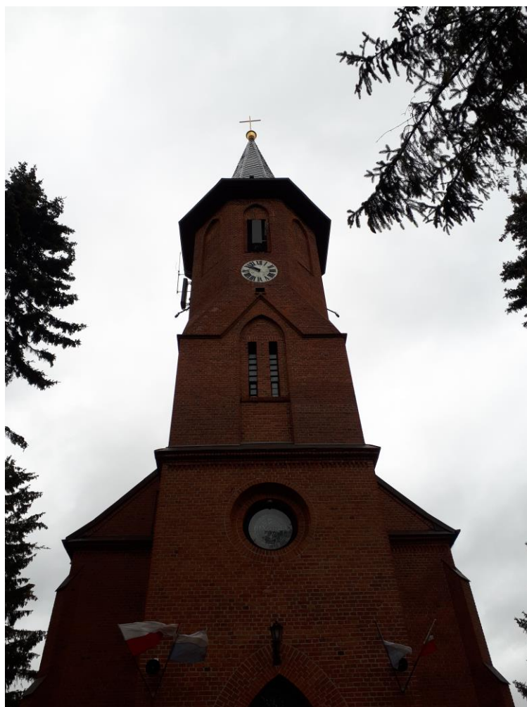
Fot. 1: Widok anten stacji bazowej ID: SZC1097_D, zlokalizowanej pod adresem: ul. Szczecińska 14, 71-786 Szczecin