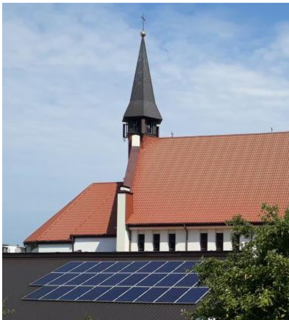
Fot. 1: Widok anten stacji bazowej: ID: KIE1069_A, zlokalizowanej pod adresem: ul. Osiedle na Stoku 1 dz. 85/2, 85-437 Kielce.