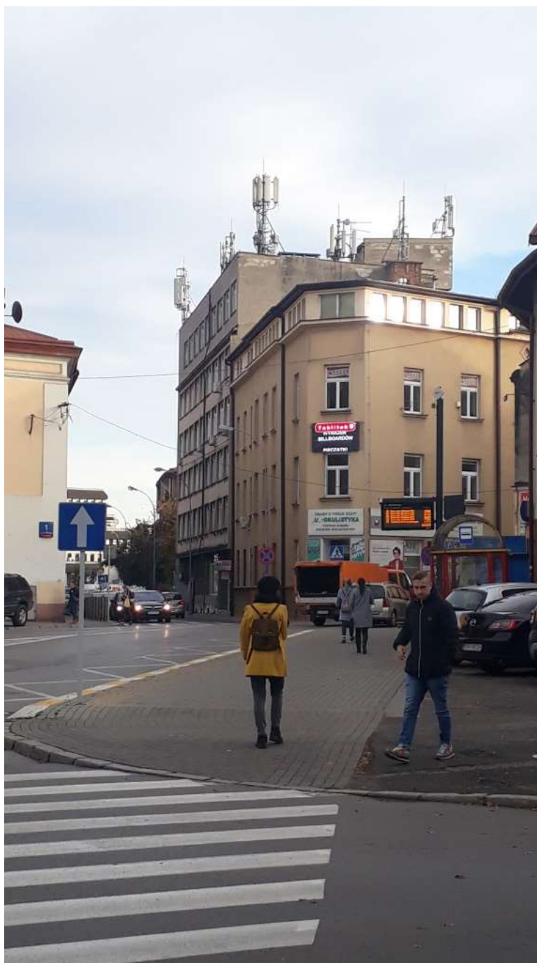
Fot. 1: Widoki anten stacji bazowych ID: 58188, ID: RZE1005 oraz ID: BT24865, zlokalizowanych: ul. Fredry 4, 35-005 Rzeszów