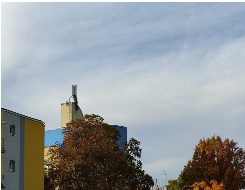
Fot. 1: Widoki anten stacji bazowej: ID: 2213, zlokalizowanej: ul. Ludwika Zamenhofa dz. nr 94, Zielona Góra