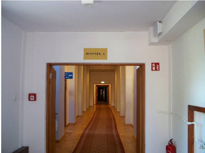
Ul. Nowy Świat