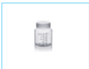
A - opakowanie właściwe