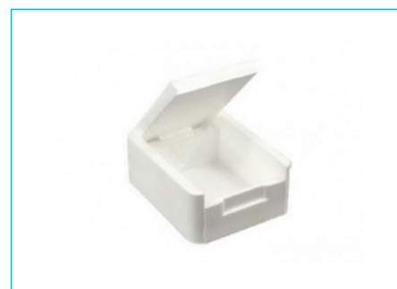
C - opakowanie drugorzędowe CC - czyste opakowanie drugorzędowe

Opracowanie: Fundacja Bank Mleka Kobięcego, Centrum Nauki o Laktacji, Fundacja Mlekiem Mamy