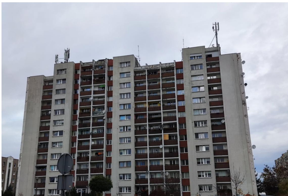
Fot. 1: Widoki anten stacji bazowych: ID: BT24116 oraz ID: OPO1527, zlokalizowanych: ul. Koszyka 13, Opole