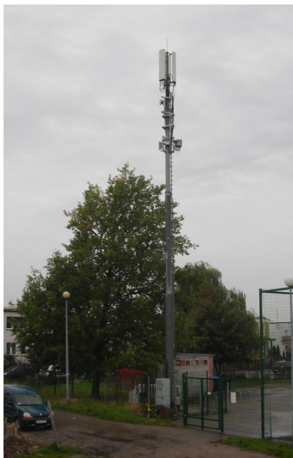
Fot. 1: Widok anten stacji bazowej: ID: BYD1018_B, zlokalizowanej pod adresem: ul. Barwna 14, 85-334 Bydgoszcz