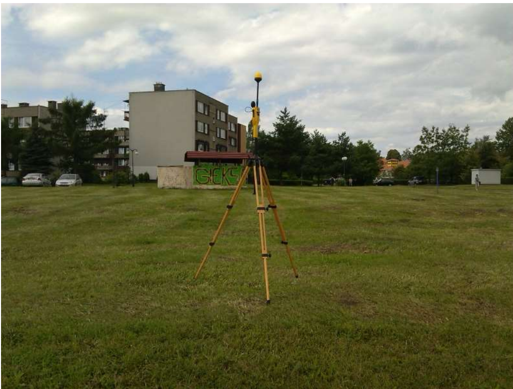
Fot. 2. Rejon badań, widok w kierunku południowo-zachodnim