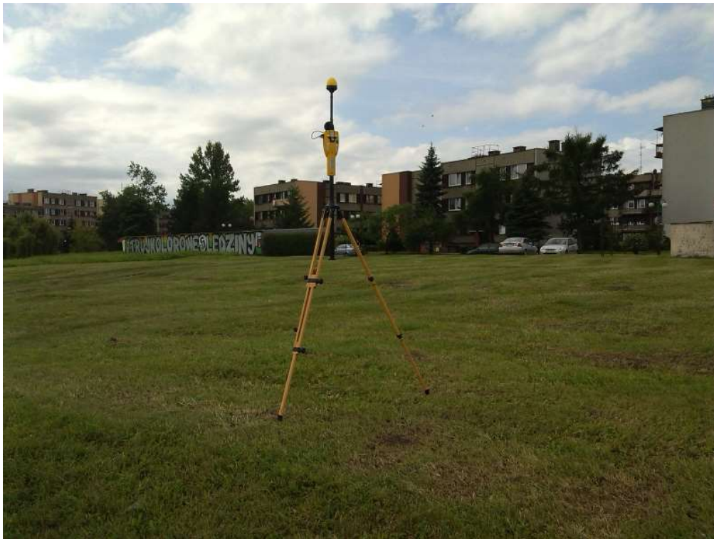
Fot. 3. Rejon badań, widok w kierunku południowo-wschodnim