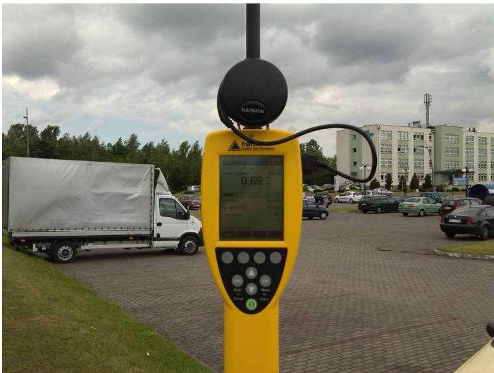
Fot. 4. Przyrząd pomiarowy w trakcie wykonywanego badania