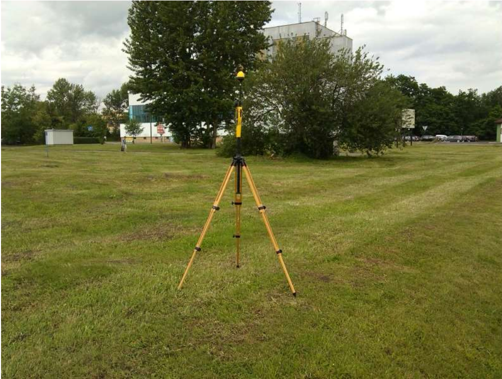
Fot. 1. Rejon badań, widok w kierunku północno-zachodnim