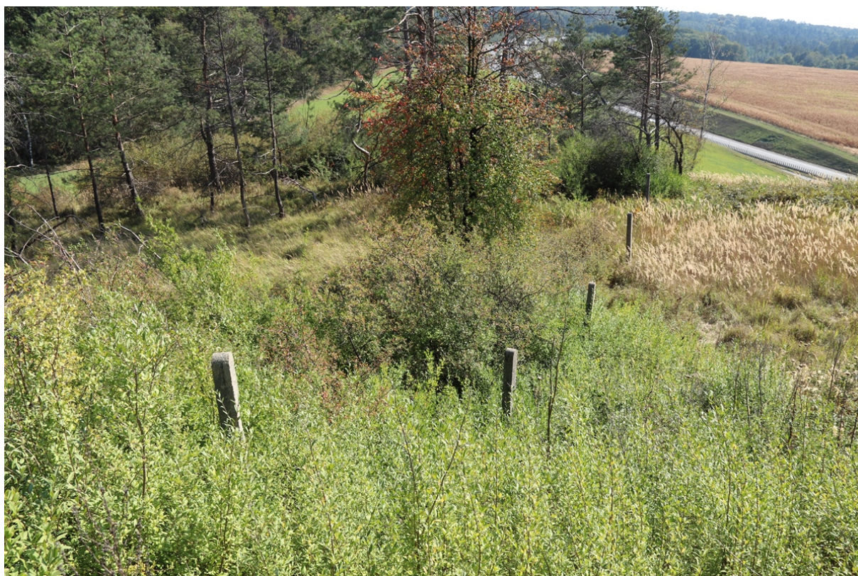
Zdj. 2. Wschodnia granica działki – przebieg ogrodzenia po zboczu