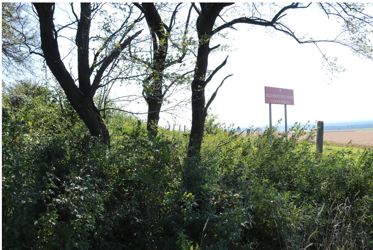
Zdj. 3. Zachodnia granica działki – początek ogrodzenia

5. Prace rozpoczną się nie wcześniej, niż 19.09.2022 r. Przedmiot umowy zostanie wykonany w terminie do 18.11.2022 r.