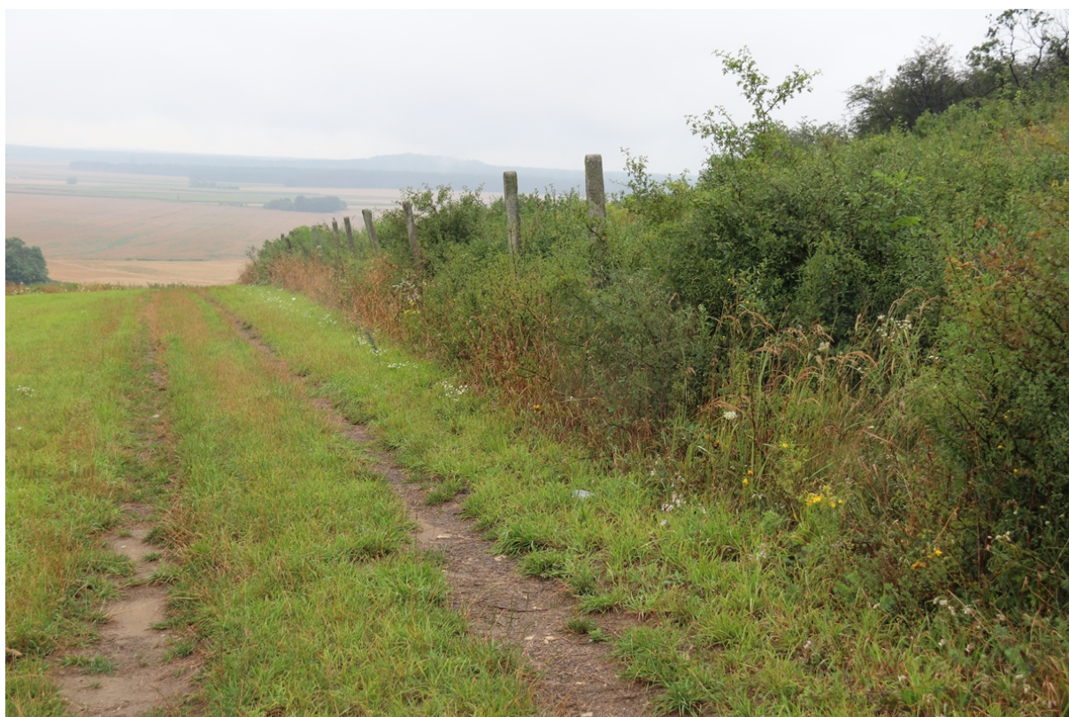
Zdj. 1. Przebieg ogrodzenia wzdłuż południowej granicy działki