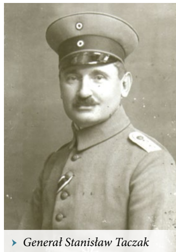
► Generał Stanisław Taczak

ny światowej miał stopień kapitana rezerwy. Zmobilizowany, obok 700 tys. rodaków z zaboru pruskiego, do armii niemieckiej, służył na froncie wschodnim. W momencie powstania państwa polskiego Taczak, jako pierwszy oficer Polak z armii niemieckiej, zgłosił się do służby w Wojsku Polskim i otrzymał przydział do Oddziału VII Sztabu Generalnego WP. Na wieść o rozruchach rewolucyjnych w Berlinie poprosił o urlop, aby udać się do żony i dzieci zamieszkujących wówczas w stolicy Niemiec. Będąc przejazdem w Poznaniu przyjął propozycję Naczelnej Rady Ludowej, która szukała kandydatów na tymczasowego wodza naczelnego powstania. Stanisław Taczak, awansowany na majora, szybko udowodnił, że wybór był więcej niż słuszny. W czasie ponad dwutygodniowego dowodzenia uporządkował chaos organizacyjny, panujący w ochotniczych jednostkach powstańczych i stworzył