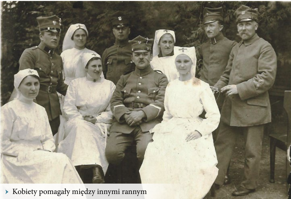
► Kobiety pomagały między innymi rannym

ność przekazywali kupcy, piekarze, rzeźnicy, rzemieślnicy, każdy kto tylko mógł, spontanicznie oddawał to co miał.