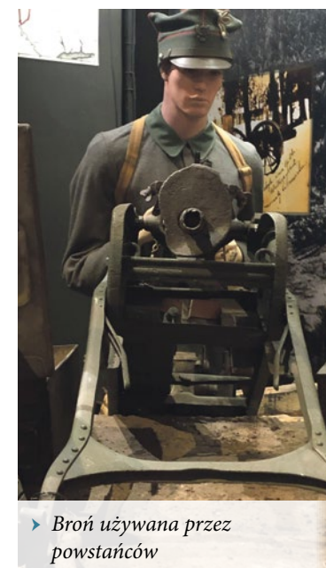
► Broń używana przez powstańców

szynowe MG08, w Polsce znane pod nazwą Maxim wz.08. Podczas walk powstańcom udało się zdobyć także armaty – występowały one w dwóch kalibrach: 77mm (wz.96n/A) oraz 152,4mm (pochodzenia rosyjskiego). Warto dodać, że podczas walk zarówno wojska powstańcze jak i niemieckie wykorzystywały pociągi pancerne. Do dziś zachował się wagon ze składu pociągu pancernego „Poznańczyk”, który można obejrzeć w poznańskim Muzeum Broni Pancernej – Oddziale Muzeum Wojska Polskiego. dp