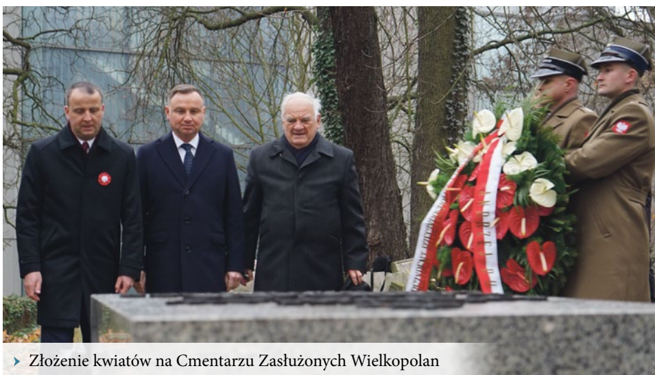
► Złożenie kwiatów na Cmentarzu Zasłużonych Wielkopolan

kuję za sprawne przeprowadzenie procesu legislacyjnego. To tutaj jest kolebka naszej państwowości, to tutaj narodziło się państwo Polan. Dziękuję za tę inicjatywę środowiskom, które pielęgnują tradycję i historię o Powstaniu Wielkopolskim – powiedział prezydent Andrzej Duda. – Dla nas Wielkopolan to waż-