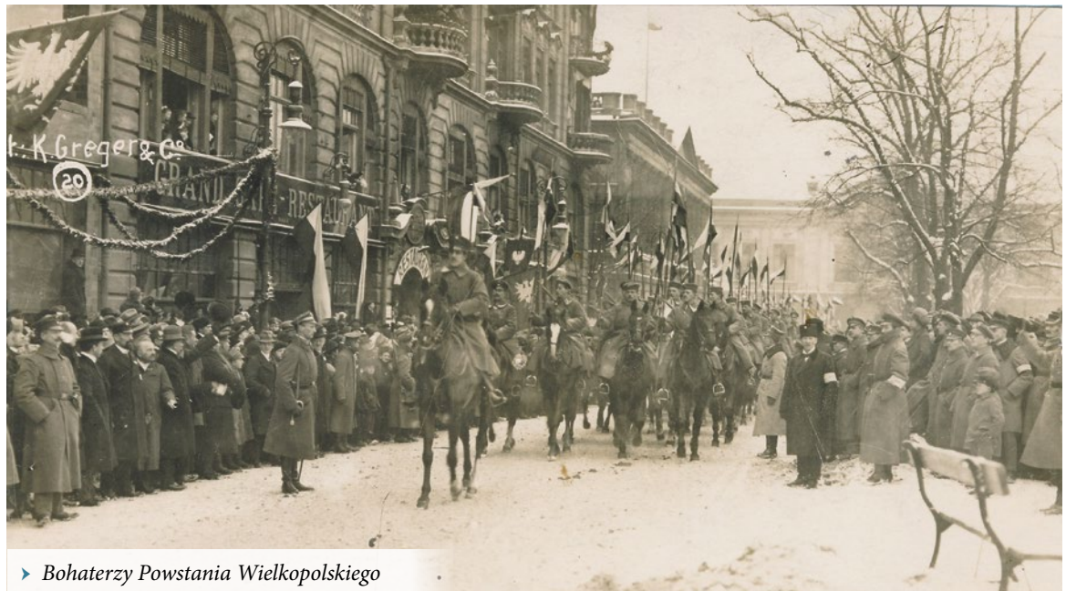
► Bohaterzy Powstania Wielkopolskiego

Sprzyjające warunki do odzyskania niepodległości po latach zaborów powstały dla Polski dopiero w 1918 r., w wyniku rozwoju sytuacji międzynarodowej. Przywódcy ruchu niepodległościowego w Poznańskim uznali, że należy zacząć od postanowienia traktatu pokojowego. Wybuch powstania nastąpił 27 grudnia 1918 r. jako reakcja na wystąpienia Niemców, stanowiące z kolei odpowiedź na polskie manifestacje wywołane wizytą Ignacego Paderewskiego w Poznaniu. Powstanie można podzielić