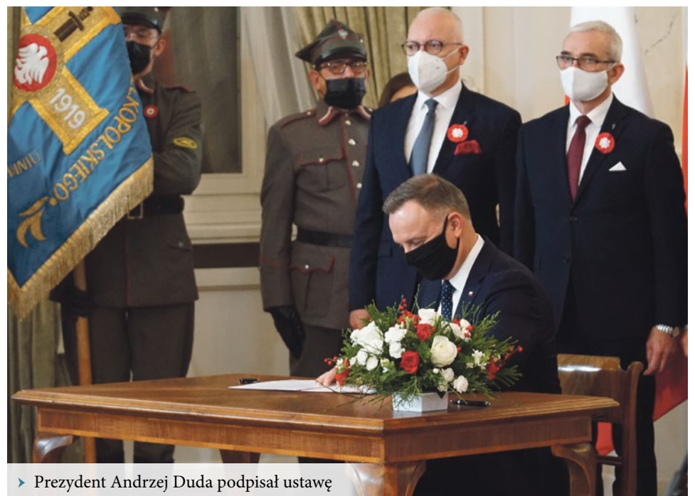
► Prezydent Andrzej Duda podpisał ustawę

resowanie, dzięki czemu wśród mieszkańców zebrano 10 000 podpisów w trzy dni. W projekcie ustawy zapisano, że znaczenie Powstania Wielkopolskiego dla przywrócenia naszej Ojczyzny na mapę polityczną Europy było trudne do przecenienia. – Cieszę się, że dziś w tej sali mogłem dokonać symbolicznego aktu kończącego ustanowienie 27 grudnia Narodowym Dniem Zwycięskiego Powstania Wielkopolskiego. Chcę z całego serca podziękować, że obie Izby Parlamentu, bez zbędnych dyskusji, wspólnie ustanowiły ten dzień. Dzię-