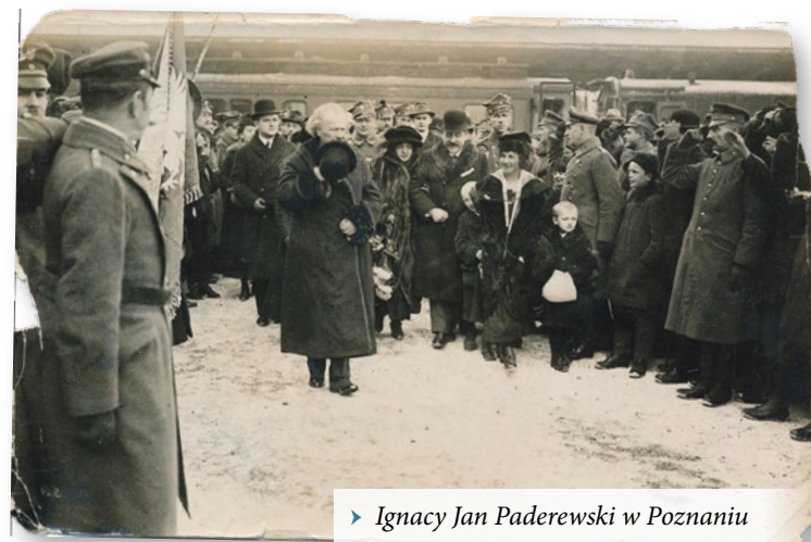
► Ignacy Jan Paderewski w Poznaniu

ta USA Thomasa Woodrowa Wilsona i skłonić go do poparcia postulatów odbudowy państwa polskiego. Przyjazd Paderewskiego do stolicy Wielkopolski wieczorem 26 grudnia 1918 roku wywołał olbrzymią radość wśród jej mieszkańców. Przed hotelem „Bazar” zgromadziła się wielotysięczna manifestacja patriotyczna, co rozwścieczyło Niemców. O wybuchu powstania przesądziły wystrzały