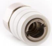
Rys 5. Złącze AGA.