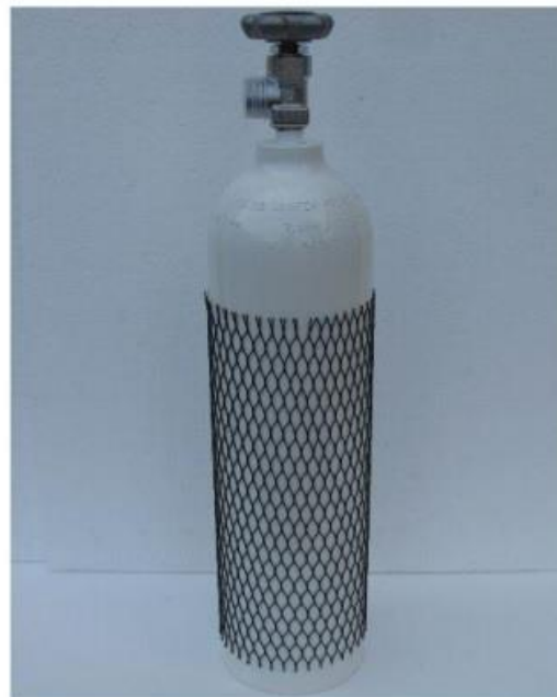
Rys 1. Butla tlenowa 2,7 l.