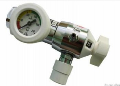
Rys 2. Przykładowy reduktor ze złączem AGA zamiennie z możliwością realizacji tlenoterapii biernej.