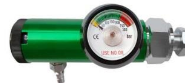
Rys 3. Przykładowy reduktor ze złączem do realizacji tlenoterapii biernej.