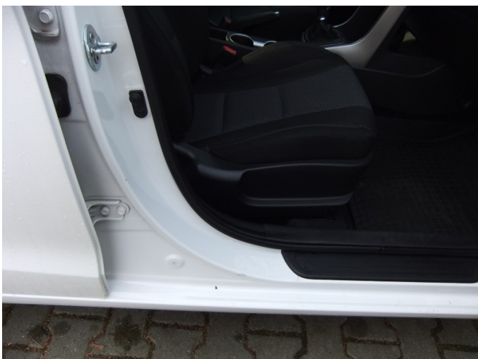
Poszycie zewnętrzne progu prawego