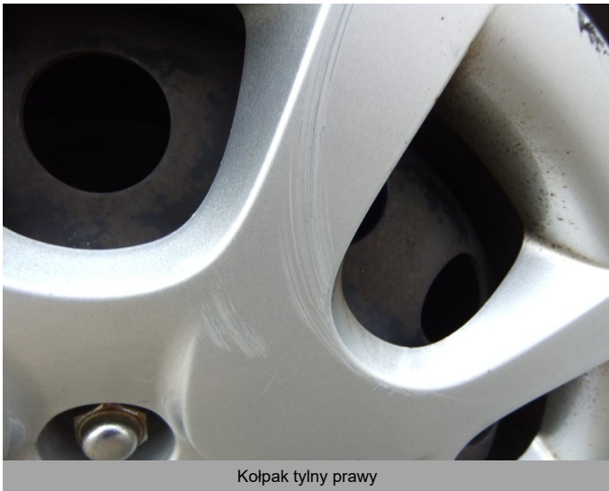
Kołpak tylny prawy