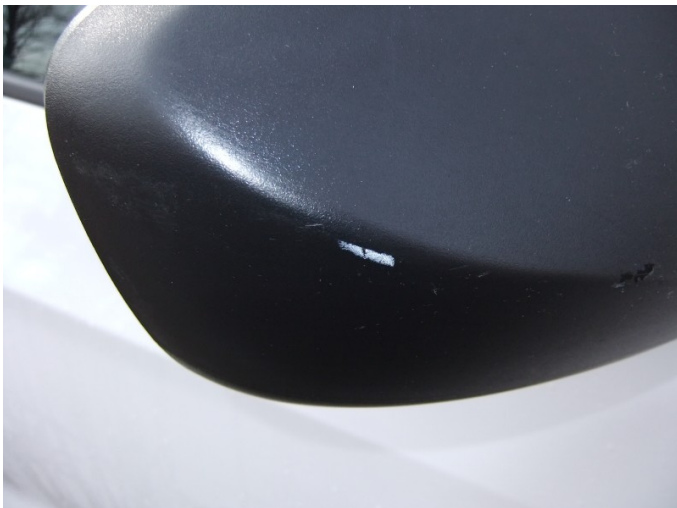
Obudowa lusterka prawego