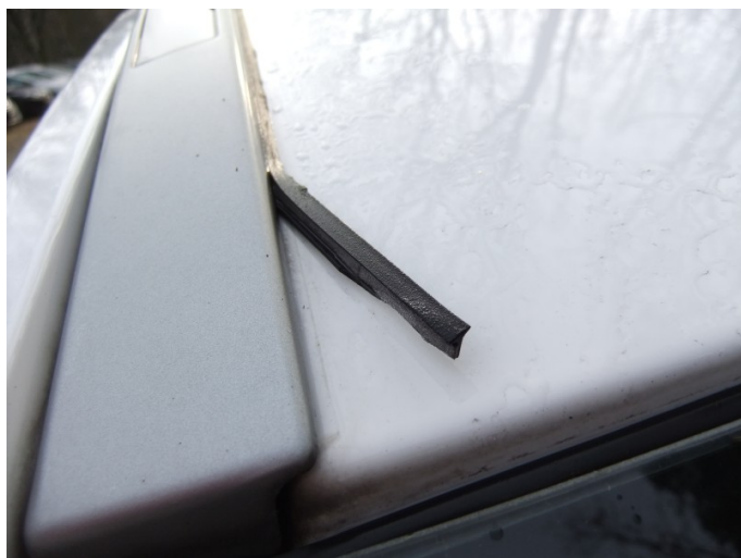
Uszczelka listwy dachowej p