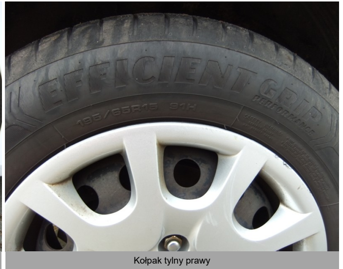
Kołpak tylny prawy