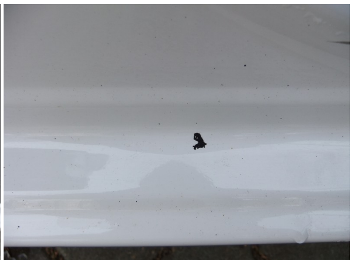
Poszycie zewnętrzne progu prawego