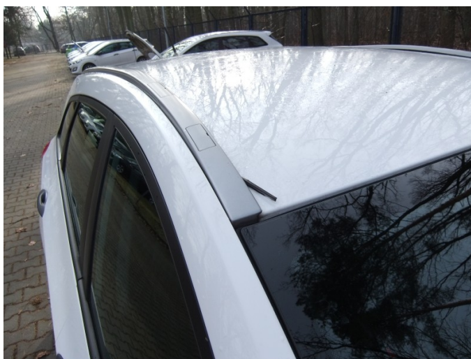
Uszczelka listwy dachowej p