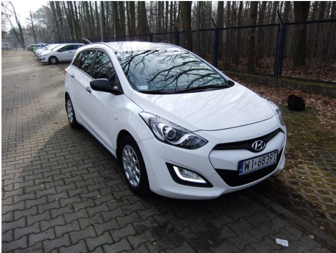
Obudowa lusterka prawego