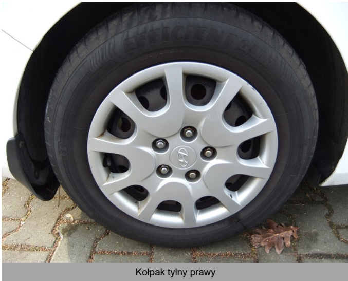
Kołpak tylny prawy