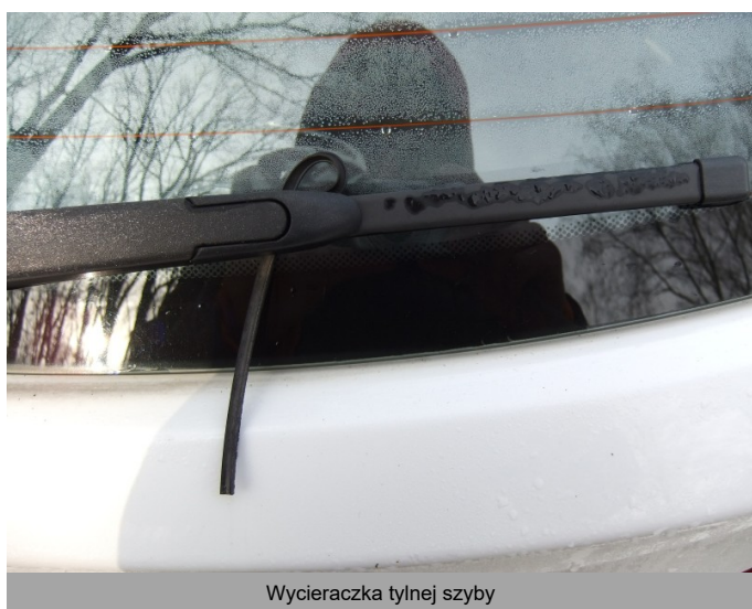
Wycieraczka tylnej szyby