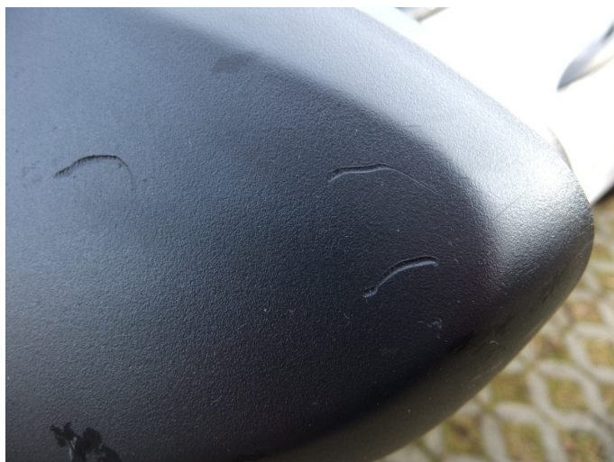
Obudowa lusterka lewego