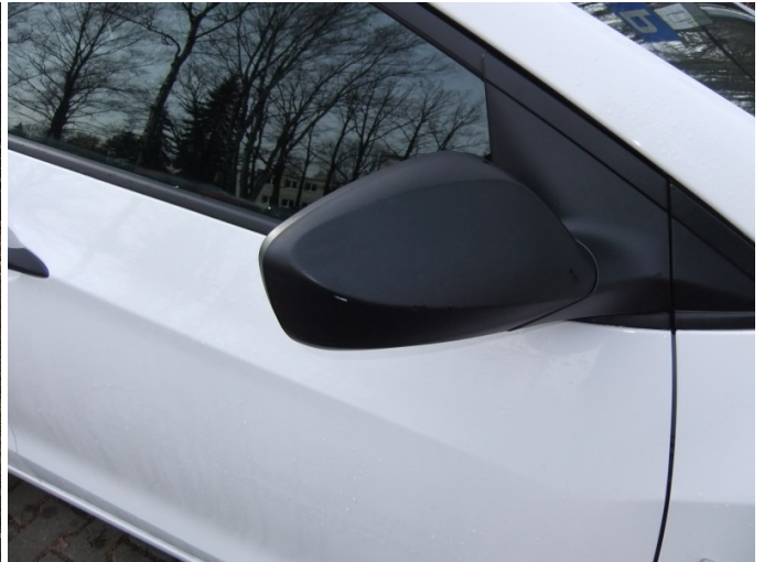
Obudowa lusterka prawego