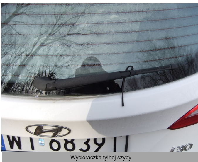
Wycieraczka tylnej szyby