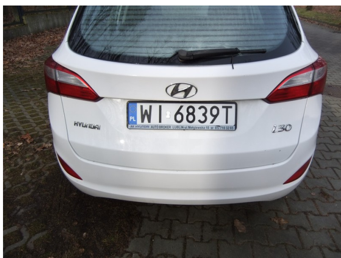
Wycieraczka tylnej szyby