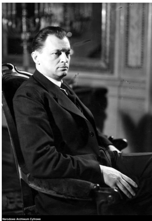
Witold Grabowski, minister sprawiedliwości. Fotografia portretowa, 1936 r.

Witold Grabowski urodził się 19 marca 1898 r. na Kaukazie Południowym, w ówczesnym Imperium Rosyjskim (w źródłach jako miejsce jego uro-