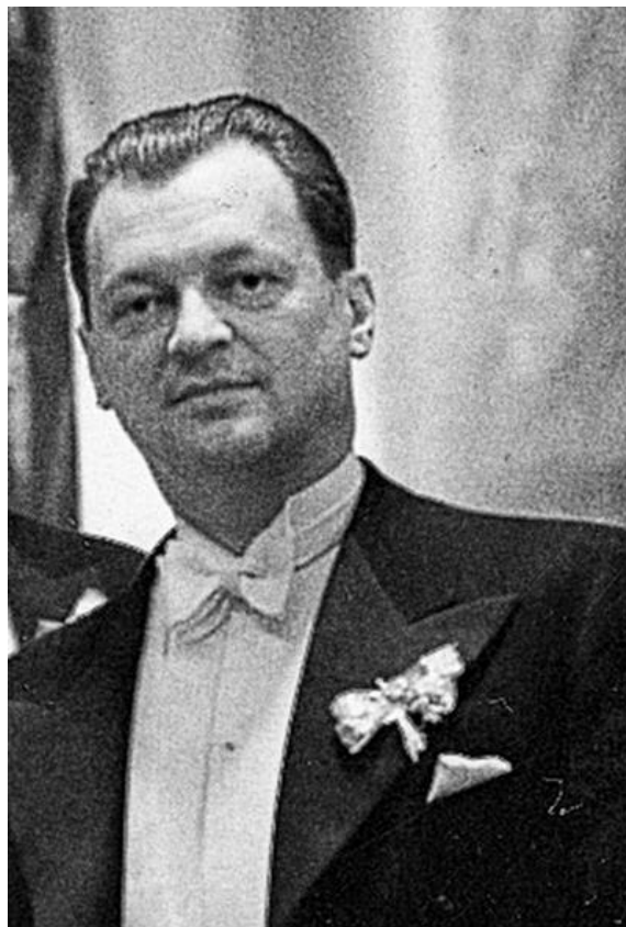
Senator Witold Grabowski.

czął służbę w wojsku brytyjskim jako zwykły żołnierz, biorąc udział w walkach w Afryce Północnej. Awansował tam do stopnia majora.