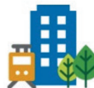
NEUTRALNE DLA KLIMATU I INTELIĞENTNE MIASTA