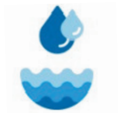
ZDROWE OCEANY, MORZA, WODY PRZYBRZEŻNE I ŚRÓDLĄDOWE