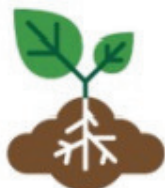
STAN GLEBY ORAZ ŻYWNOŚĆ