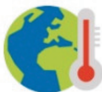
PRZYSTOSOWANIE SIĘ DO ZMIANY KLIMATU, W TYM DO TRANSFORMACJI SPOŁECZNEJ