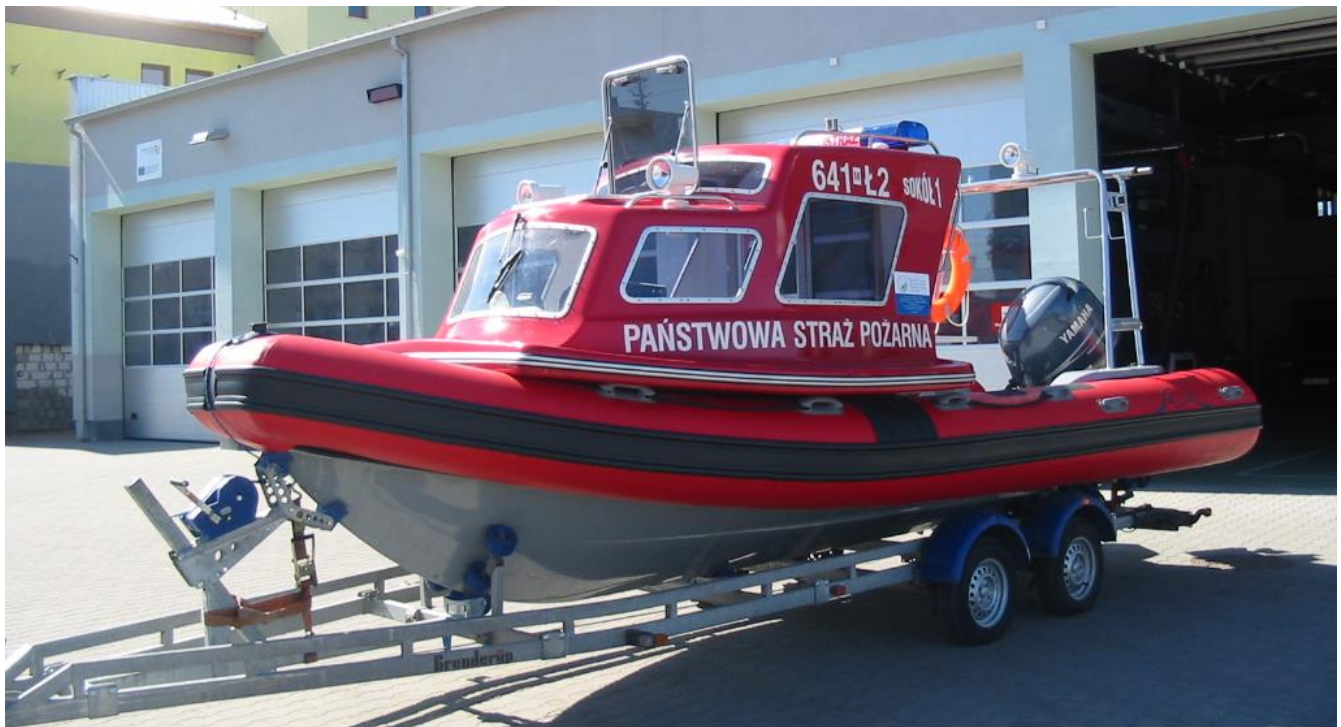
Łódź ratownicza hybrydowa typu RIB 690 z przyczepką podłodziową