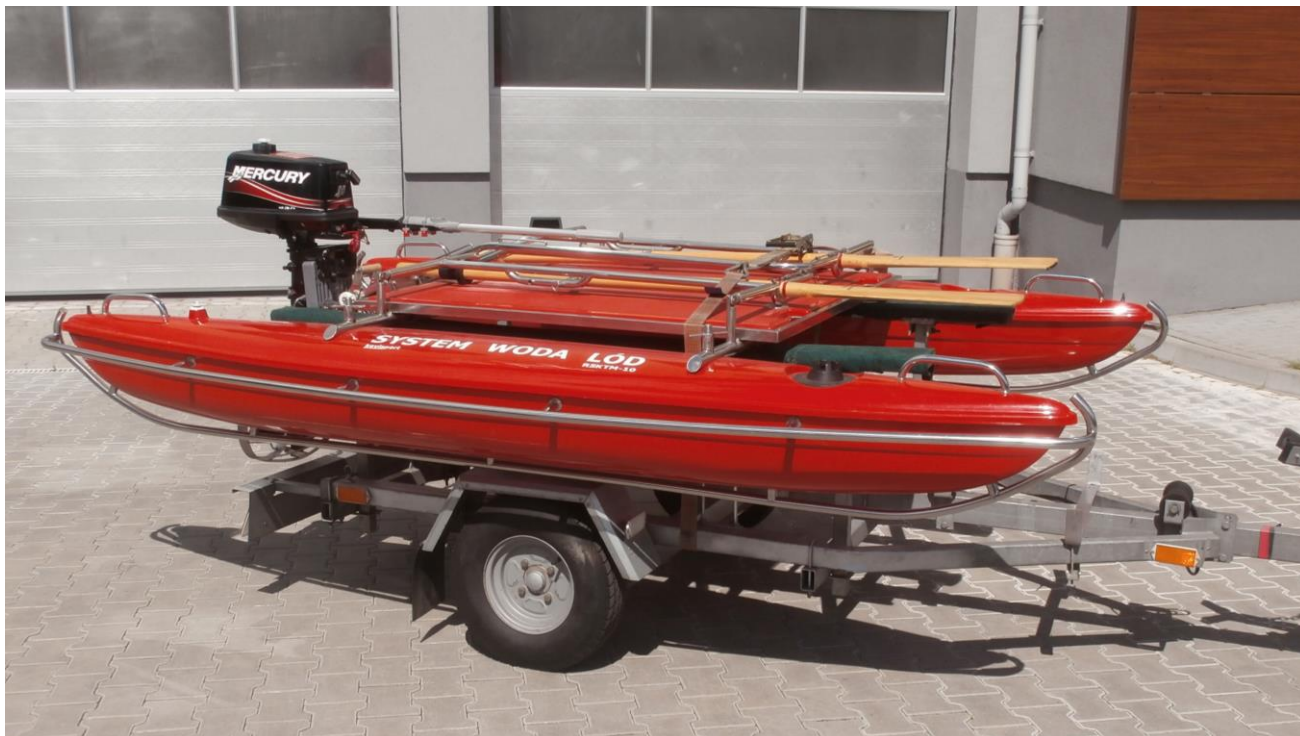
Tratwa typu KATAMARAN z wyposażeniem System Woda Lód RSKTM – 10