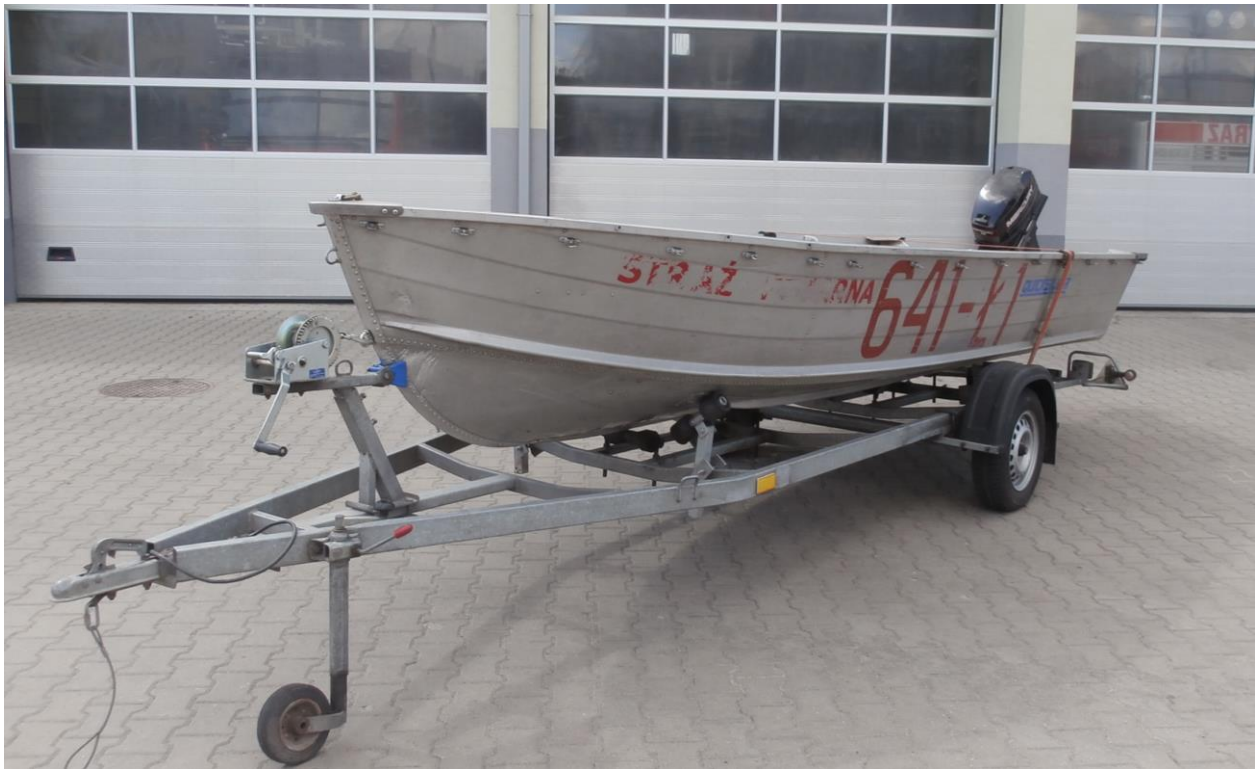
Łódź ratownicza aluminiowa typ QS – 500 – SF z przyczepką podłodziową