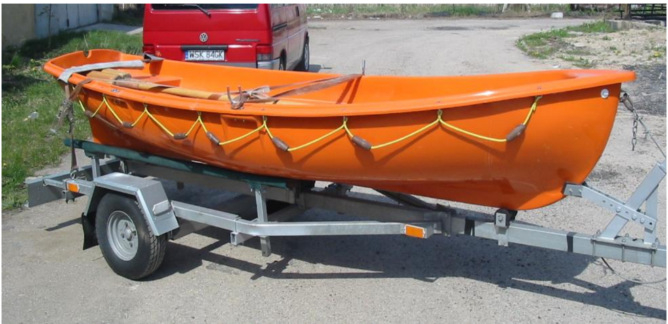
Łódź wiosłowa „Perkoz” z przyczepką podłodziową