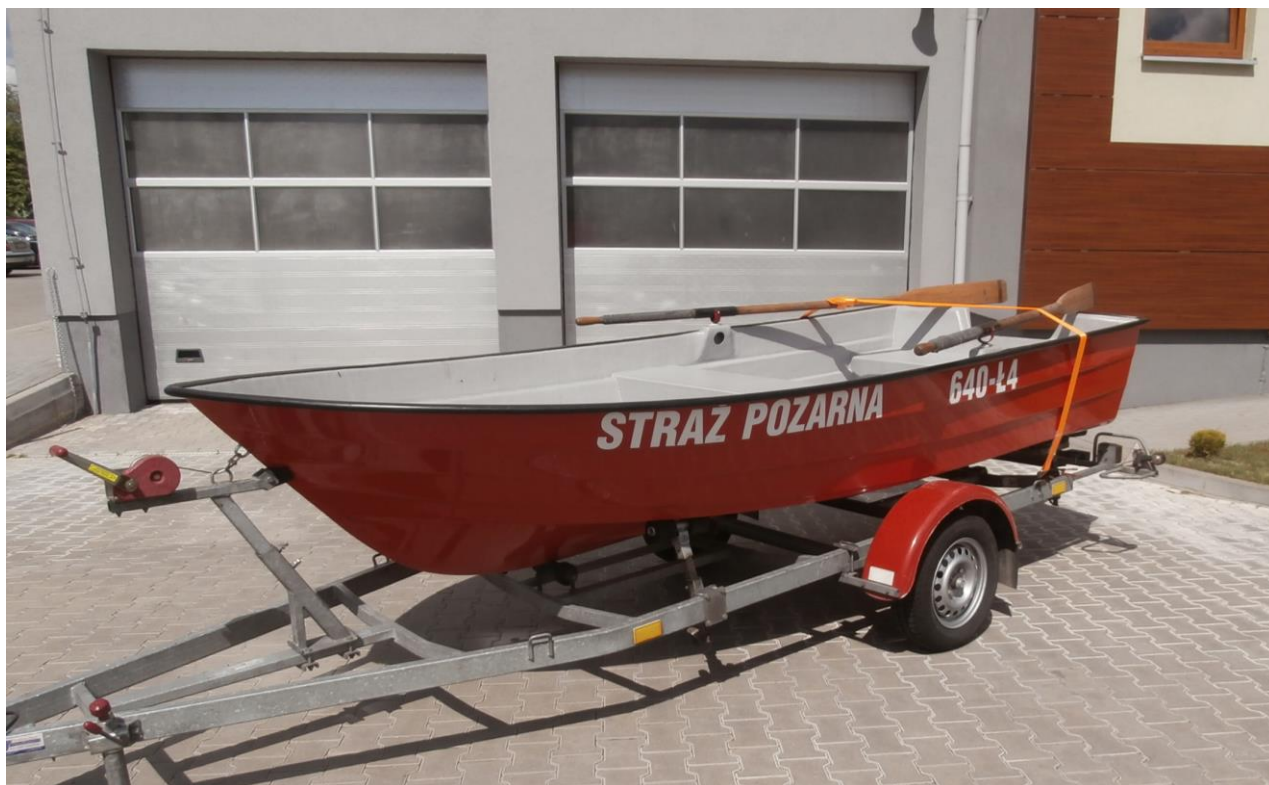
Łódź wiosłowa BL – 2 z przyczepką podłodziową