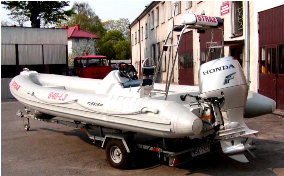
Pneumatyczna łódź motorowa z dnem laminowanym – AVA – RIB 600 z silnikiem zaburtowym Honda Marine BF90A i przyczepką podłodziową.