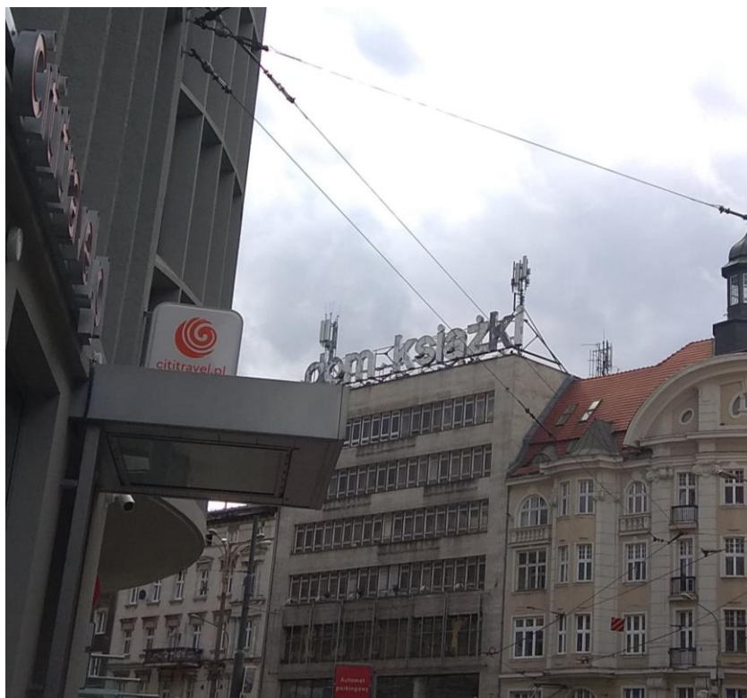
Fot. 1: Widok anten stacji bazowych: ID: BT32298, ID: BT 71113N!, zlokalizowanych pod adresem: ul. Gwarna 13, 61-702 Poznań