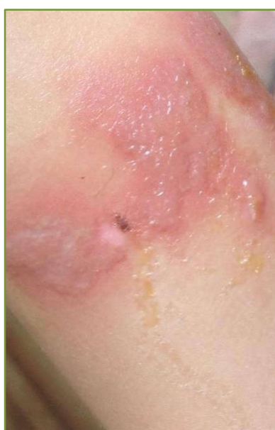
Rys. 2. Poparzenie barszczem Sosnowskiego