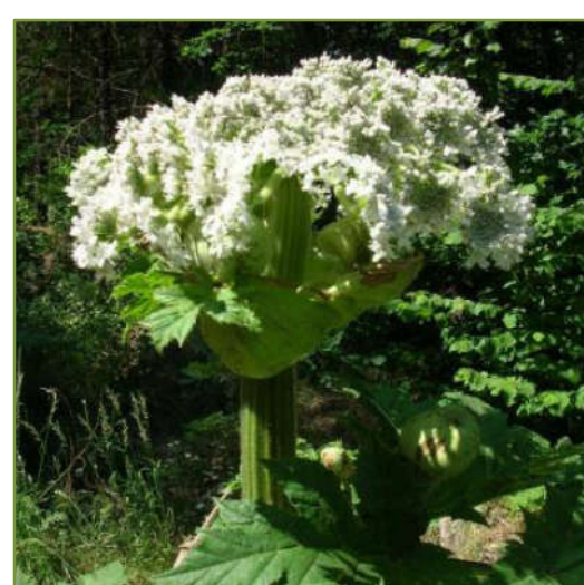
Rys. 8. Nie w pełni rozwinięty kwiatostan barszczu

Nazwa barszczu Sosnowskiego pochodzi od nazwiska rosyjskiego botanika, odkrywcy tego gatunku, Dimitra Iwanowicza Sosnowskiego.