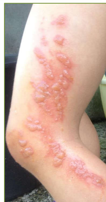
Rys. 1. Poparzenie barszczem Sosnowskiego