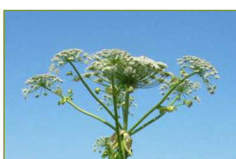
Rys. 7. Kwiatostan barszczu Sosnowskiego