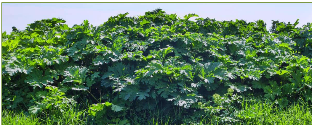
Rys. 10. Bujne liście barszczu

W Polsce barszcz Sosnowskiego jest objęty prawnym zakazem uprawy, rozmnażania i sprzedaży.