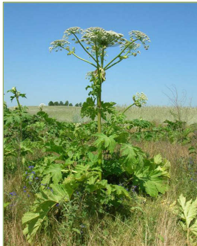
Rys. 3. Kwitnący barszcz Sosnowskiego wśród pól

Furanokumaryny są emitowane do otoczenia, toteż mogą osadzać się na skórze, nie tylko w bezpośrednim kontakcie z rośliną, ale także poprzez powietrze, co ma miejsce szczególnie w upalne, wilgotne dni. Wdychanie olejków eterycznych może powodować bóle i zawroty głowy oraz nudności.