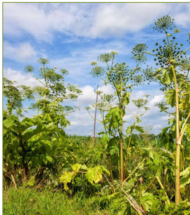
Rys. 9. Stoisko barszczu Sosnowskiego

W Polsce barszcz Sosnowskiego najchętniej uprawiany był na Podhalu, Podkarpaciu i Przegórzu Sudeckim. Po niedługim czasie, z powodu problemów z uprawą i zbiorem (głównie ze względu na zagrożenie dla zdrowia), uprawy zostały porzucone, jednak gatunek zaczął rozprzestrzeniać się samorzutnie. W latach 80-tych barszcz Sosnowskiego zaczął być opisywany jako gatunek inwazyjny. Od tego czasu jego liczebność i rozprzestrzenianie się bezustannie wzrasta. Spotykany jest już w całej Polsce, szczególnie na Podhalu w dolinach rzecznych.