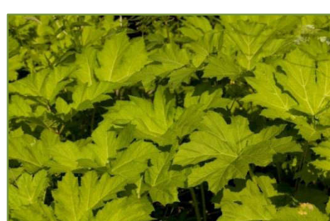
Rys. 6. Liście barszczu Sosnowskiego