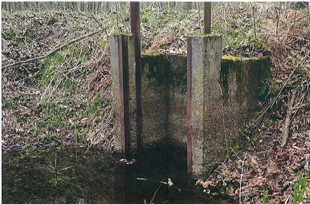
Fotografia 2. Zdjęcie mnicha w obszarze Natura 2000 Diabelski Staw koło Radomicka PLH 080056