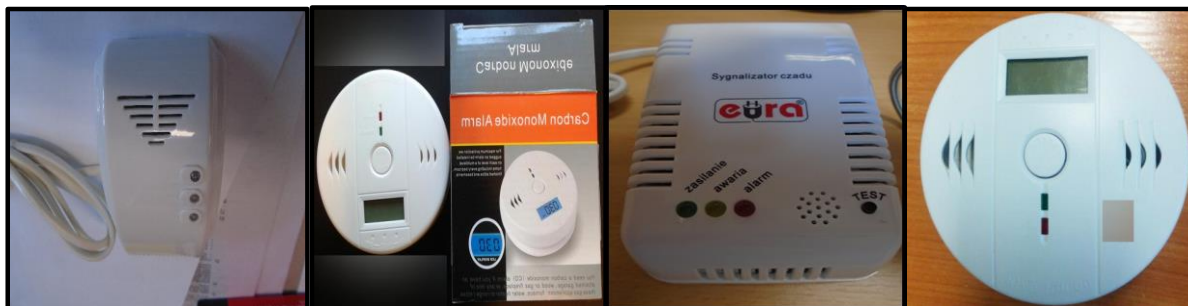
model XTREME XC20