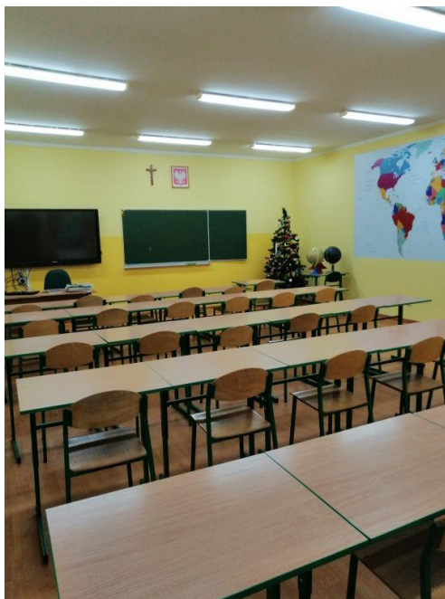
Fot.2. Szkoła Podstawowa im. Jana Pawła II w Lipce, ul. Szkolna 6