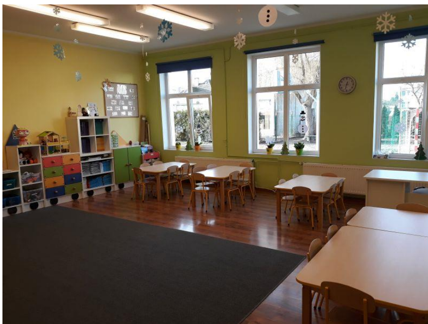
Fot.3. Zespół Szkół Katolickich im. Św. Wojciecha w Żłotowie, ul. Moniuszki 18