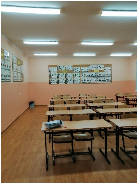
Fot.1. Szkoła Podstawowa im. Jana Pawła II w Lipce, ul. Szkolna 6