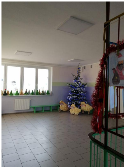
Fot.5. Szkoła Podstawowa im. Jana Pawła II w Lipce, ul. Szkolna 6 (budynek przy ul. Gajowej 4)

gimnastycznej, zlikwidowanie stopni z ziemi i krawężników prowadzących na boisko i wykonanie nowych schodów z kostki polbrukowej z ciekim odprowadzającym nadmiar wody.