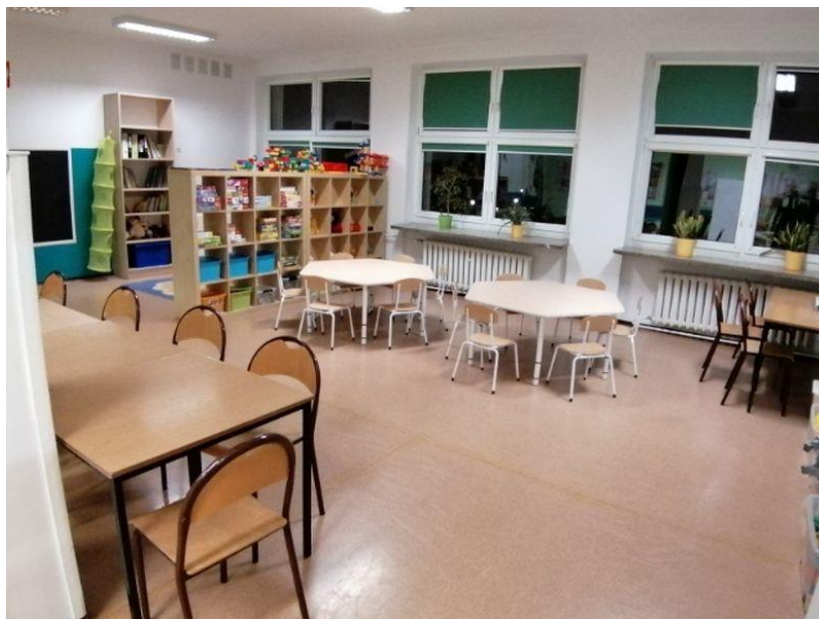
Fot.9. Szkoła Podstawowa nr 3 w Złotowie, ul. Królowej Jadwigi 54

Na dzień 31 grudnia 2019 roku pod nadzorem PPIS w Złotowie były 84 placówki nauczania i wychowania: 10 żłobków, 29 przedszkoli (3 niepubliczne punkty przedszkolne, w tym 1 specjalny), 26 szkół podstawowych, w tym 4 szkoły filialne, 4 zespoły szkół, 1 szkoła policealna oraz: 1 szkoła muzyczna, 2 placówki opiekuńczo-wychowawcze, 1 placówka kształcenia ustawicznego, Młodzieżowy Ośrodek Socjoterapii, 1 świetlica socjoterapeutyczna, 3 świetlice środowiskowe oraz 5 świetlic opiekuńczo-wychowawczych. W trakcie prowadzonego bieżącego nadzoru sanitarnego stwierdza się z roku na rok poprawę placówek nauczania i wychowania pod względem sanitarno-higienicznym.