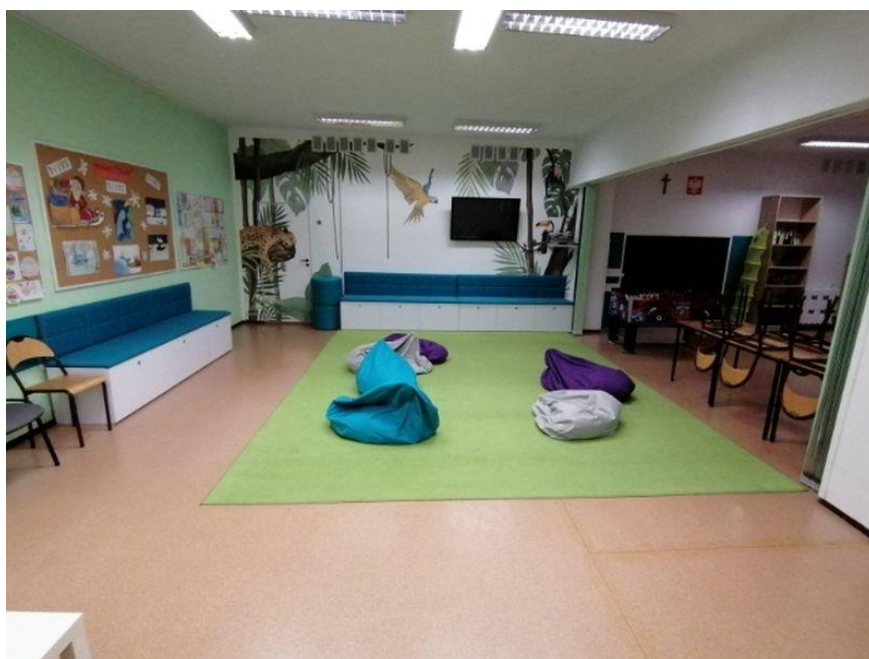
Fot.8. Szkoła Podstawowa nr 3 w Żłotowie, ul. Królowej Jadwigi 54