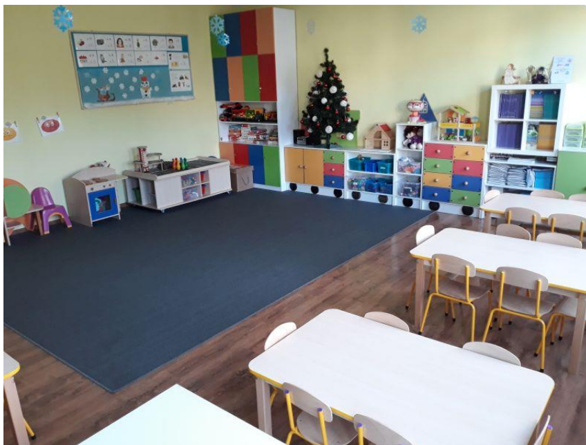
Fot.4. Zespół Szkół Katolickich im. Św. Wojciecha w Żłotowie, ul. Moniuszki 18