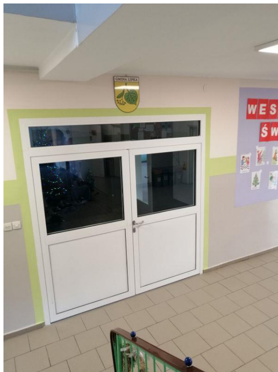
Fot.7. Szkoła Podstawowa im. Jana Pawła II w Lipce, ul. Szkolna 6 (budynek przy ul. Gajowej 4)