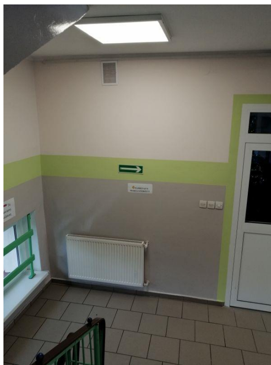
Fot.6. Szkoła Podstawowa im. Jana Pawła II w Lipce, ul. Szkolna 6 (budynek przy ul. Gajowej 4)