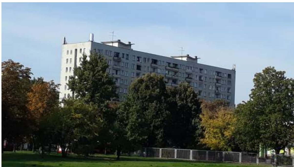
Fot. 1: Widoki anten stacji bazowej ID: WAR2146, zlokalizowanej: ul. Chodecka 1, 03-332 Warszawa.