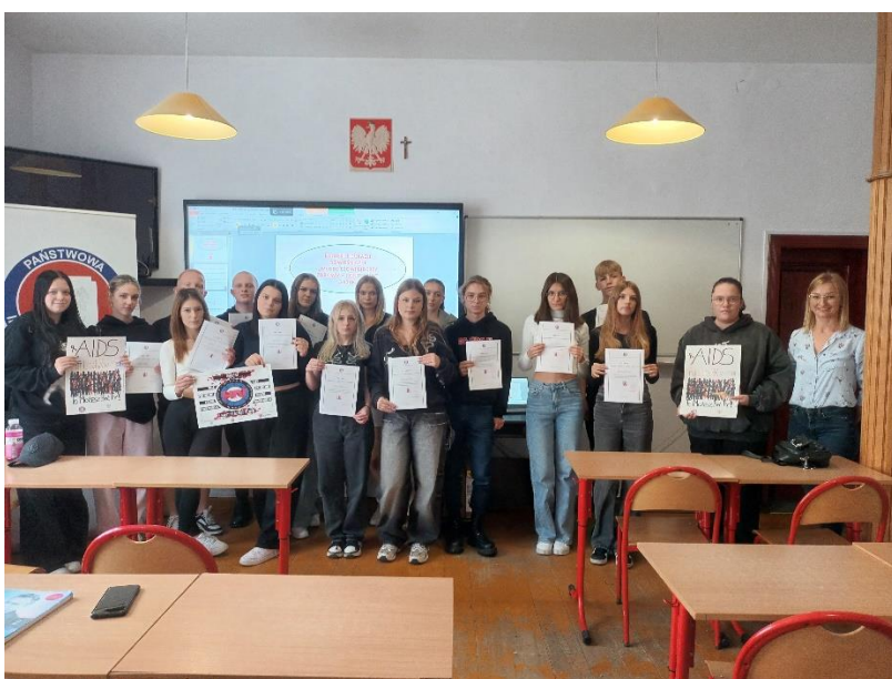
Opracowała: asystent Karolina Krzemińska Sekcja Higieny Dzieci, Młodzieży i Promocji Zdrowia Powiatowej Stacji Sanitarno-Epidemiologicznej w Chodzieży, 2024r.