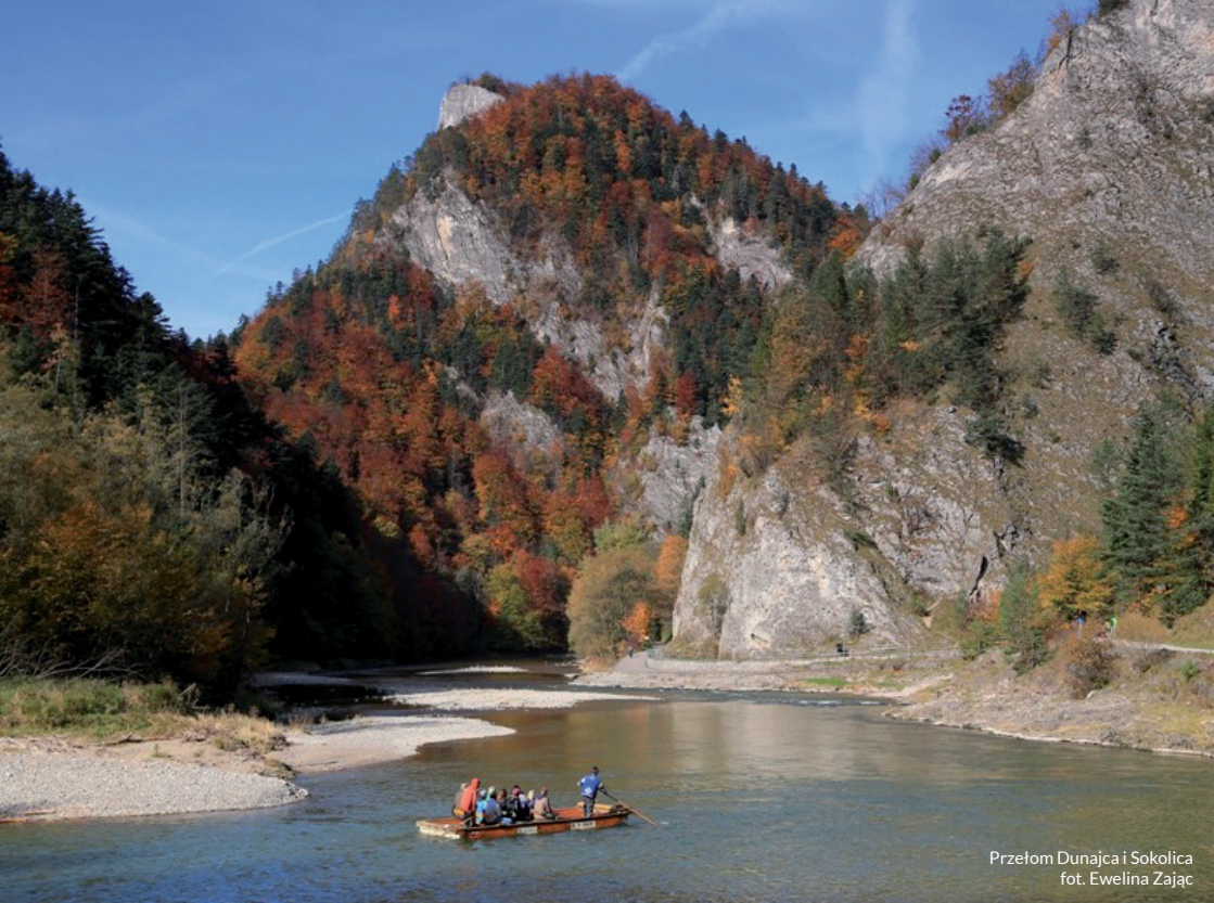
Przełom Dunajca i Sokolica