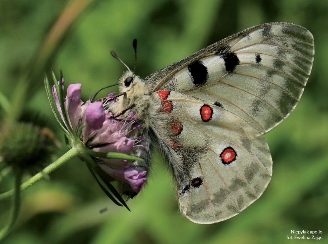
Niepylak apollo