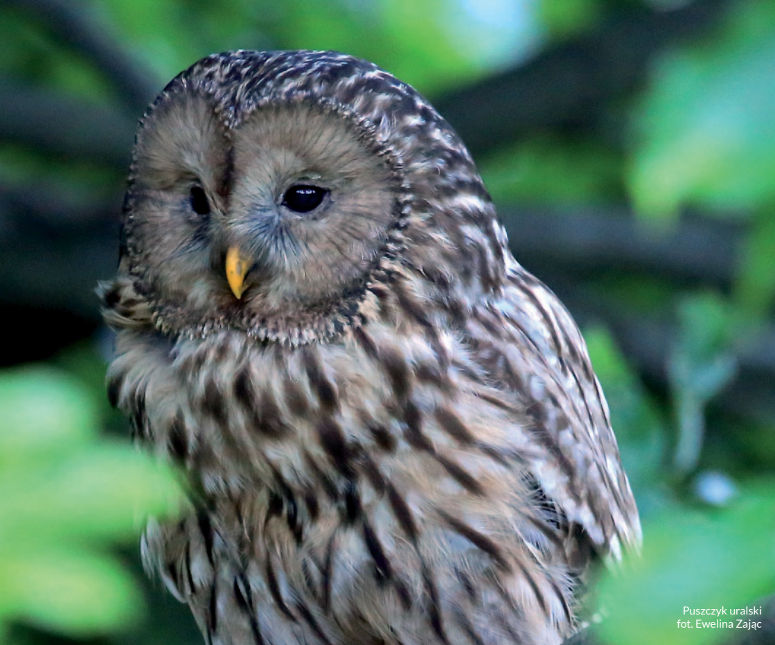
Puszczyk uralski