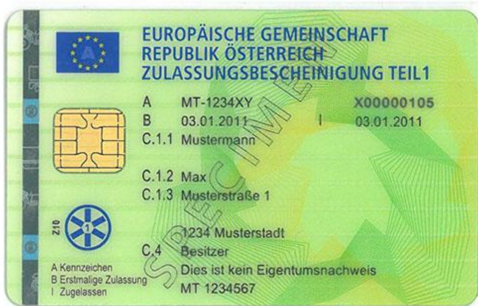
Wzór nowego austriackiego dowodu rejestracyjnego - część I w formie karty mikroprocesorowej - rewers