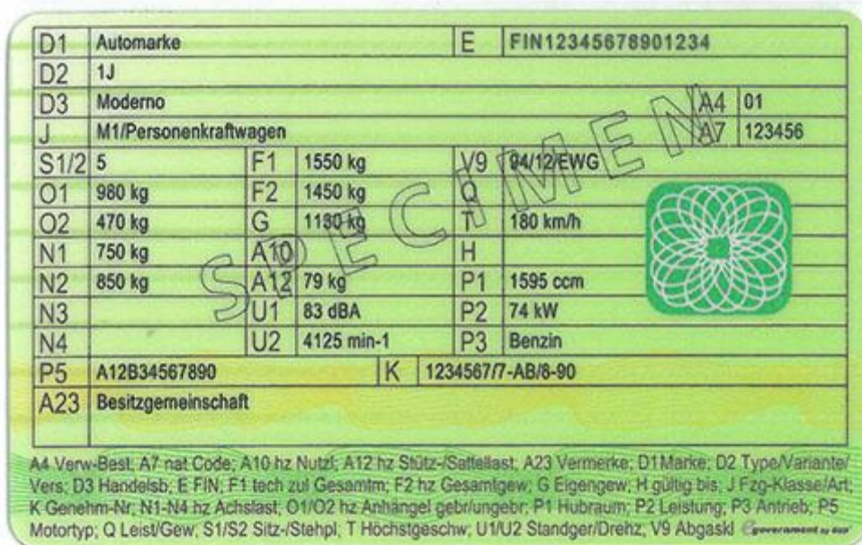
Wzór nowego austriackiego dowodu rejestracyjnego - część II - awers